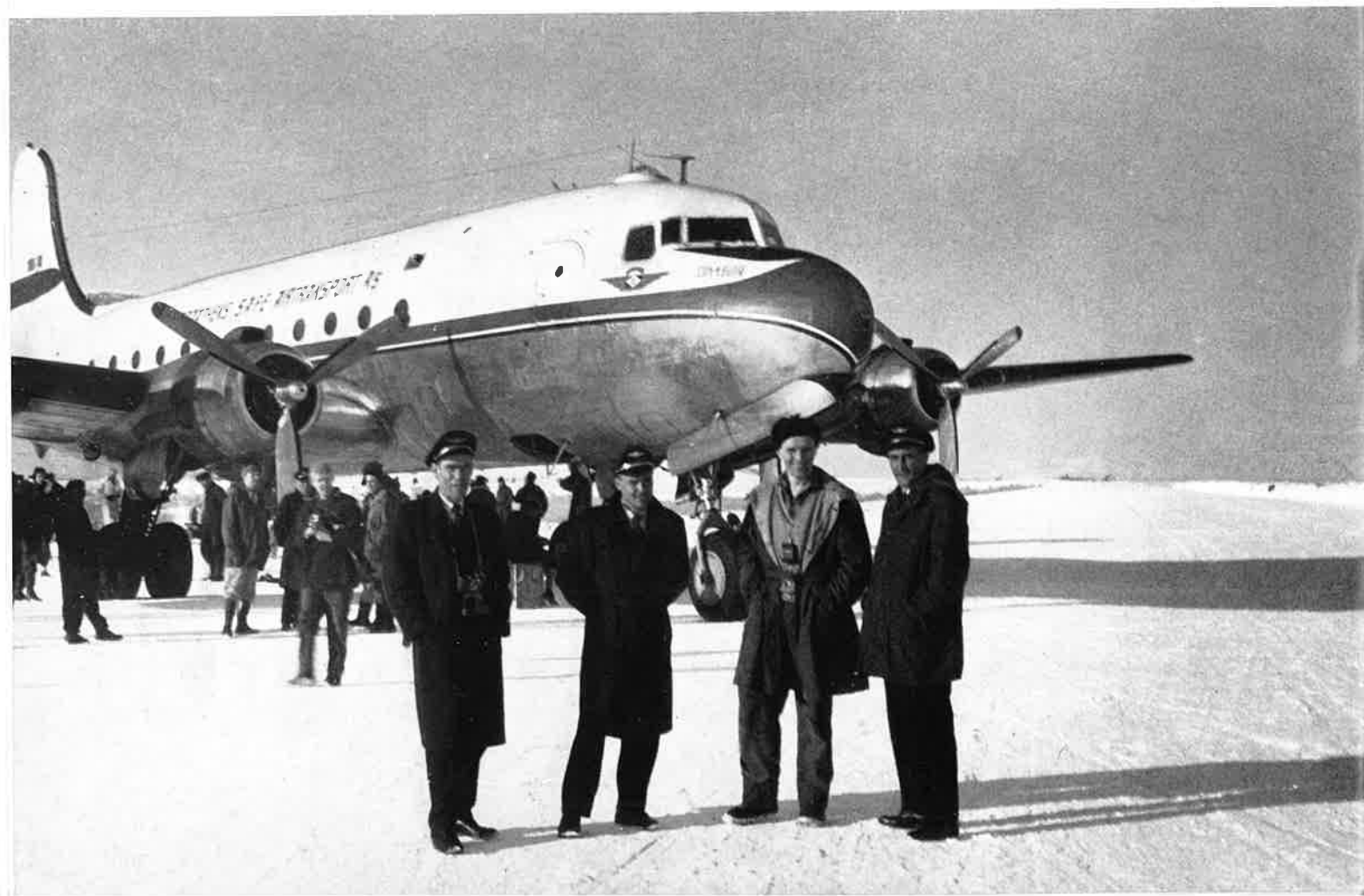
Passasjerfly ankommer med grubearbeidere