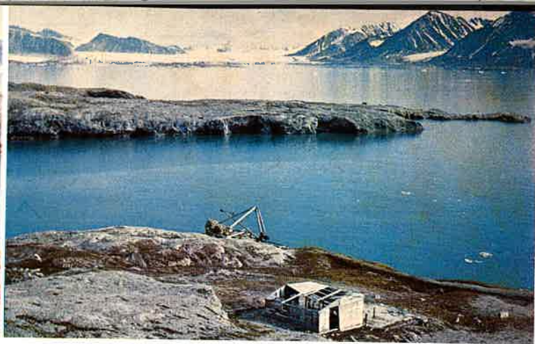
Blomstrandhalvøya ved Kongsfjorden