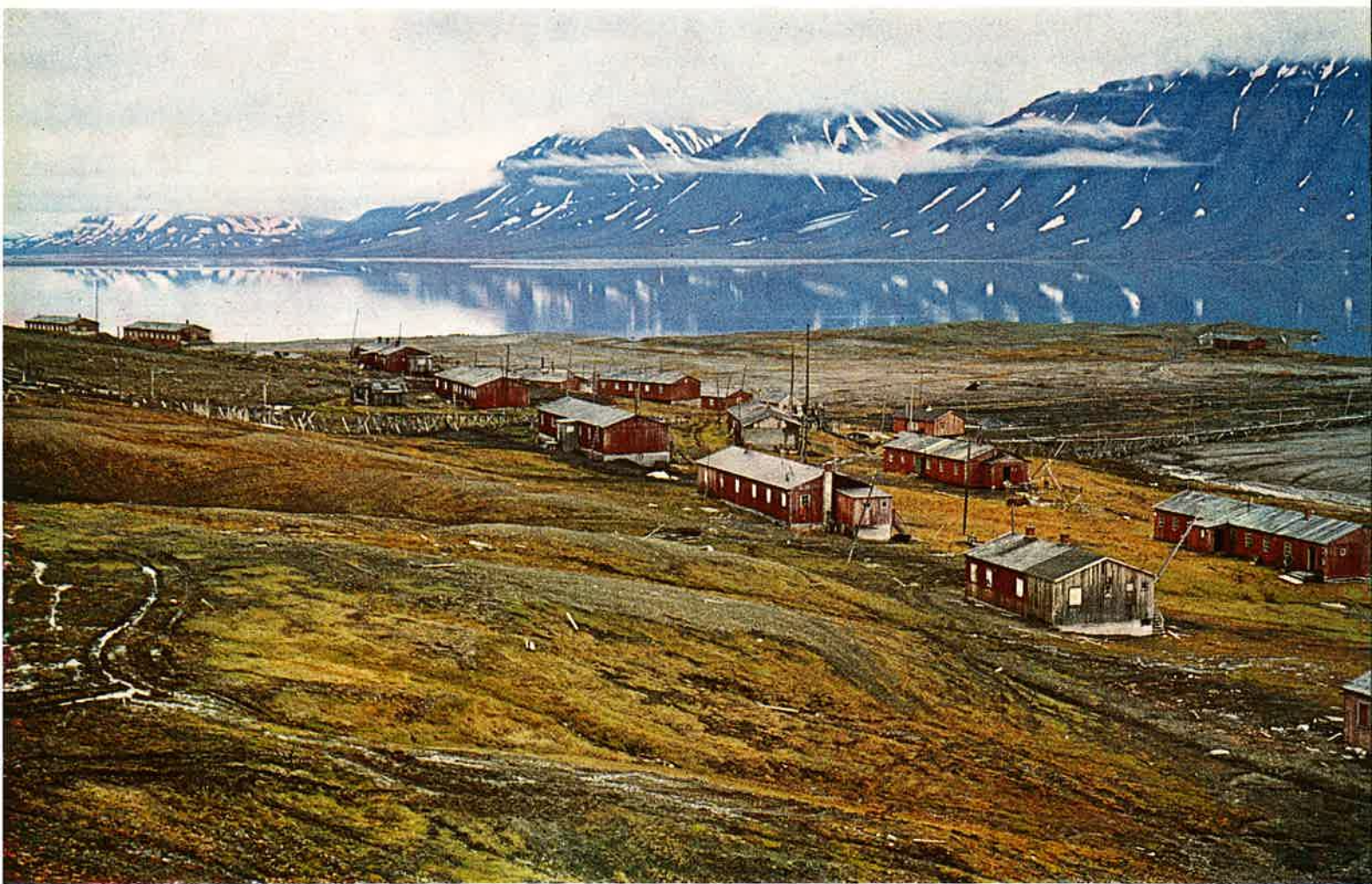
PANORAMA OG GAMMEL BEBYGGELSE I SVEA