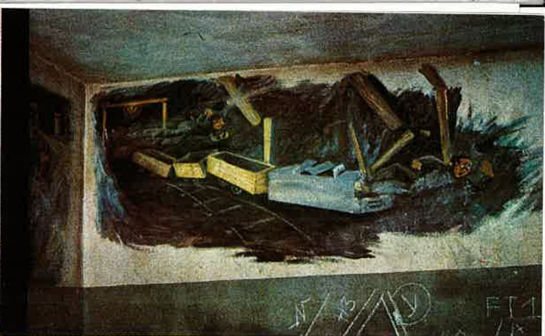
Veggmalerier på oppholdsrom grube 2, malt av en grubearbeider