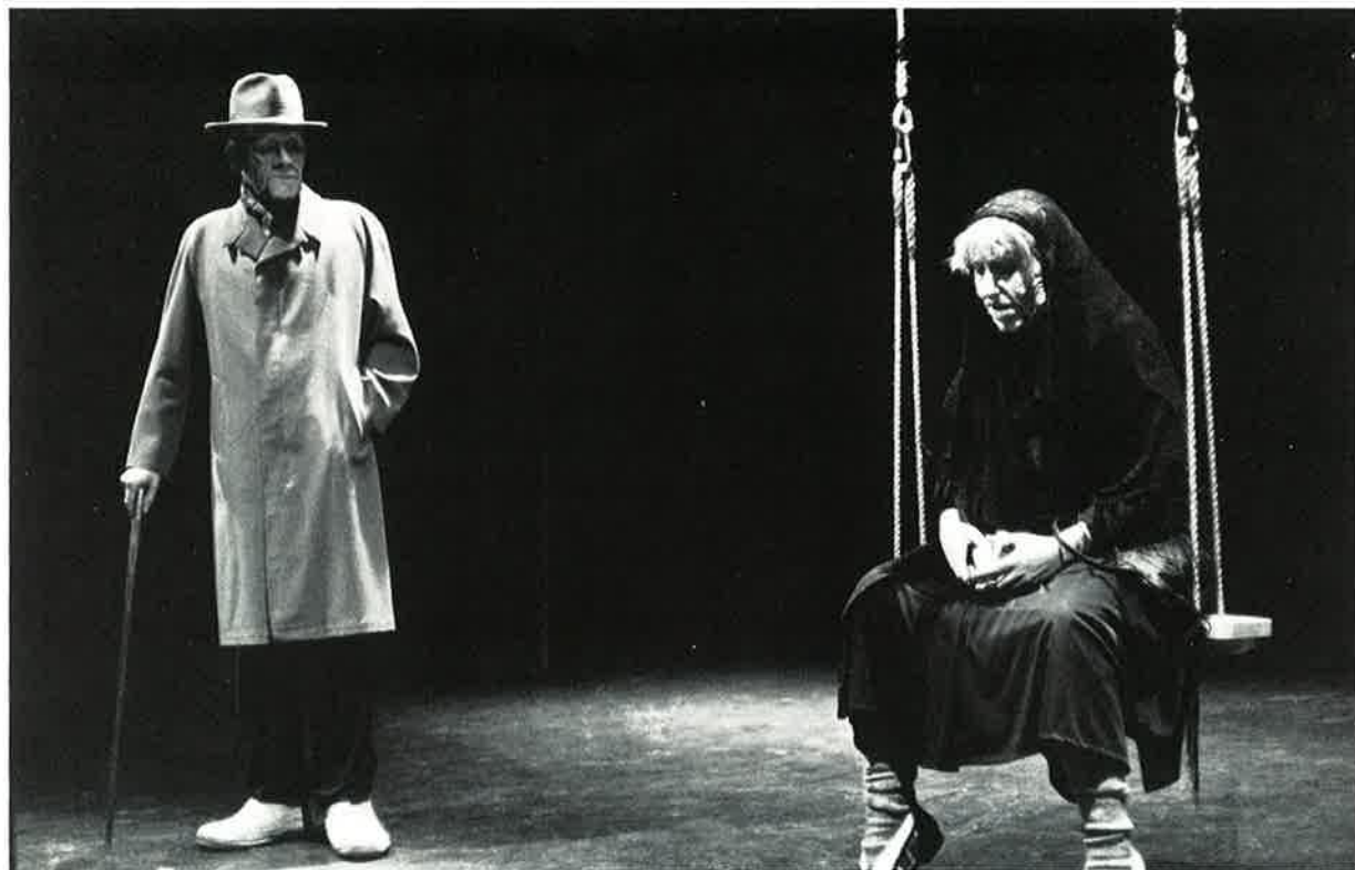
FRA DEN SOM LEVER FÅR SE