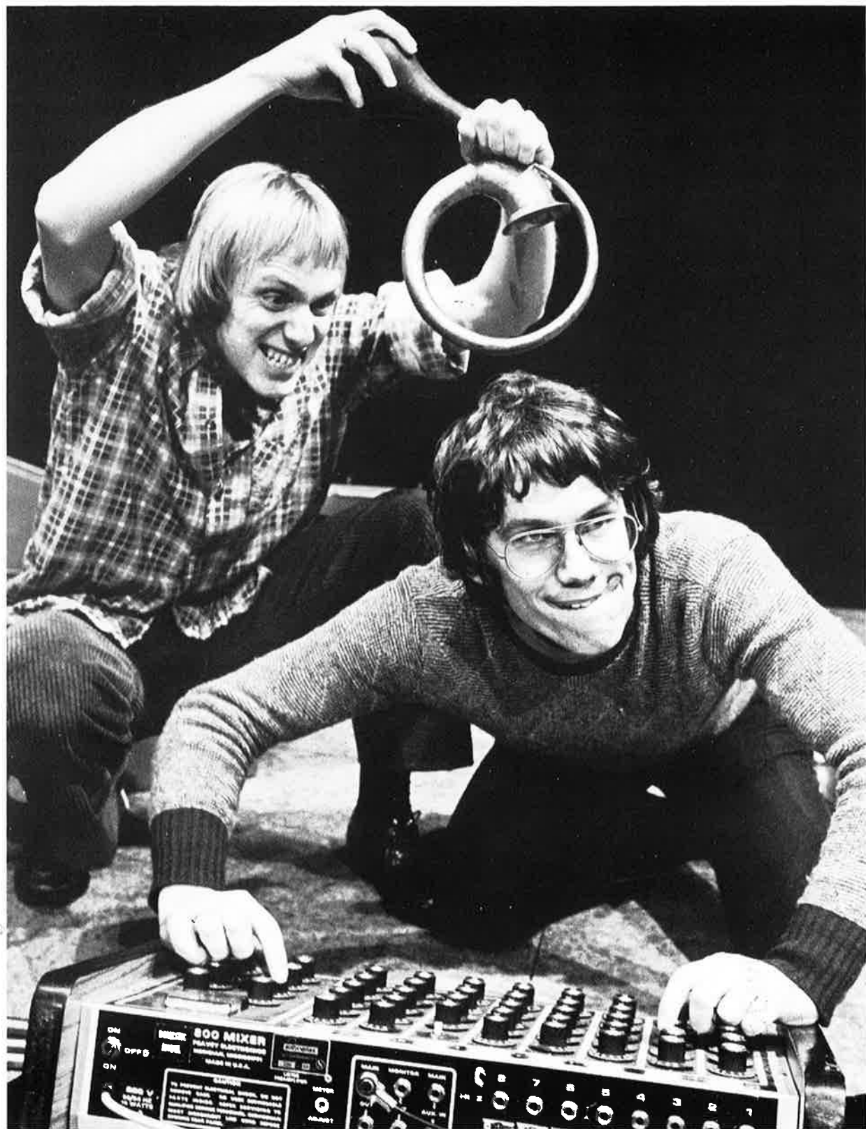
KNUTSEN OG LUDVIGSEN: FROSK I TAKLAMP