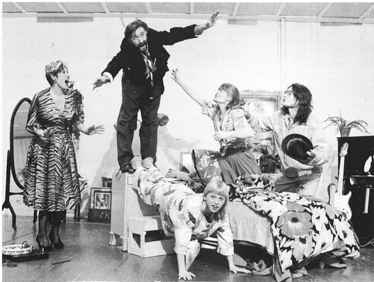
Fra HERBERGET SANNHETEN.