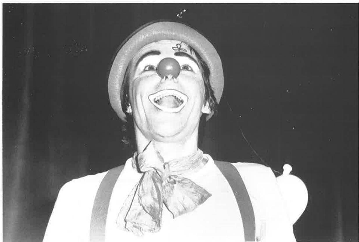
Fra MUSIKANTER UTEN VANTER.