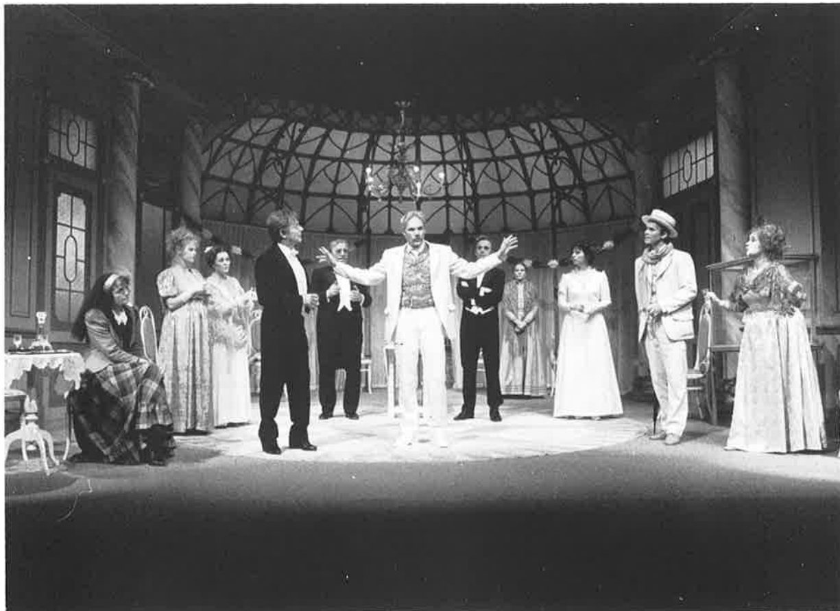
Fra jubileumsforestillingen SAMFUNNETS STØTTER.

Igjen vil styret påpeke behovet for at de spesielle forutsetningene som gjelder for Trøndelag Teater både på inntekts- og kostnadssiden i større grad blir tatt hensyn til ved fremtidige budsjettforhandlinger.