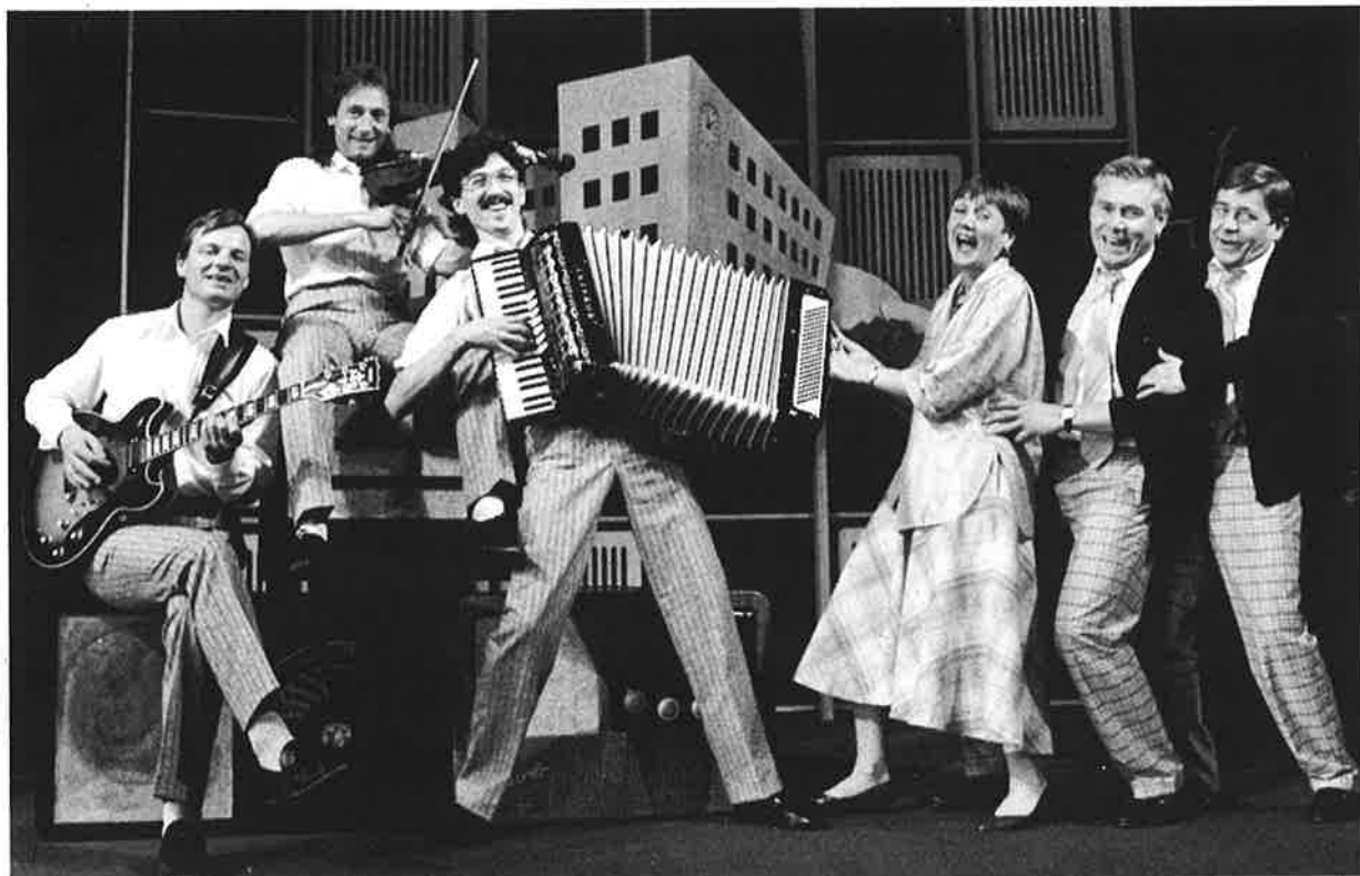
De medvirkende i SØNDAGSNIELSEN.

Året 1987 var først og fremst preget av forberedelsene til og gjennomføringen av teatrets 50-årsjubileum. I tillegg til store kunstneriske seire og stor aktivitet på alle tre scener hadde også teatret det beste publikumsbesøk siden 1983.