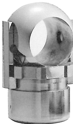
Ventilen som løsnet og "forårsaket" Bravoutblåsningen i 1977.