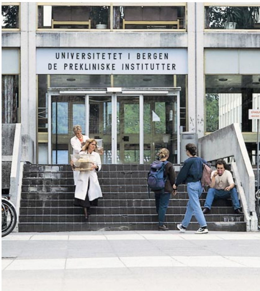
Studenter ved Medisin: Høsten 1998 ble det opprettet 15 nye studieplasser i helsefag hovedfag, på retningene logopedi og helsefremmende arbeid/helsepsykologi.