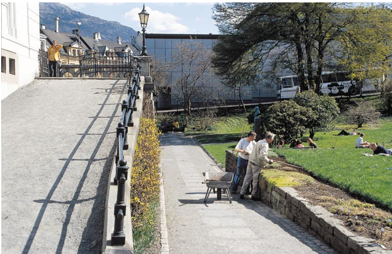
Det var en bredere og mer allsidig etterspørsel etter Bergen museum sine tjenester i 1998, i første rekke innen kunnskapsutvikling og -presentasjon. (Ill.foto fra Musehagen)

I Vingen-feltet er det utført nødkonservasjon og forebyggende tiltak, tildekking, drenering, kontroll og utlegging av prøvefelt, flyfotografering, merking, rydding av ras og forebyggende tiltak. Prosjektet blir i hovedsak finansiert av Riksantikvaren. Det er ellers gjort en del konserveringsarbeid på gravfunn fra Etne og Tysnes, og fra utgravningene på Vågsalmenningen.