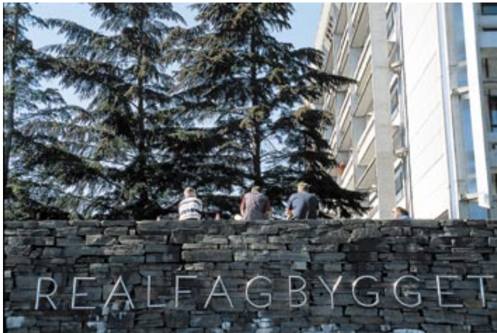
Studenter ved Mat.Nat.: Fakultetet gjennomførte høsten 1998 et forkurs i matematikk, for å demme opp mot den foruroligende reduksjonen i studentenes påmelding til matematiske emner. Kurset ble svært populært hos de nye studentene.

Eksternt finansiert virksomhet Omfanget av den eksternt finansierte virksomheten ved fakultetet er betydelig. Samlet utgjorde denne virksomheten i Bergensmodellen, Unifob og prosjekter regnskapsført av oppdragsgiverne, 51 % av fakultetets samlede virksomhet når regnskapstall legges til grunn, og innbefattet 250 årsverk.