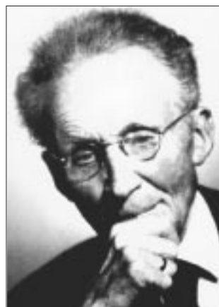
(Bildet: Vilhelm Bjerknnes)