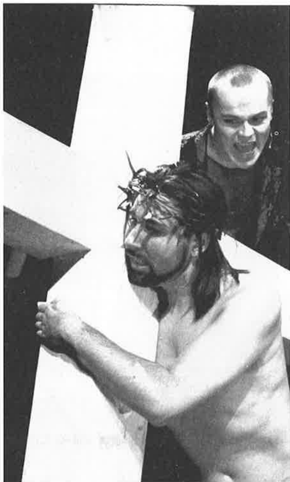
Jesus Christ Superstar