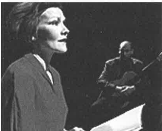
Berre kjærleik og død.