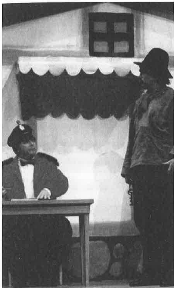
Folk og røvere i Kardemome by