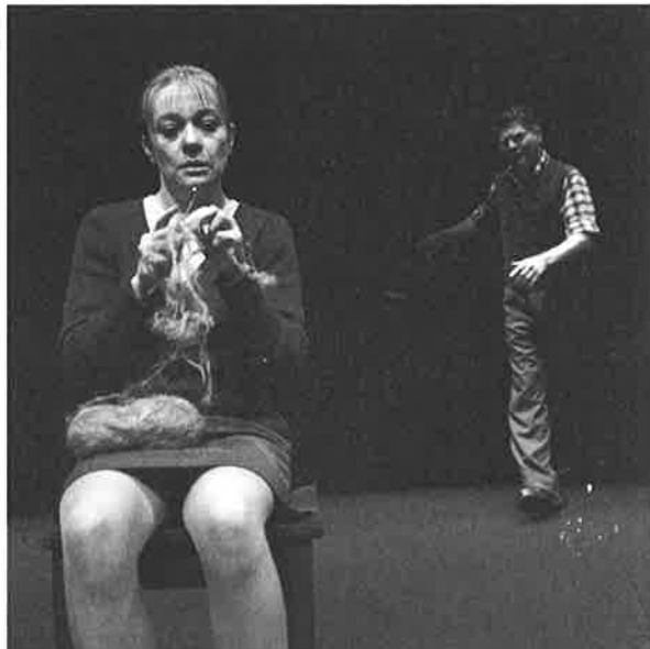
Snart kommer tiden