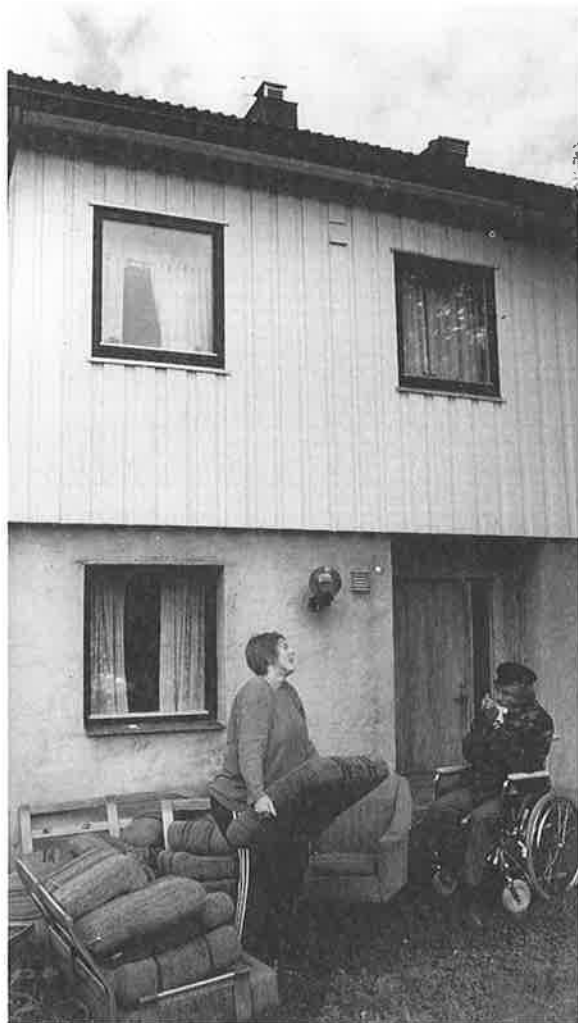
Bønder i solnedgang