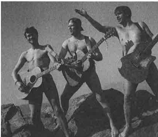
Æ vil ha dæ naken