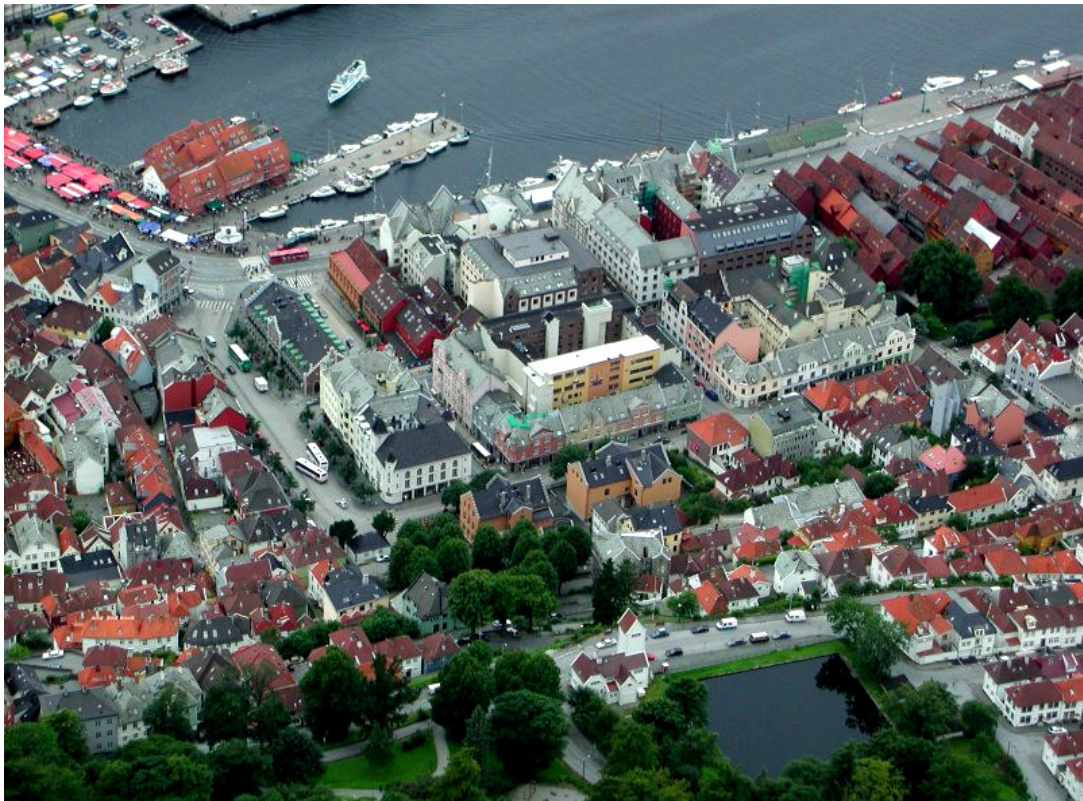
Bryggen i Bergen