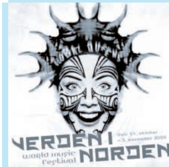
Programforside Verden i Norden

Verden i Norden er Rikskonsertenes egen festival, og ble høsten 2000 arrangert for sjuende gang, også denne gang i samarbeid med NORAD.