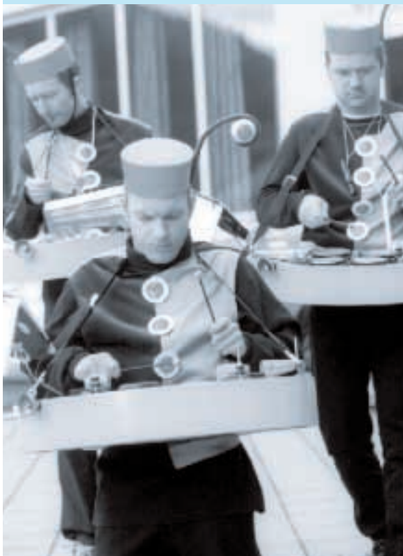
Sjokoguttene i SISU