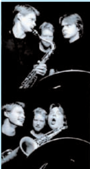
Jazzgruppa Tri O' Trang

I løpet av 2000 ble prosjektet Konsert og Skole etablert med egen prosjektorganisasjon, 6 kommuner i Hordaland og Rogaland ble invitert til å medvirke etter søknad, program ble bestemt og lokal idédugnad igangsatt. Alle deltakere i prosjektet hadde felles møte i september. Prosjektet dreier seg om kreative prosesser med utgangspunkt i en skolekonserproduksjon. Se for øvrig link på Rikskonsertenes hjemmesider.