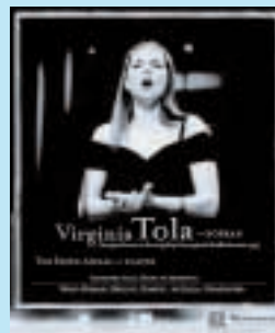
Plakater div. riksturneer