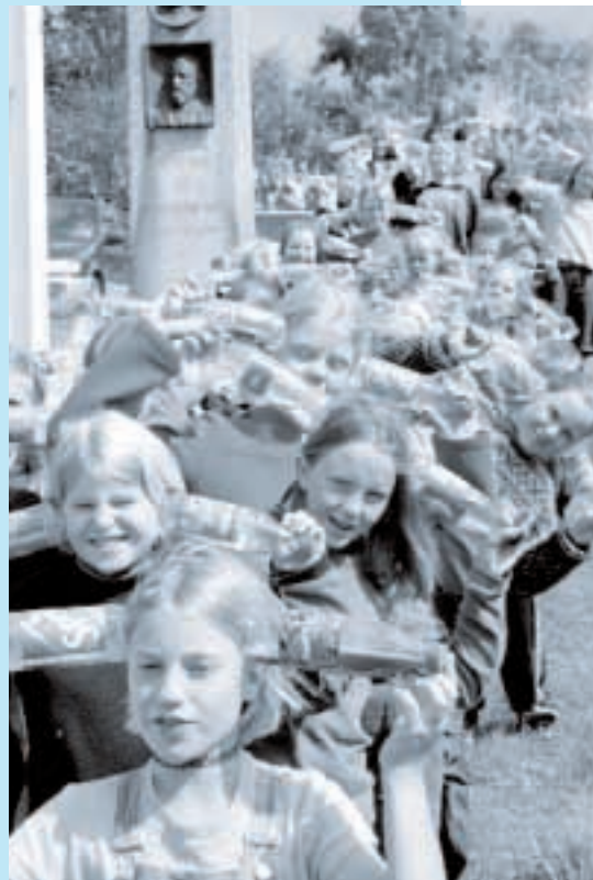
Barn i Sogndal løver til Lydlandskap