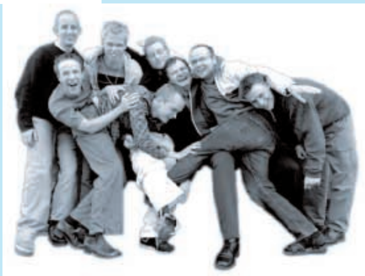
RA - Årets unge jazzmusikere 2000