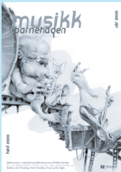
Plakat Musikk i barnehagen

2 verk framført til sammen 60 ganger. I tillegg er det i 2000 bestilt ytterligere 1 verk som vil bli urframført i 2001.