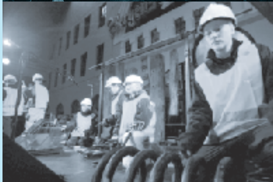
Øverst: Rap-gruppa Pen Jakke i LYDyngel'n I midten: Åpningskonsert på jernbanestasjonen Nederst: Barn i aksjon under åpningen

Ca. 29 000 barn ble forflyttet til et av de 19 konsertlokalene i Bergen sentrum i løpet av de fire dagene skolekonsertfestivalen varte. LYD-yngel rommet også en nordisk dimensjon, ved at musikere og musikkformidlere fra alle de nordiske land deltok. Til sammen presenterte et hundretall musikere i overkant av 170 skolekonserter i løpet av fire dager. Festivalen inkluderte noen offentlige konserter: en åpningsforestilling på jernbanestasjonen, presentasjon av ulike komposisjonsbaserte workshops der unge musikere deltok, en familieforestilling for de yngste, en nattkonsert med The Brazz Brothers og unge strykere, en presentasjon av KoS-prosjektet med programmet Songjen i fossaduren og – ikke minst – en stort anlagt verdensmusikk- og danseforestilling fra fem scener på Verftet. LYDyngel førte med seg mange prosesser, bl.a. et utstrakt samarbeid med en rekke institusjoner og organisasjoner både nordisk, nasjonalt og lokalt. Over 600 barn og unge deltok i forberedelse og avvikling av festivalen både i skapende og administrativ form. Utøvere, mottakere, fagpersonell og presse har uttalt seg i rosende ordelag om LYDyngel – og Rikskonsertene har høstet mye nyttig lærdom som vil komme skolekonsertordningen til gode i framtiden.