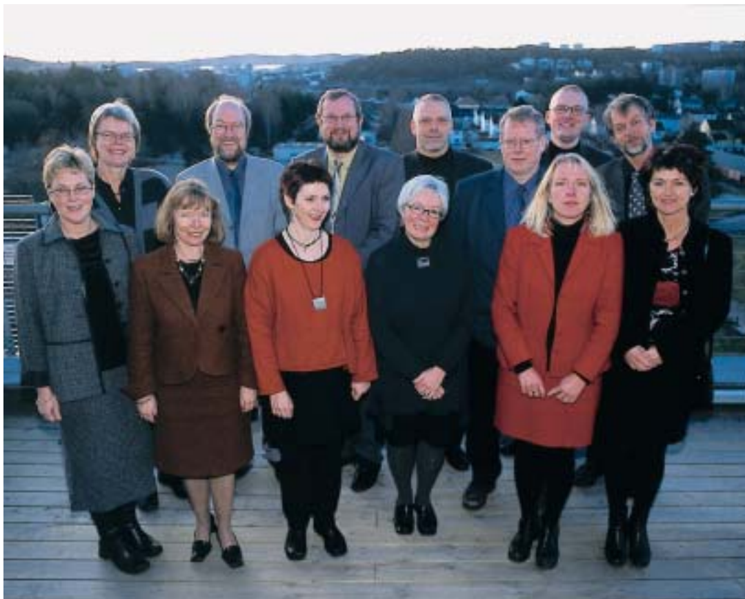
Styret for Høgskolen i Agder 2001.

Høgskolen har ei aktiv forvaltning av studieporteføljen og styret har i denne samanhengen behandla ei rekke studiesaker og omfordeling av studieplassar. Mellom anna vedtok styret å opprette ei desentral allmennlærerutdanning på Dømmesmoen i Grimstad for å kompensere for svikt i rekrutteringa til førskoleutdanninga. Også opptaket innan sivilingeniør- og siviløkonomutdanningane blei auka.