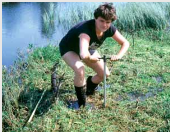
Boring etter sedimenter

som hadde bestilt utstillinga, og under opninga var ti fjernsyns- og radiostasjonar og 40 pressefolk til stades. Utstillinga vart sett av 20.000 menneske.