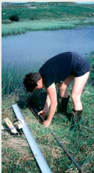
Klargjering av russerbor

I tillegg til "løpende" oppgåver har fotografane utført ein del eksterne engasjement; for Utsmykkingsfondet for offentlige bygg, Galleri Brandstrup, Rogaland Kunstmuseum m.fl. Avdelinga er også involvert i prosjektet "Fornminner på nett", eit samarbeidsprosjekt mellom Rogaland fylkeskommune og AmS.