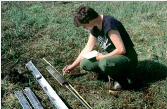
Kjerna vert beskriven

AmS har som hovudoppgåve å vera rådgjevar i kulturminnevernet, samstundes som vi utfører arkeologiske undersøkingar i Rogaland. I museet si sakshandsaming etter kulturminnelova (kml) er det lagt vekt på å gje fagleg gode tilrådingar til Riksantikvaren (RA) samstundes som museet har arbeidd for å utvikla samarbeidet med andre instansar.