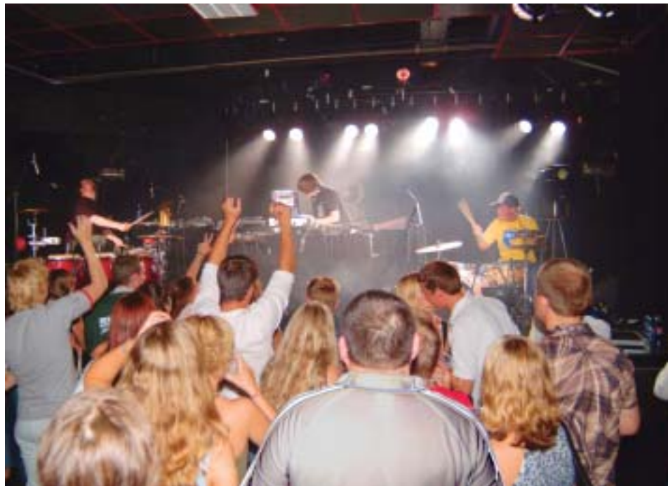
Konsert på Samfunnet

Den store aktiviteten ved oppstart av studieåret er fadderordningen. Alle tre studentforeninger har utvalg som arbeider med og forbereder velkomsten for de nye studentene. Aktiviteten er svært vellykket og er med på å gjøre studietiden i Bodø til en positiv opplevelse. Av aktiviteter som kan nevnes er rebusløp, «kultursjokk», fotballturnering, konserter, fester samt diverse turer og friluftsansangement.