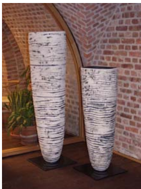
Utsmykking av Barbro Hernes, ferdig i 2003

Første del av utsmykkingen til museet betalt av Utsmykkingsfondet for statlige bygg ble ferdigstilt i november. Utsmykkingen som består av to store krukker utført av keramikeren Barbro Hernes er satt opp i administrasjonens lokaler (se årsrapportens forside). Ove Stokstads utsmykking til inngangspartiet er blitt noe forsinket.