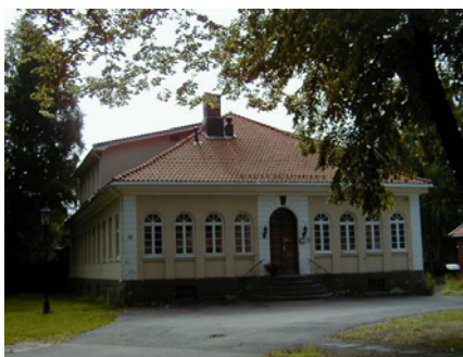
"Det hvite hus", Karljohansvern

Som et ledd i styrets arbeid for å finne løsninger for lager og verksteder har man forhandlet med Forsvarsbygg Skifte Eiendom om å leie "det hvite hus". Huset, som er 800 m 2 over 3 etasjer, vil også gjøre det mulig i større grad å tilby skoleklasser og annet publikum praktiske demonstrasjoner og foredrag. Etter søknad til Norsk Kulturråd ble det bevilget kr. 400.000 til konserveringsverksteder over en 3 års periode.