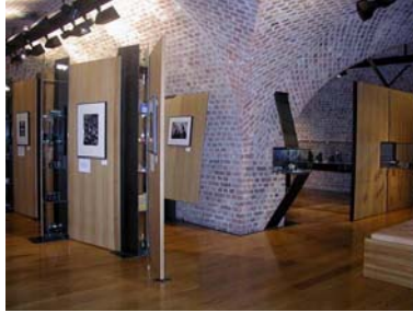
Fra teknisk utstilling

Museet har en årlig driftsavtale med Forsvarsbygg. Denne avtalen omfatter vaktmestertjeneste. Montering av enkelte utstillinger har vært satt ut. Det har som tidligere vært innleid hjelp fra IT-firma ved spesielt vanskelig dataproblematikk. Regnskap ble tidligere ført av et regnskapsfirma eksternt, men ble fra 01.01.03 ført av museets administrasjon med innleid hjelp 2 dager pr. mnd. Innleid hjelp totalt utgjør til sammen 1,2 årsverk.