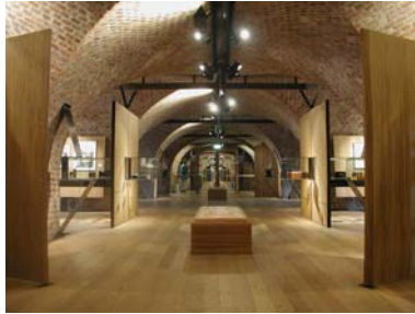
Teknisk avdeling

Museet har verneombud. Brannvern ansvarlig har holdt kurs og gjennomgang for alle nye ansatte, også for helgevakter.