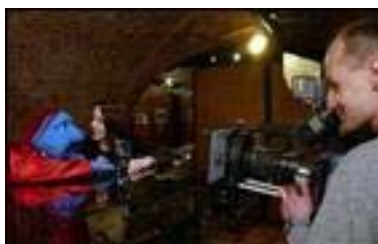
Fra NFKs program Kykelikokos sin episode fra museet

Det ble publisert en stor artikkel i Black & White Magazine for Collectors of Fine Photography, Issue 27 i oktober: Øivind Storm Bjerke: "Photographic Treasure in Norway", side 46-65. Det har ellers vært 70 omtaler av museets utstillinger og andre aktiviteter i pressen i 2003. TV Vestfold dekket museet 3 ganger og museet var gjennomgangstema i NRKs barneprogram Kykelikokos i februar. Det var 29 omtaler av utstillingen "Women Photographers – European Experience" (Göteborg) i svenske aviser, hvorav 11 illustrert med bilder av de norske fotografene Bolette Berg og Marie Høeg.