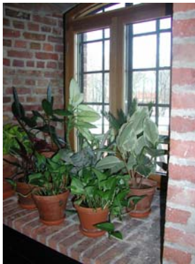
Planter har gjort kontorene mer triveligere og sunnere

Som nevnt i administrasjonens beretning for 2002 er det ikke lett å omdanne en gammel bygning til nye hensiktsmessige museumslokaler. Noen svakheter ved løsninger har blitt tydeligere i året som gikk og ble i større grad synlige og pekt på av museets nyansatte fotokonservator. Klimaanlegget har fungert tilnærmet tilfredsstillende, til tross for at den relative luftfuktigheten fremdeles ligger noe for lavt. Fotokonservator har tatt over målingene av forholdene. Han gir også retningslinjer for antall Lux som de forskjellige fotografiene kan tåle. Dette har tydeliggjort det problematiske ved at løsningene til lys i utstillingsrommene ble kuttet ned til benet under byggingen. Flere lysskinner og lyskastere som kan reguleres er investeringer som må gjøres i fremtiden. I 2003 ble forholdene forbedret ved at man investerte i ”plissoler” (plisserte rullegardiner) som i tilfredsstillende grad kan beskytte de utstilte gjenstandene mot direkte sollys.