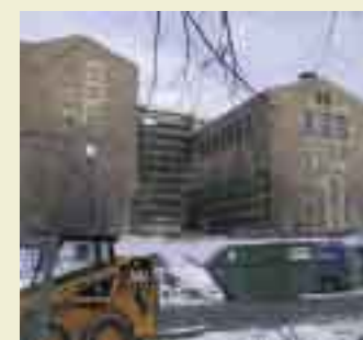
Nasjonalbibliotekets bygg fra baksiden. Her vil den nye glassgården bli bygget.