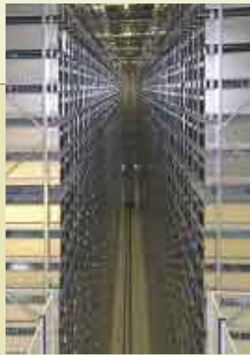
Fakta om Automatlageret

Siden automatlageret gir raskere utlånshåndtering, gir det også Depotbiblioteket anledning til å utvikle andre samlingsbaserte tjenester. En tjeneste er artikkelindeksing av redigerte norske bøker. Foreløpig indekseres nye pliktavleverte redigerte verk.