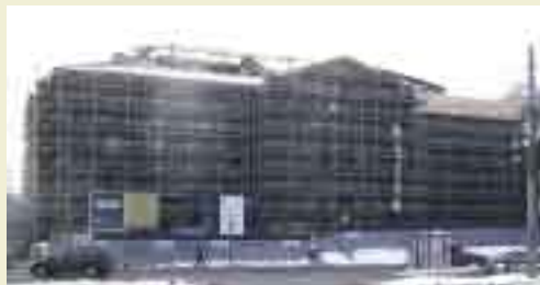
Nasjonalbibliotekets ærverdige bygg på Drammensveien i Oslo skal nå rehabiliteres.

Tiden går fort fram til sommeren 2005. Da inntar Nasjonalbiblioteket igjen bygningen på Drammensveien med nye og bedre egnede arealer, nye tjenester og tilbud til publikum. Det vil bli en merkedag i Nasjonalbibliotekets historie.