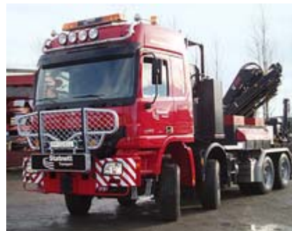
Statnett Transport fornyer jevnlig maskinparken for avanserte operasjoner i kraftnettet.