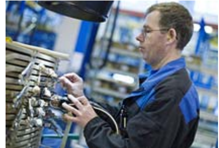
Statnett trenger seriøse og dyktige leverandører.

Statnett legger stor vekt på at forholdet til leverandørene skal være basert på en høy etisk standard.