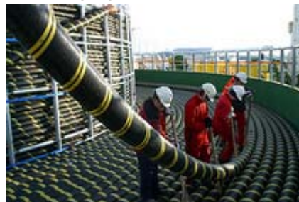
580 km kabel av denne typen skal legges mellom Norge og Nederland.