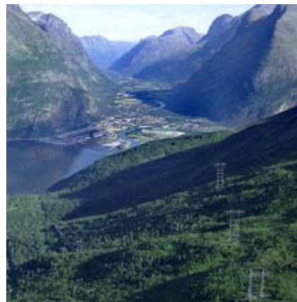
Sunnalsøra sett fra nye Viklandet transformatorstasjon.

Til tross for denne store enkelthendelsen, har leveringskvaliteten, sett over hele året, vært som normalt. Mye skogrydding har medført at året gikk uten strømbrydd som følge av kontakt mellom trær og ledninger. Videre har en nyorganisert ledningsavdeling i Statnett fått ansvaret for beredskap og vedlikehold av ledninger. Det er også laget ny plan for reinvesteringer i nettet de neste 10 årene.