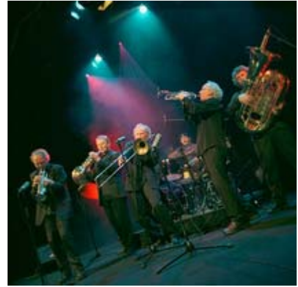
Statnett har i flere år samarbeidet tett med The Brazz Brothers.

Vårt ønske om å bidra til gode muligheter for barn og unge lå også til grunn for etableringen av samarbeidet med The Brazz Brothers i 2001. Målet med dette samarbeidet har vært å skape en kreativ samarbeidsform som inspirerer og begeistrer lokalbefolkning, studenter, myndigheter, kunder, ledelse og ansatte i Statnett. Samtidig har vi ønsket å støtte det inspirerende arbeidet The Brazz Brothers gjør for det frivillige musikkliv. Musikken er spontan og kreativ og er slik sett et uttrykk for Statnetts verdier.