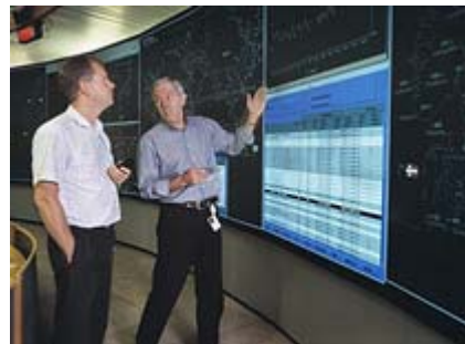
Kraftmarkedet normaliserte seg i 2004.

Nord Pool Gruppen bidro til Statnetts resultat med 25 millioner kroner etter skatt i 2004, inklusive resultatandelen av Nord Pool Spot. Nord Pool Gruppen hadde et samlet overskudd på 41 millioner kroner etter skatt og finansposter, mot 27 millioner i 2003.