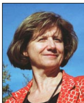
Gerd-Liv Valla Leder i LO Ekstern representant