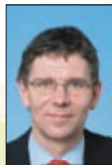
Tjenester og produkter Roar Tobro