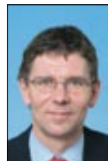
Tjenester og produkter Roar Tobro