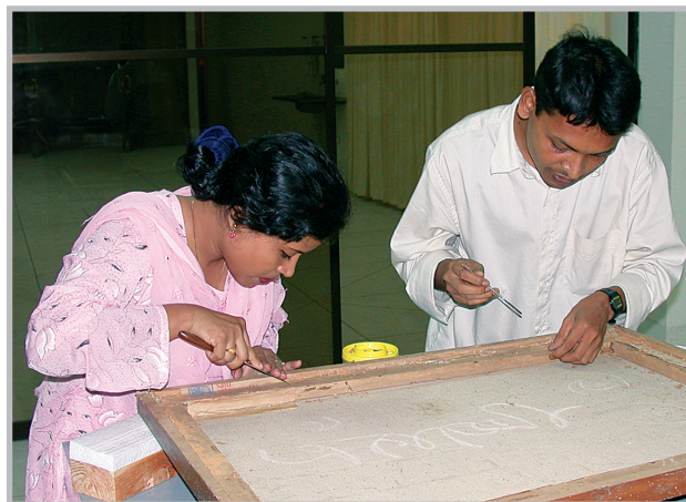
Studenter i arbeid med samlingen ved Bangladesh Shilpakala Academy under arbeidsseminaret i 2004.

Studentene, som kom fra ulike akademiske miljøer og med ulik bakgrunn, viste seg som en meget motivert og vel-