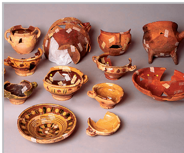
Det ble funnet mye 16- og 1700-talls nordeuropeisk keramikk i en avfallsbinge i en av eiendommene på Branntomta. Dette gir et unikt innblikk i husholdningen til en borgerfamilie i Trondheim på denne tiden. Bildet viser såkalt trønderkeramikk, som antagelig ble produsert lokalt.

Den historiske utviklingen av tomta var derfor kartlagt før NIKU satte i gang med undersøkelsen. Etter hvert som utgravningen skred frem, viste det seg at forholdene nok var noe annerledes enn beskrevet i kildene. På begge de undersøkte eiendommer ble det riktignok funnet tydelig spor som viste at området hadde vært kultivert gjennom mange hundre år, men det ble også funnet flere faser av bygningsrester som er eldre enn det de skriftlige kildene antyder. På begge utgravningsområdene ble det funnet rester av steinbrolagte gårdsplasser med omkringliggende trebygninger som er eldre enn bybrannen i 1681. Gjenstandsmaterialet, bl.a. en mengde med østersskall og en øreskje i bein, viser at de som bodde her hadde en relativt høy sosial status.