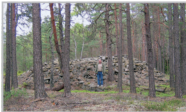
Ulike skjebner: gravhaug i skog og gravhaug i boligområde. På sistnevnte kan gravhaugens profil ennå ses mellom de to bildekkene og toilettet.

Tidligere var jordbruksaktiviteter den viktigste årsak til den største desimeringen av fornminnebestanden. I Sarpsborg var det også en del gravhauger i dyrket mark som nå var helt forsvunnet fordi de etter hvert var blitt pløyd bort. I dag er imidlertid boligutbyggingen den største trusselen for fornminnene i Sarpsborg kommune på grunn av