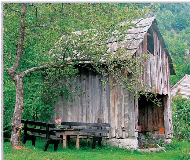
Selv ubehandlet trevirke av billig kvalitet får et funksjonelt og estetisk tilfredsstillende resultat når det brukes på den rette måten i de rette sammenhengene. ”Tilstrekkelighetsprinsippet” illustrert ved Agatunet, Ullensvang i Hardanger.

bruk og optimal ressursutnyttelse er vesentlige elementer i tilstrekkelighetsprinsippet.