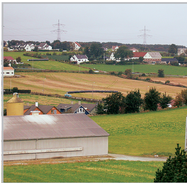
Der by møter land. Den gamle gårdsstrukturen på Madla ved Stavanger er blitt lite lesbar med mye og ny bebyggelse mellom gårdstunene.

En av konklusjonene som trekkes i prosjektet, gjelder den viktige rollen som kunnskapen om kulturminnene og kulturmiljøene spiller. Hvis denne kunnskapen verken er lett tilgjengelig eller god nok for saksbehandlere og planleggere i kommunen, vil det ofte føre til at politiske beslutninger fattes på et sviktende grunnlag. Det har dessuten vist seg at kulturminnehensynene har problemer med å vinne gjennomslag tidlig i planprosessen sammenlignet med for eksempel landbruket og transporthensyn. Dermed fungerer ikke kulturminnevernet som premissgiver, men snarere som en bisak. Det henger sammen med at kulturminner og kulturmiljø anses for tilstrekkelig godt ivarettat når det er blitt tatt hensyn til naturvernet og friluftslivsinteressene, noe som ikke medfører riktighet. For å kompensere et sent innpass i planprosessen, kan det bli utviklet egne reguleringsplaner for mindre geografiske områder å ivareta hensynet til kulturminnene og kulturmiljøene lenger