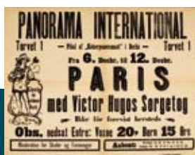
Teaterplakat ca 1890