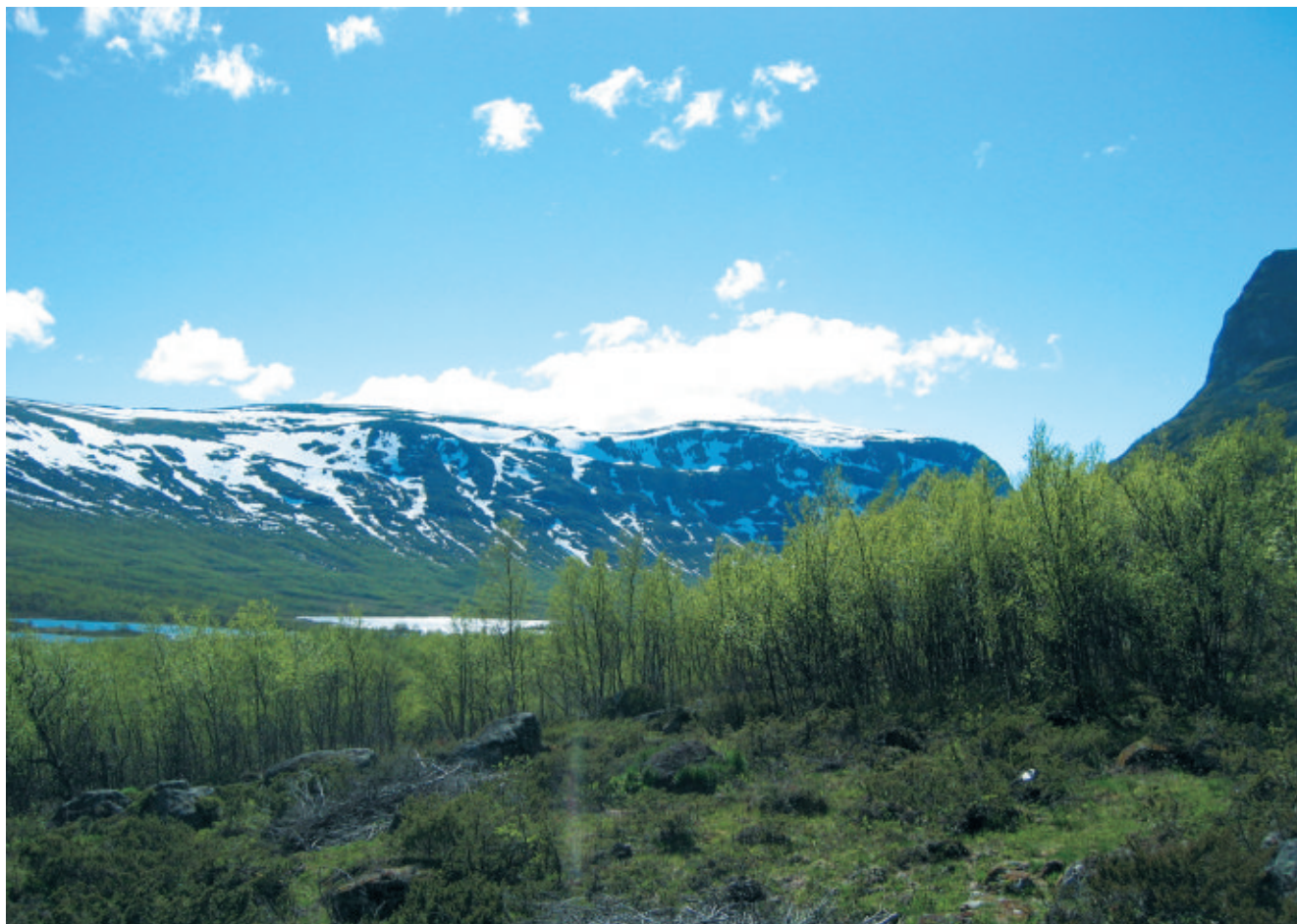
Dette er Sikkilsdalen – «en fjelldal av frihet»