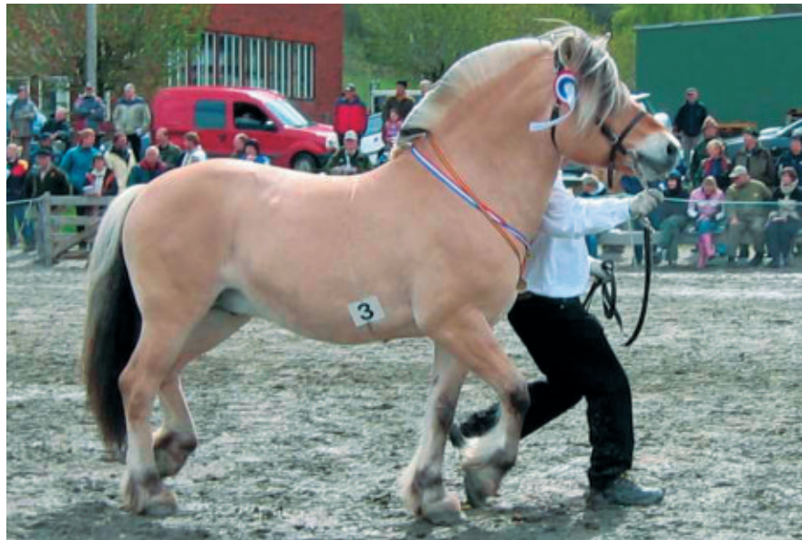
Mønstring av fjordhest.

Det er kun landsdekkende organisasjonene som kan søke. I 2005 ble alle av Mattilsynet godkjente avlsorganisasjoner, eller organisasjoner i dialog med Mattilsynet om slik godkjenning, gitt anledning til å søke om avlsfremmende midler fra Norsk Hestesenter. Dette innebærer at flere organisasjoner ble vurdert i tildelingen dette året. Avlsrådet fastsetter de kriterier som skal ligge til grunn for søknadsberettigelse hvert år. Selv om avl og bruk henger sammen, må avlsrådet