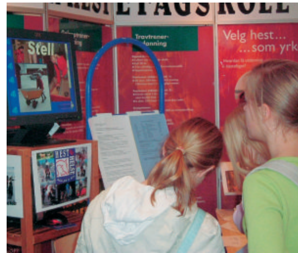
Ivrige besøkende på Norsk Hestesenters stand under Oslo Horse Show.

For Norsk Hestesenter er det viktig å være tilstede på Oslo Horse Show. Arrangementet i Spektrum trekker fullt hus og klarer snart ikke å ta imot flere tilskuere. Vår stand besøkes av utrolig mange mennesker denne helgen og kurskatalogen som er rykende fersk går unna som varmt hvetebrød. Fokus er da også på våre utdanningsmuligheter. Mer tekniske løsninger og bruk av bilder og lyd har utviklet vår stand ytterligere, noe som gjør den tiltrekkende for publikum.