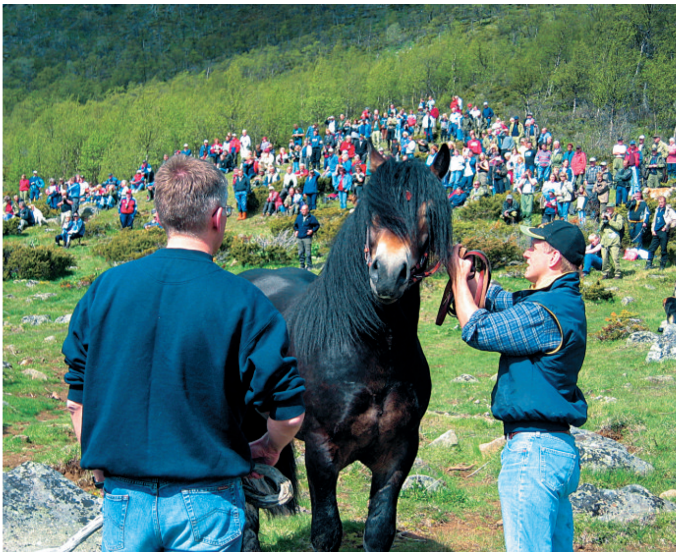
Det gjøres klar for slipp i Prinsehamna i Sikkilsdalen med mange hundre tilskuere i solhellingen.

I 2004 oppnevnte avlsrådet to utvalg som skulle se på videreutvikling av dommerutdanningen og evaluering av utvida bruksprøver for de norske raser. I tillegg oppnevnte styret et utvalg som skulle se på utstillingsstrukturen og videreutvikling av denne. Rapportene fra disse utvalgene ble presentert på fellesmøtet mellom avlsrådet og avlsorganisasjonene. De ble sendt ut på høring i organisasjonene med frist 1.november 2005. Rapporten fra dommerutviklingsutvalget ble behandlet av avlsråd og styre i desember 2005, de to øvrige vil bli behandlet våren 2006.