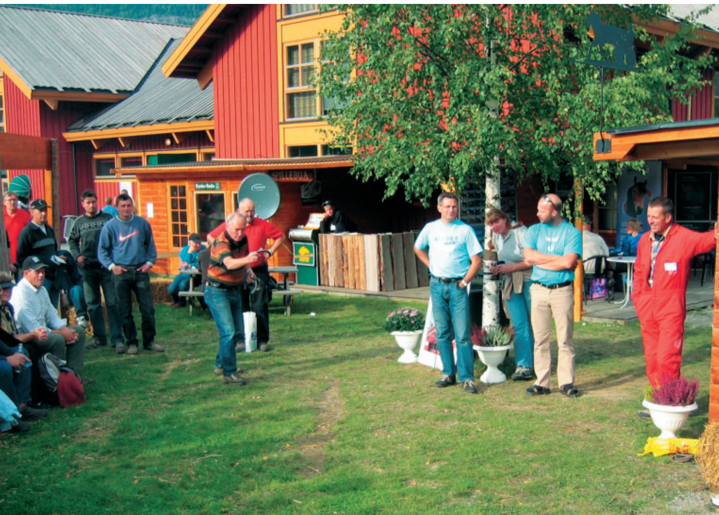
Hestekokasting på hestesportens stand på Dyrsku'n.

For første gang på mange år deltok Norsk Hestesenter på en utdanningsmesse.