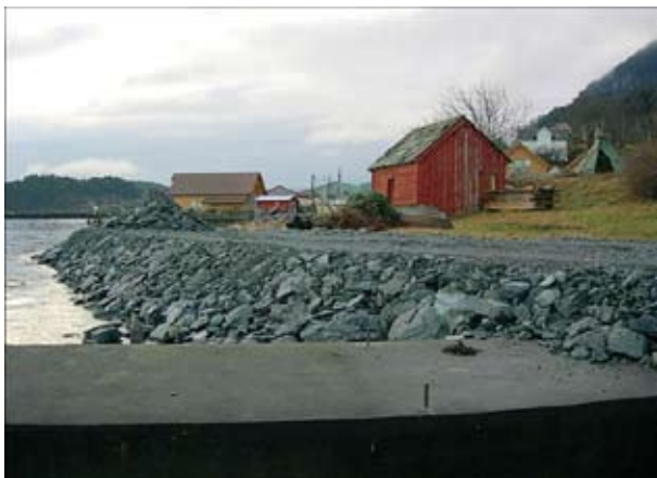
Foto: Onarheim på Tysnes. Fylkesmannen melde dette tiltaket til politiet, og utbyggjaren fekk bot på 700 000 kroner. Fylkesmannen samarbeider tett med kommunane når det gjeld ulovlege byggjetiltak, særleg i den nasjonalt prioriterte strandsona.

Det er framleis stor auke i saker etter plan- og bygningslova. Fylkesmannen behandla totalt 2 085 saker i 2006, mot 1 809 i 2005. Det er særleg talet på dispensasjonssaker som stig; 1 417 saker i 2006 mot 1 187 i 2005. Mange av desse sakene er i strid med nasjonal arealpolitikk, og Fylkesmannen klaga difor på 118 kommunale dispensasjonsvedtak. 85 av dei var i strandsona.