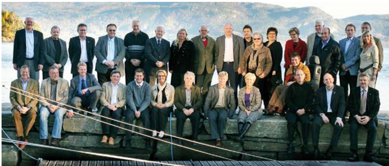
Fylkesmannen og ordførarane i Hordaland samla i Os 1. november 2006.

Fylkesmannen er det overordna samordningsorganet mellom kommunane og regional stat. Det er etablert eit regionalt statsetatsleiarforum, og forumet arrangerte samling for ordførarar og rådmenn i november. Ekstremver og krisehandtering var hovudtema på møtet.