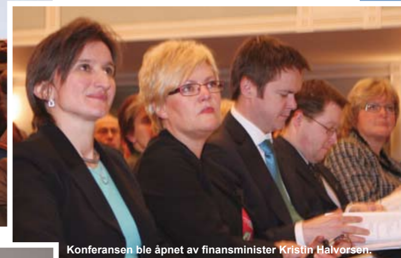
Konferansen ble åpnet av finansminister Kristin Halvorsen.