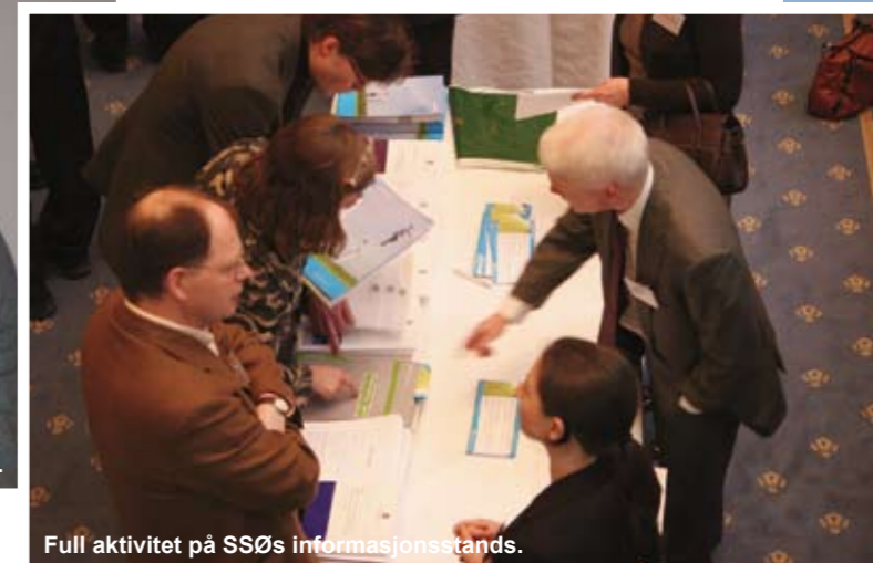
Full aktivitet på SSØs informasjonsstands.