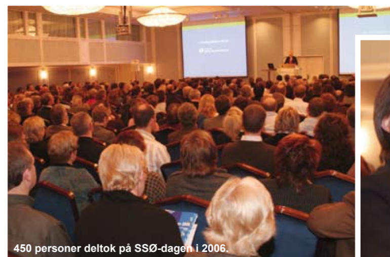
450 personer deltok på SSØ-dagen i 2006.

effektiv ressursbruk. Det ble i 2006 besluttet å utvide den faglige bredden i arrangementet. Vår andre SSØ-dag i januar 2007 inneholdt derfor hele 6 valgfrie temaer i tillegg til hovedtemaet. Det vises stor interesse for konferansen både blant deltagere og foredragsholdere.