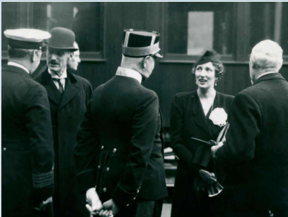
Kong Haakon og kronprinsesse Märtha kjem til Fjøsanger stasjon.

7. september 1936 blei Norges Handelshøyskole høgtidleg opna av H.M. Kong Haakon VII. Kongen var i selskap med handelsministeren, ordføraren i Bergen, fleire stortingsmenn, rektoren ved Universitetet i Oslo og statsråd Kristofer Lehmkuhl. Lehmkuhl var formann i arbeidsutvalet som tok initiativ til å etablere Foreningen til Opprettelse av Norges Handelshøyskole i Bergen. Ei lang rekkje støttespelarar var mobiliserte allereie før foreininga blei stifta. Det blei samla inn pengar, med bidrag frå mellom andre kongeparet. I 1933 kjøpte foreininga ein villaeigedom på Muséplass, der Norges Handelshøyskole kunne opnast i september 1936.