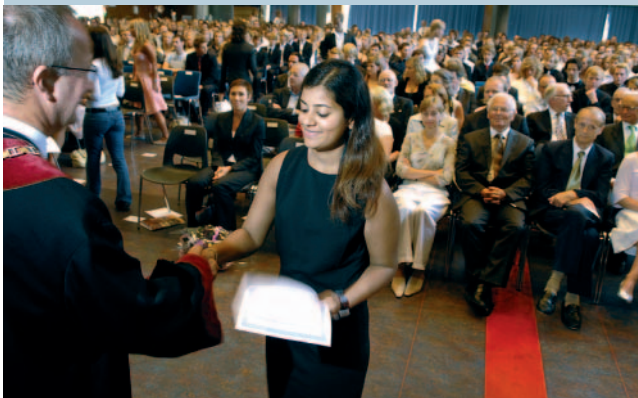
Det tradisjonsrike handtrykket frå rektor under immatrikuleringa i august.