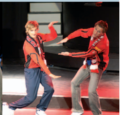
Stilige Brann-supporterarar i eit av innslaga i årets UKEN-revy.