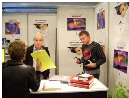
NLB deltar på stands for å spre informasjonen om våre tjenester

Nettsidene våre er godt besøkt og våre brukere er godt fornøyd med innholdet. Vi har i høst fått MediaLT til å gjennomføre en analyse av sidene våre for å undersøke om de er brukervennlige for synshemmede brukere. Resultatene fra denne undersøkelsen viser gjennomgående gode karakterer for nettsidene. Rapporten vil danne grunnlag for en videre utvikling og forbedring av denne tjenesten..