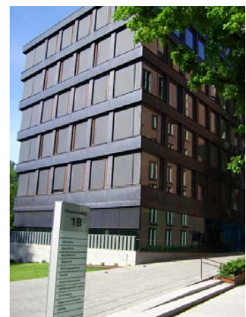
NLB har sitt hovedsete i Halvbroren ved Solli plass i Oslo

Tilrettelegging for syns- og lesehemmede består i å få vanlig skrift over til lydformat, elektronisk tekst og blindeskrift. Dette foregår i vår egen produksjonsavdeling som i 2006 produserte 1081 titler fordelt på lydbøker, E-tekstbøker og blindeskriftbøker. NLB har 12 studioer til innlesing av lydbøker. Vi produserer blindeskrift ved å skanne vanlige bøker, bearbeide og strukturere teksten før den trykkes på en stor blindeskriftsprinter. I løpet av de to siste årene har bruken av talesyntese blitt stadig mer brukt til å lage lydbøker basert på strukturert tekstfil.