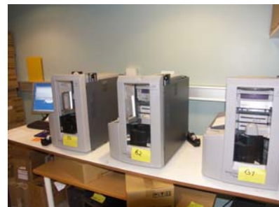
NLB brenner over 1000 cd-plater hver dag som lydbøker. Vi får en bok på en plate som Daisy-bok

I 2006 har tallet på studenter med produksjonsrett holdt seg nokså stabilt hvis vi sammenligner med 2005, det samme gjelder studenter med andre lesevaner, for eksempel dysleksi. Tross dette økte utlånet av studie bøker med 1100 (ca 30 prosent) fra 2005 til 2006. I tillegg til våre egne produksjoner lånte vi inn i ca. 150 studie bøker fra Talboks- og punktskriftsbiblioteket (TPB)