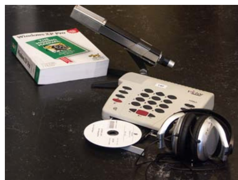
Tilrettelegging er å gjøre vanlig tekst om til lyd eller blindeskrift

Tilveksten av lydbøker innenfor folkebibliotekslitteraturen for 2006 er 576 mot hhv 438 i 2005 og 567 i 2004. NLB legger vekt på å ha et godt tilbud til barn og ungdom i blindeskrift. Disse bøkene er ca halvparten så omfangsrike som voksenlitteratur, og er dermed raskere å produsere. Noe av forklaringen på det høye produksjonstallet i 2004 er et stort volum barnebøker. Bøker øker i omfang og i 2006 var barne/ungdoms- og voksenbøkene ca 12% større enn 2005. Nedgangen i produksjon er altså noe mindre målt i sideantall enn den er målt i antall titler.