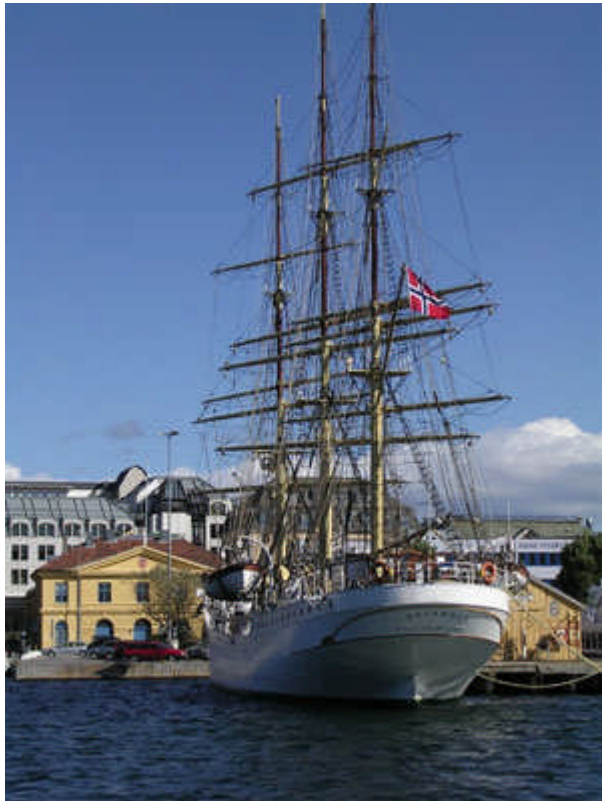
Porto Franco. Havneområdet i Kristiansand er stedet for nyskaping og kreativitet. Seilskuta "Sørlandet" ligger til kai.

Bakgrunnen for programmet er ønsket om at kulturminnene og kulturmiljøene i større grad blir tatt i bruk som ressurser i utviklingen av levende lokalsamfunn og som grunnlag for ny næringsvirksomhet. Nasjonalt og internasjonalt blir det rettet stadig større oppmerksomhet mot hvordan kulturminner og kulturmiljø kan bidra til sosial, kulturell og økonomisk utvikling. Dette samspillet representerer et stort potensial for fortsatt sysselsetting og bosetting i mange byer og bygder, både langs kysten og i innlandet.