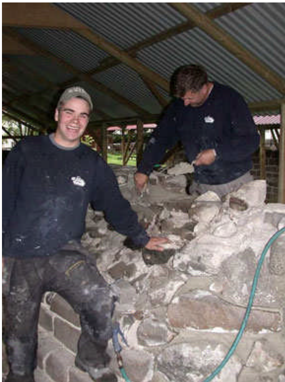
St. Nikolas ruinene konserveres.

Hva som anses å være riktig og hensiktsmessig å gjøre med kulturminner, endrer seg over tid. På 1900-tallet ble de fleste middelalderruinene våre restaurert etter metoder vi nå har gått bort fra. For å sikre at den best mulige konserveringsteknikken blir brukt, har det vært viktig for ruinprosjektet å være i tett dialog med fagfolkene som utfører arbeidet, nemlig murerne. Sammen med eiere og kommuner er de våre viktigste samarbeidspartnere. Mureren har en grunnkompetanse som er helt nødvendig for å oppnå et godt resultat. Likevel er det store forskjeller mellom ruinkonservering og bygging og vedlikehold av moderne murverk når det gjelder materialbruk og teknikker. Ruinprosjektet har derfor i 2006 lagt grunnlag for og forberedt en ukes arbeidsseminar på Selja kloster- og helgeanlegg i Sogn og Fjordane. Det er laget en detaljert arbeidsplan i samarbeid med kommunen og en murer med spisskompetanse på middelaldermurverk. Ruinprosjektet regner med at ca 30 murere vil delta på arbeidsseminaret, og slik lære gjennom praktisk arbeid.