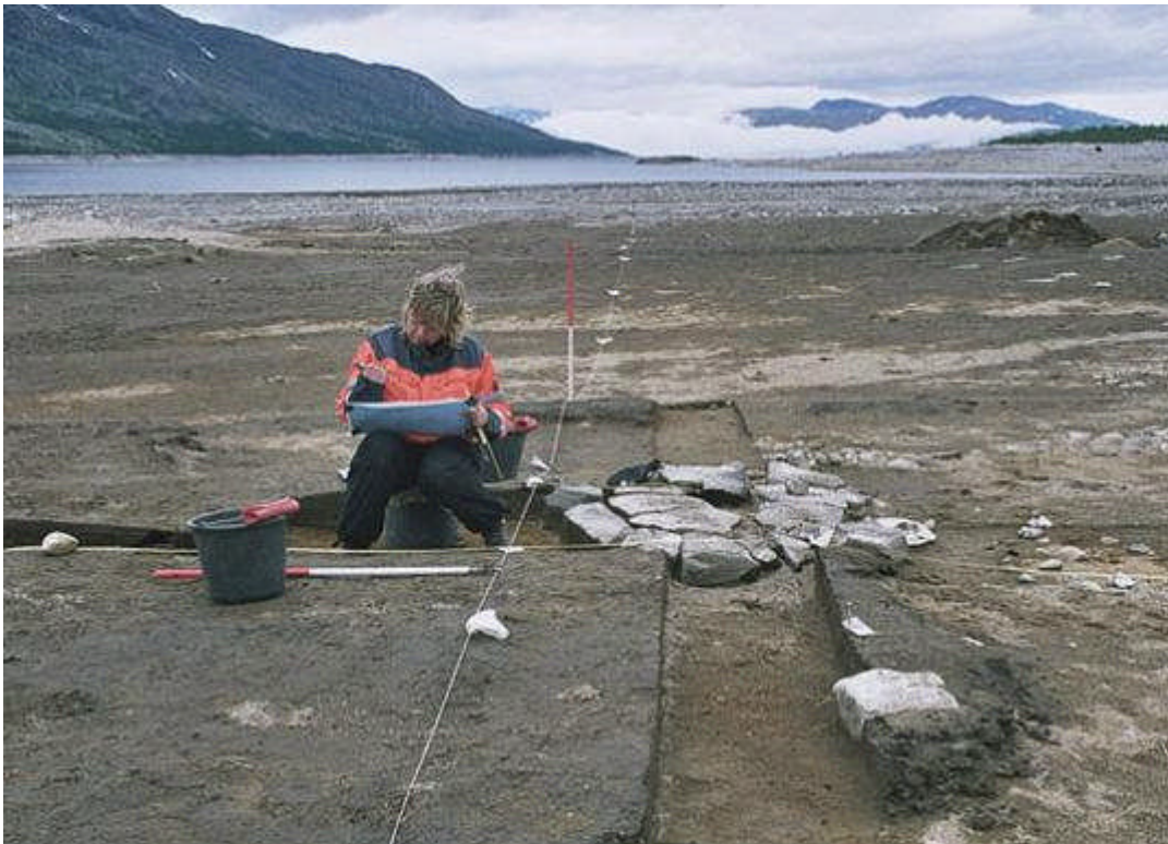
Et av fire samiske ildstedene graves ut ved Aursjøen.

Rundt 140 vassdragskonsesjoner skal fornyes eller kan revideres i årene som kommer. Riksantikvaren og Norges vassdrags- og energidirektorat (NVE) har sammen med representanter for energisektoren og regional kulturminneforvaltning sett på hvordan man best kan ivareta kulturminneinteressene i forbindelse med fornyelse av vassdragskonsesjoner.