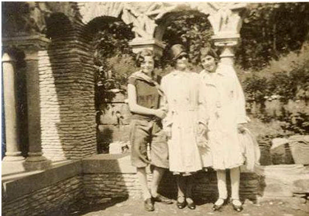
Ruinene var populære besøksmål.

Sammenlignet med andre land i Europa, har vi svært få byggverk fra middelalderen, og dette gjør det spesielt viktig for oss å ta vare på de restene vi har. Med en ruin menes i vår sammenheng restene etter anlegg bygget av stein eller tegl lagt i kalkmørtel, som er fra før reformasjonen (1537).