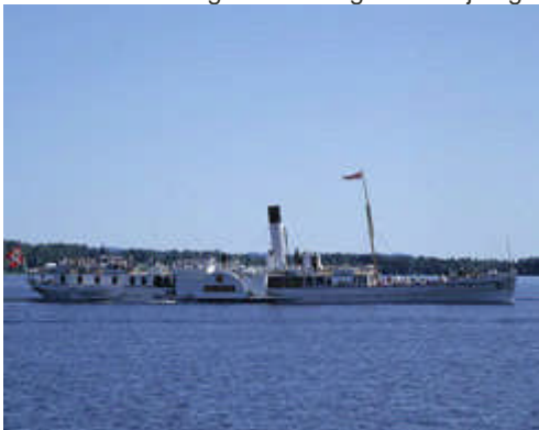
Skibladner er et kjent og kjært innslag på Mjøsa i sommersesongen.

Hjuldampere "Skibladner" fra 1856 og bilfergen "Skånevik" fra 1967 er de to første fartøyene som er fredet her i landet. Flere fartøyer med særlig kulturhistorisk verdi planlegges også å fredes.