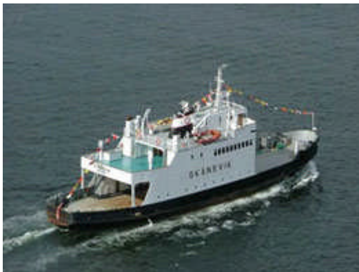
Skånevik eies og drives i dag av et ferjelag. Fartøyet leies ut til ulike formål.

For første gang brukte Riksantikvaren i 2006 kulturminnelovens muligheter til å fredet fartøyer av særlig kulturhistorisk verdi.