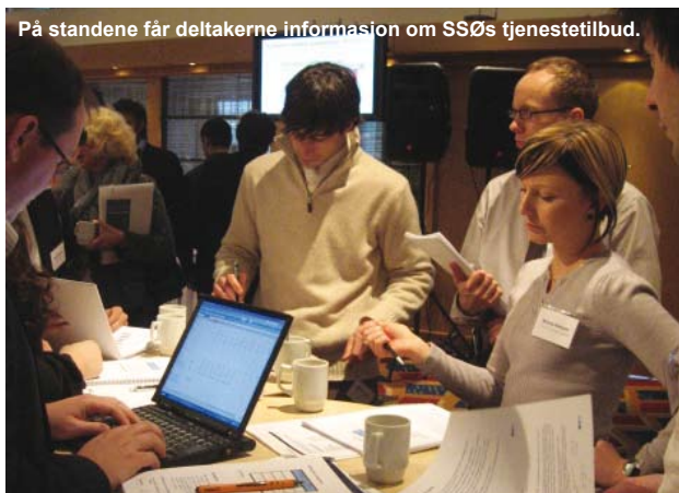
På standene får deltakerne informasjon om SSØs tjenestetilbud.