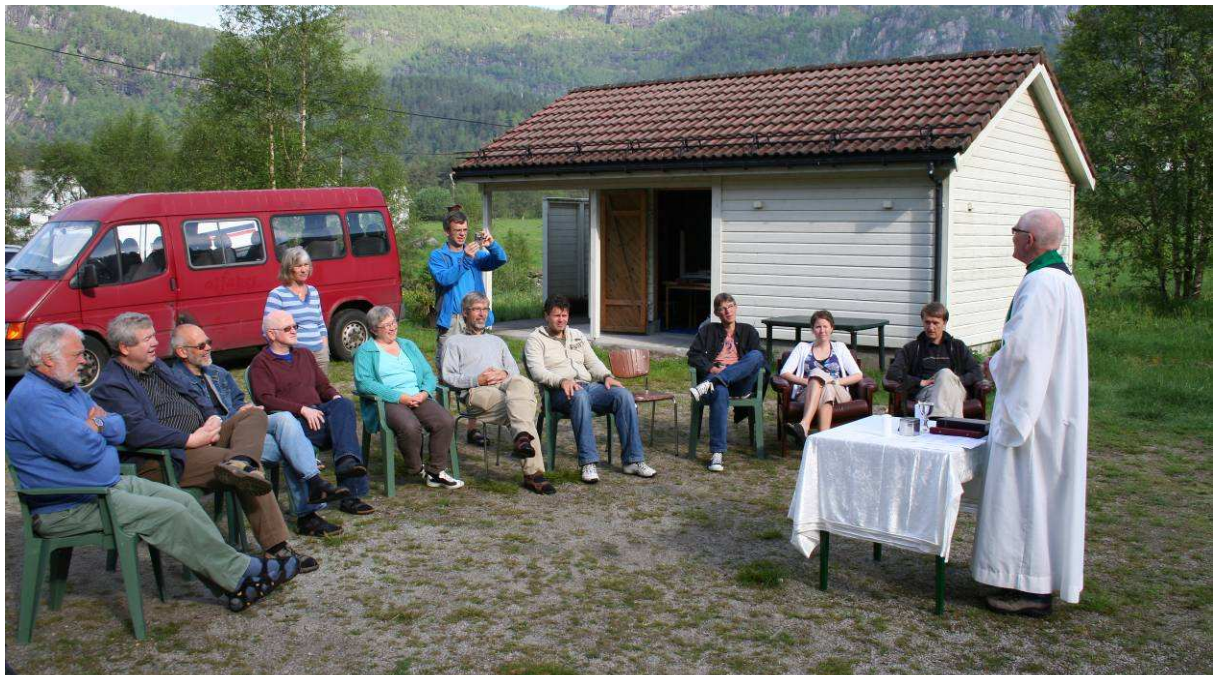
Prester og daglige ledere i Sandnes prosti samlet på Tonstad.

Presteskaper i de to største byene har høyt aldersgjennomsnitt. Samtidig sliter vi med betjening av ungdomsgenerasjonen nettopp i disse bysentra. Bispedømmet vil måtte målrette utlysningen av noen av sine presteressurser i byene mot ungdomsgenerasjonen i sterke grad enn før. Arbeidet er satt i gang fra årsskiftet 07/08.