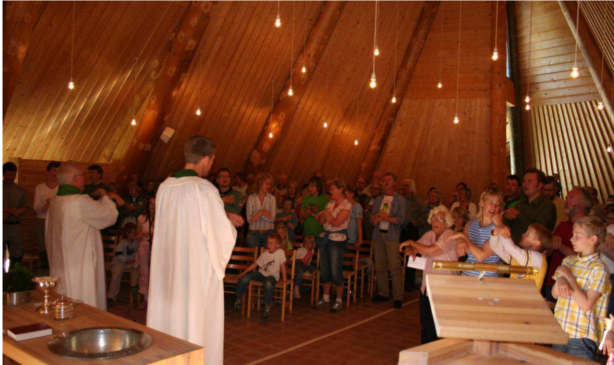
Gudstjeneste i Brekko sportsskpell, Gjesdal.