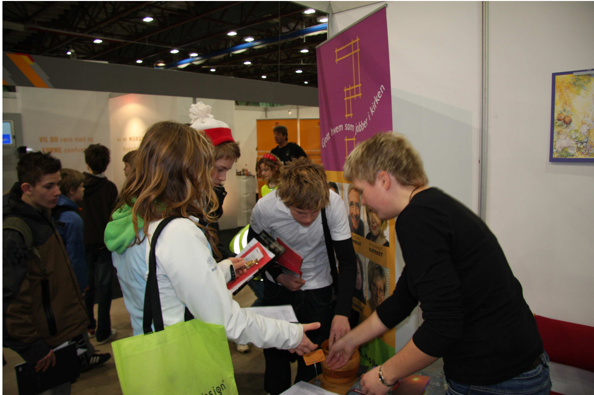
Fra utdanningsmessen i Stavanger.