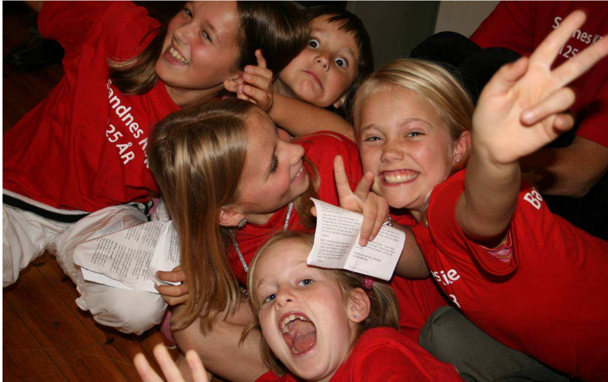
Sandnes barnegospel ved 125-årsjubileet i Sandnes kirke september 2007.