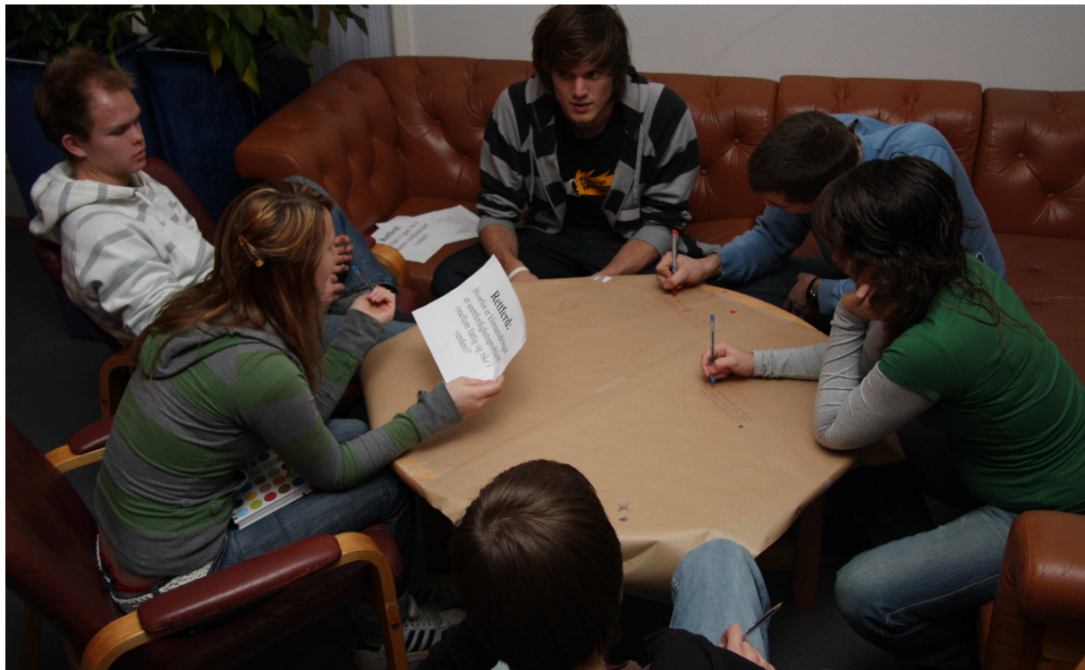
Ungdomstinget samlet høsten 2007.

Et slikt ressurscenter vil også kunne ha et annet sterkt bein å stå på ved å tilby den nasjonale kirke opplæring og kompetanse i kordrift og kordireksjon. I samarbeid med bl.a. Norsk kirkesangforbund og Ung kirkesang som allerede er lokalisert med driftsenhet i Stavanger og med et sterkt kormiljø i bispedømmet som referanseramme, kan dette være en etterlengtet ressurs i arbeidet med å styrke og videreutvikle sider av kirkemusikken. Etter av prosjektet ”Kyrkjelyd” har fått tilsagn om fast tilførsel av statlige midler også etter 2008 gjennom Stavanger Symfoniorkester vil dette prosjektet disponere profesjonelle musikere som kan berike kompetansetilgangen ved et evt. kirkelige ressurs- og kompetansesenter.