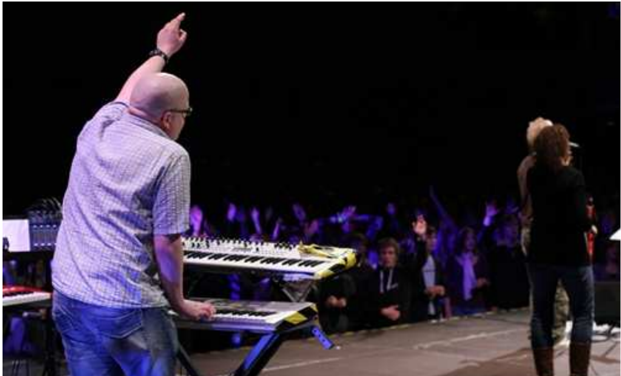
Fra IMPULS 2007 i Stavanger. 35 00 ungdommer samlet på en helg i IMI - kirken, Stavanger.

Barne- og ungdomsarbeid forstått som kontinuerlige tiltak i menighetene i samarbeid med organisasjonene, opplever ikke store endringer. Pågangen til de mange leirene for barn og unge er meget stor. På flere leirer opereres det med ventelister. Endog noen ungdomsleirer har ventelister med ledere som ønsker å stille opp.