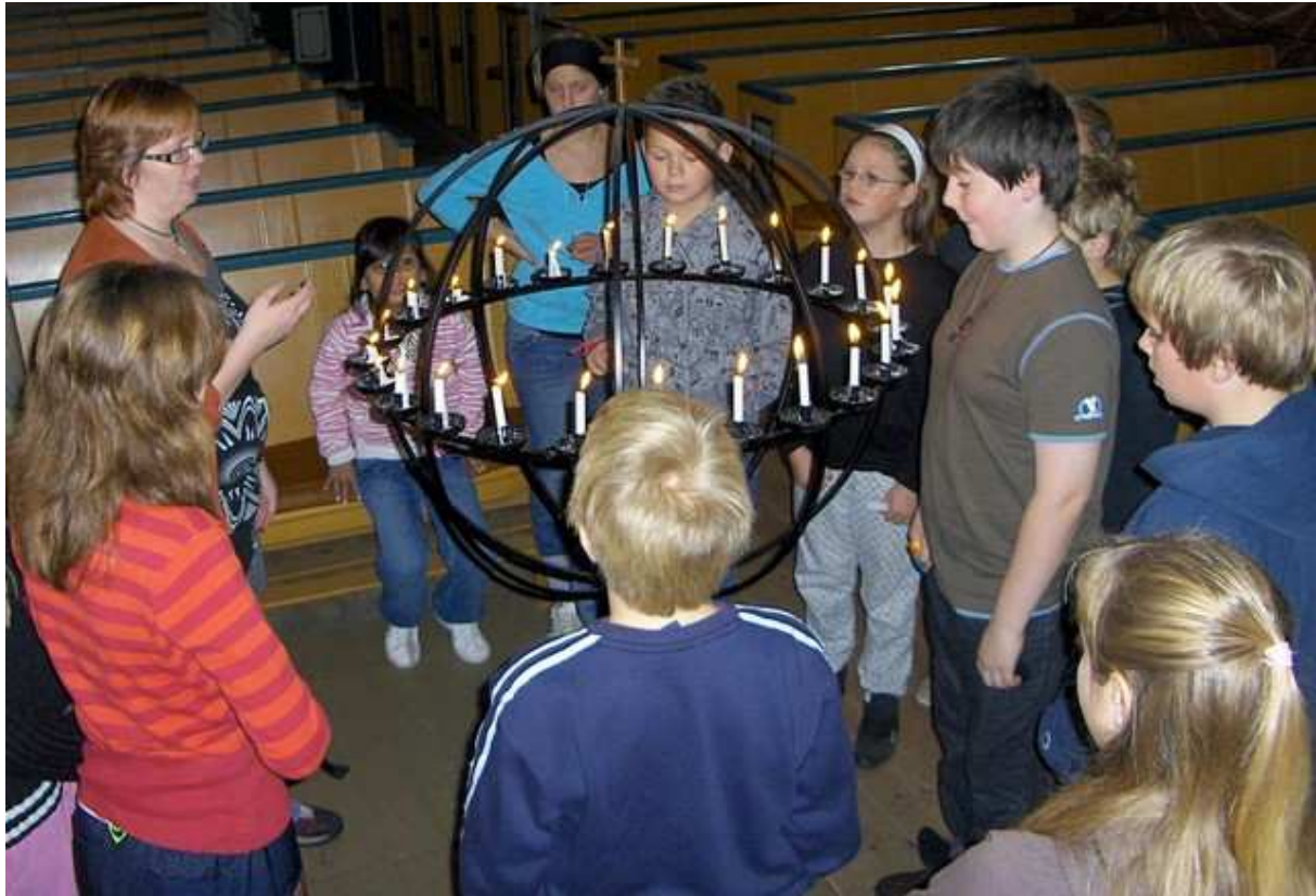
Utdeling av Det nye testamente til 6-klassinger. Egersund.

søket deltok i Dalane prosti vel 30 personer fra alle ulike sokn på temaeksjonen ”Trosopplæring i menighetene”.