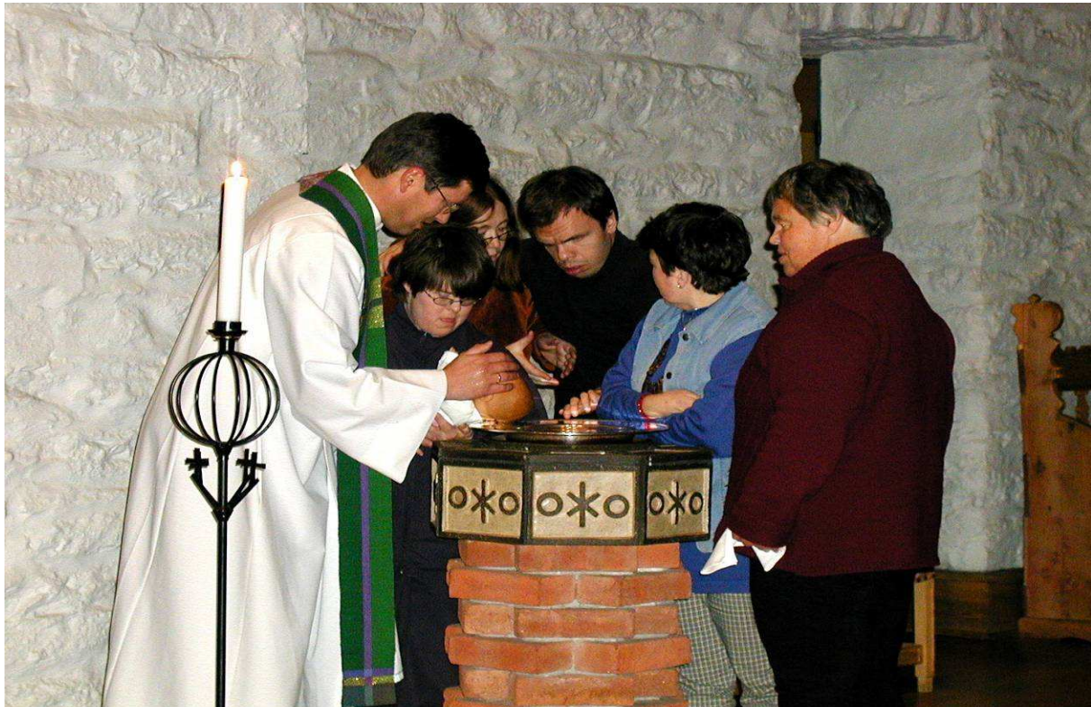
Integrering av funksjonshemmede er en viktig prioritering.

Stavanger bispedømmeråd Diakonistiftelse Rogaland har i samarbeid med lokale menigheter i flere år arrangert weekendturer for mennesker med utviklingshemming. Dette året ble det arrangert to slike samlinger i bispedømmet. Trosformidling og gudstjenestearbeid står sentralt, men også fellesskap, samhandling og nye opplevelser er viktige moment.