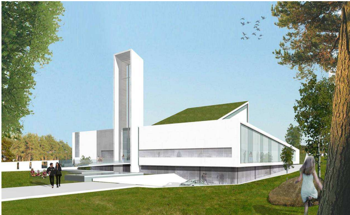
Frøyland - Orstad nye kirke. Mål om vigsling i desember 2008.

FR og lokalmenigheter med nye kirkeprosjekt sliter formidabelt. I en tid med stadig mindre overføringer fra staten til FR'ene og der FR'ene i liten grad synes å få noen særlig uttelling for en styrket kommuneøkonomi viser dette med all tydelighet hvor påkrevd det er å få en mer forutsigbar kirkeøkonomi i Dnk.