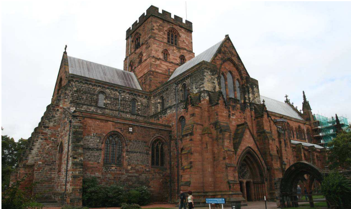
Katedralen i vennskap bispedømmet Carlisle. Fra besøk høsten 2007.

Stavanger biskop, prostene i bispedømmet og bispedømmets administrasjon besøkte Carlisle vennskapsbispedømme i august 2007. Denne kontakten stekker seg tilbake til 1980 tallet med en rekke ungdomsutvekslinger mellom våre bispedømmer. Kontakten ble fornyet etter inngåelsen av Porvo avtalen. Vi har hatt gjensitt av prostene i Carlisle, og biskopene har besøkt hverandres bispedømmer ved gjentatte anledninger. I mai 08 kommer Carlisle bispedømme på et lengre besøk i Stavanger for bl.a. å delta på deler av vårt visitasforsøk. Også en rekke menighetsgrupper har vært innen Carlisle de siste årene, uten at det så langt er utviklet vennskapsavtaler menighet til menighet.