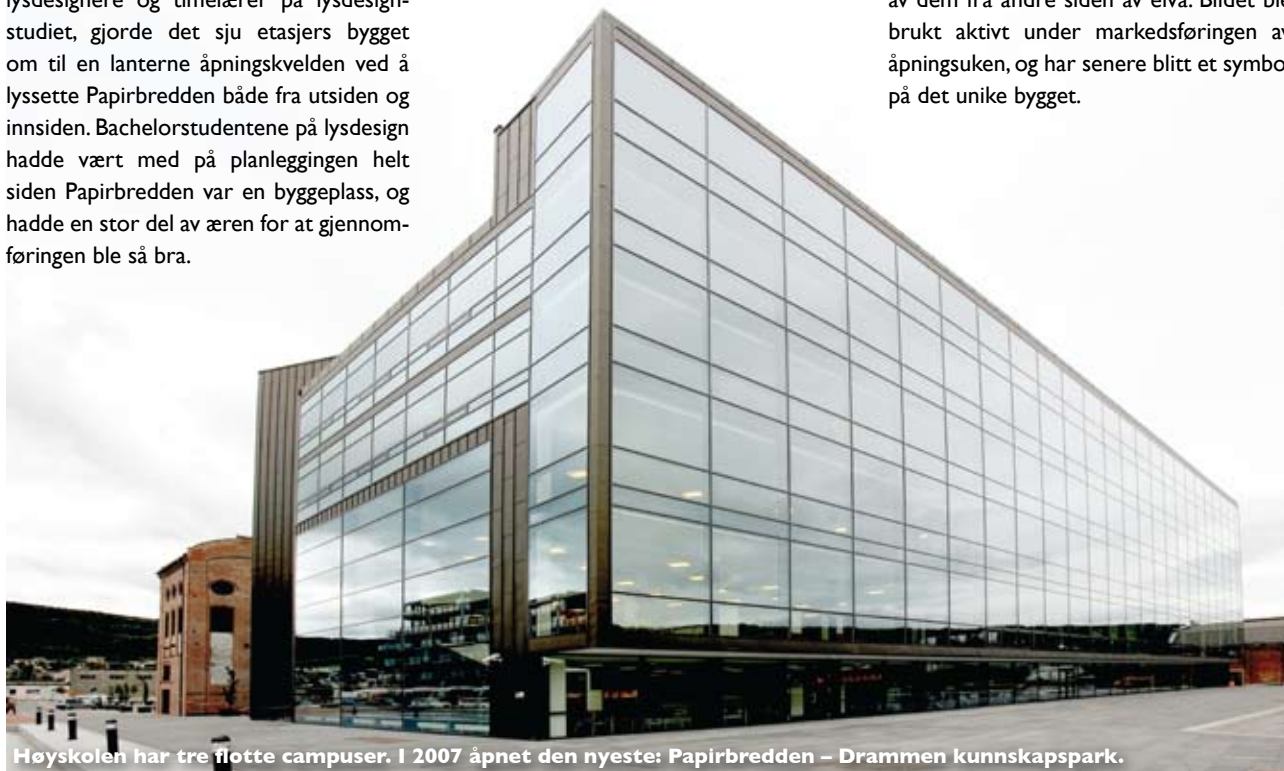
Høgskolen har tre flotte campuser. I 2007 åpnet den nyeste: Papirbredden – Drammen kunnskapspark.

Drammensfotografen Torbjørn Tandberg tok forut for åpningen et helt spesielt bilde av Papirbredden. Han plasserte sortkledde mennesker i vinduene og tok bilder av dem fra andre siden av elva. Bildet ble brukt aktivt under markedsføringen av åpningsuken, og har senere blitt et symbol på det unike bygget.