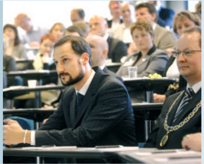
HKH Kronprins Haakon gjestet NHH-Symposiet i mars. Årets konferanse er den best besøkte noensinne, med hele 440 påmeldte deltakere. Tema for konferansen var hvordan ledere og deres organisasjon må tilpasse seg sine omgivelser, se og ta hensyn til flere interessenter og hvordan de kan forholde seg til og håndtere overraskelser.