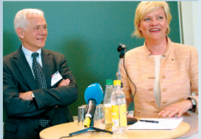
Selskapsstyring var temaet under vårkonferansen i mai. Victor D. Norman og finansminister Kristin Halvorsen i godlynt debatt.