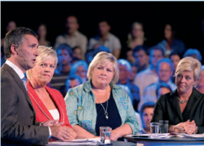
Nærmere 500 mennesker var på plass i Aulaen under årets første valgkampduell, direktesendt på NRK1.