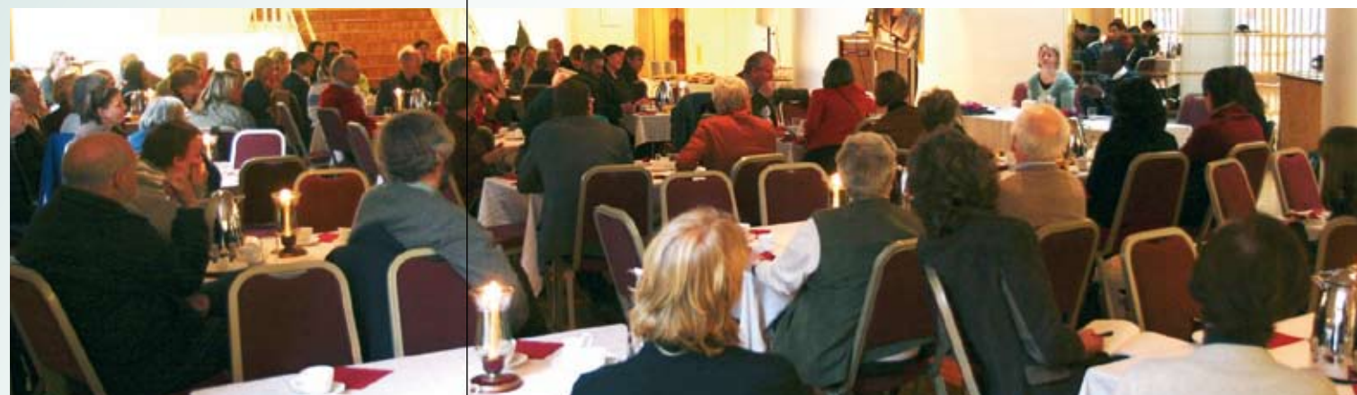
Svært mange møtte opp under frokostforumet i februar.

5 til å kjenne deg velkommen – det skjer ikke alltid i begynnelsen, fortalte han.