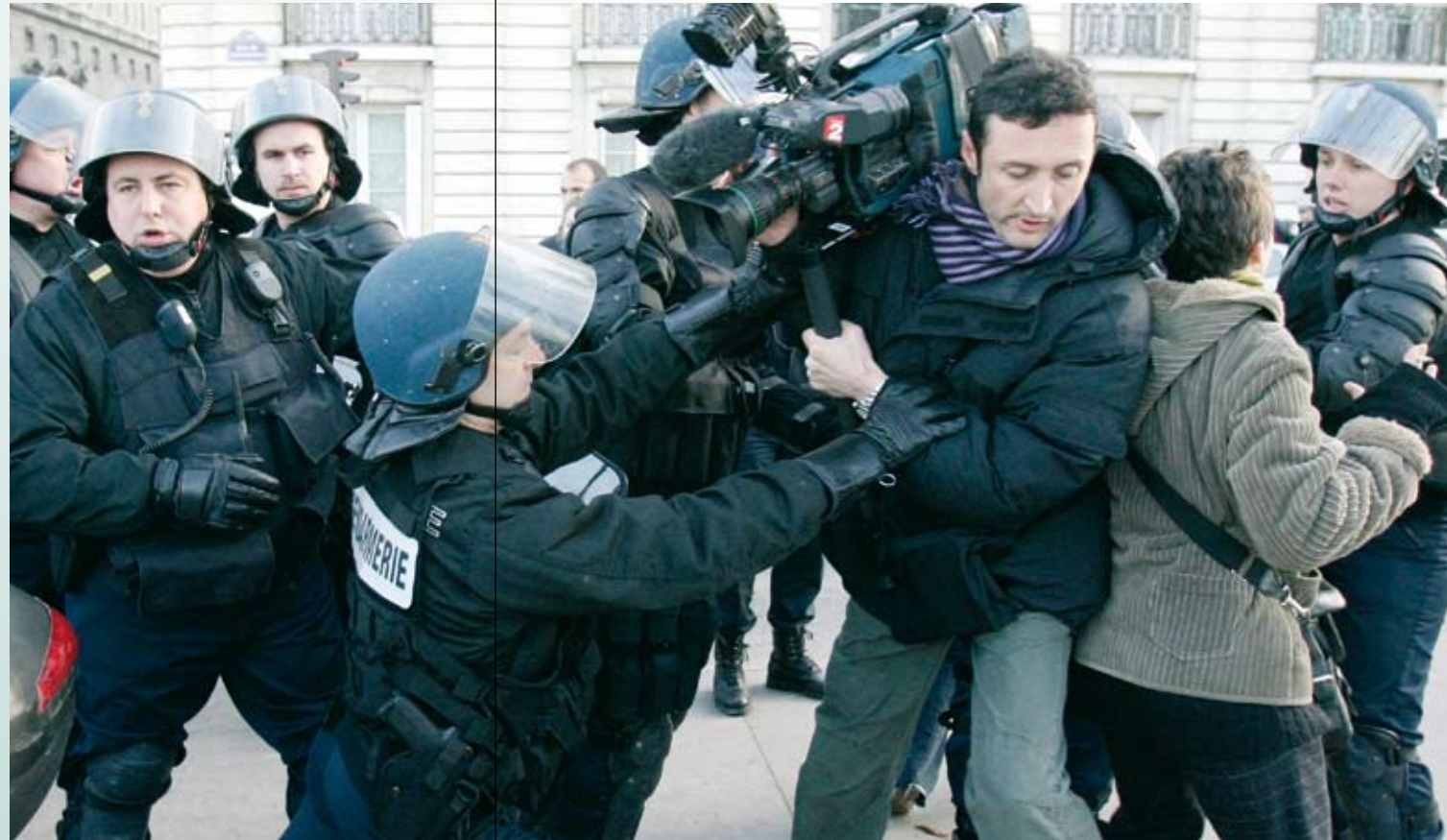
En journalist dyttes under en demonstrasjon Reporters Without Borders i Paris i 2007. Foto: AP / Francois Mori med