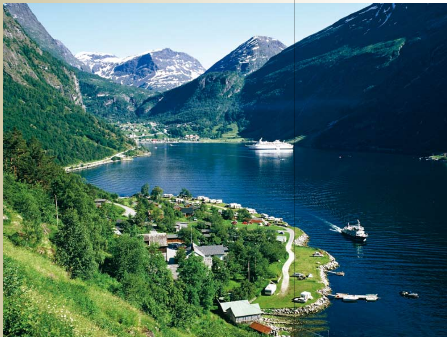
Geirangerfjorden ble ført inn på UNESCOs verdensarvliste i 2006.

Pyramidene i Egypt, Viktoriafallene i det sørlige Afrika, Den kinesiske mur, Venezia og Grand Canyon står alle på UNESCOs verdensarvliste. I 2007 inneholdt listen totalt 851 steder av «enestående universell verdi», og blant