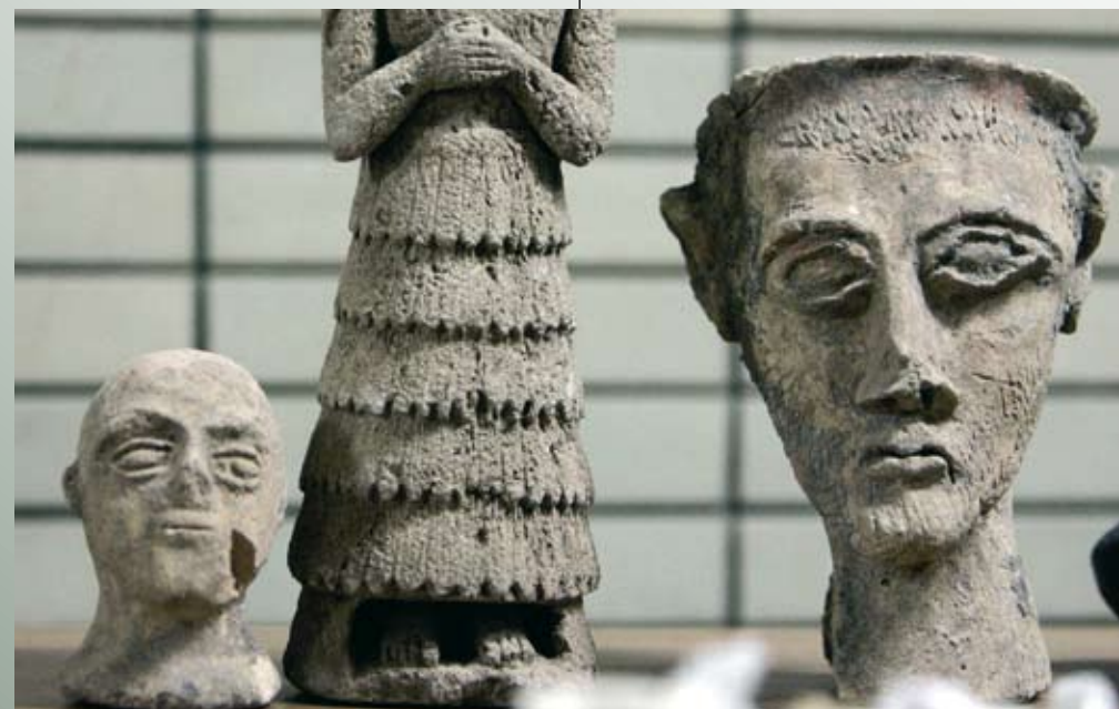
Bildetekst over ...

Til venstre: Flere tusen kulturgjenstander ble stjålet under krigen i Irak. I 2008 ble flere av dem, deriblant disse, levert tilbake til Nasjonalmuséet i Bagdad. Rundt 2050 kulturgjenstander ble funnet under en utgravning i byen Nasiriyah, og tilbakeført til muséet.