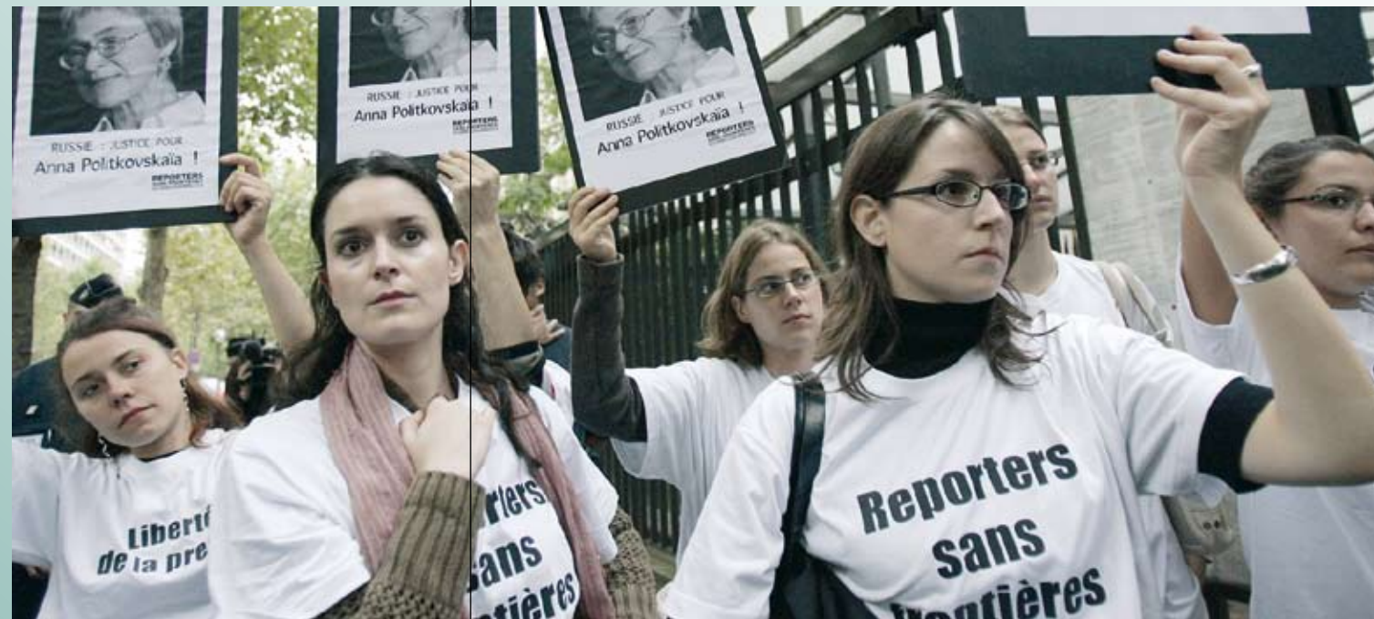
Medlemmer av Reporters Without Borders holder opp bilder av den drepte journalisten Anna Politkovskaya under en demonstrasjon.

De europeiske landene som tok ordet i debatten, inkludert Norge, uttrykte en klar støtte til arbeidet med 1970-konvensjonen for å komme ulovlig handel med kulturgjenstander til livs. Det var også en klar, positiv holdning til at utviklingslandene bør få hjelp til å bygge opp profesjonelle museer. Det hersket likevel en viss tilbakeholdenhet blant de vestlige landene i disse spørsmålene, og mye tyder på at muséer i vestlige land vil oppleve et voksende krav om tilbakelevering av kulturgjenstander i årene som kommer.