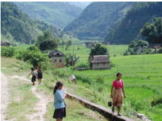
Sektorevalueringa av norsk bistand til kraftsektoren kan påvise fattigdomsreduksjon i eitt av prosjekta i Nepal.

Bistand som elles er godt gjennomført gjer ikkje nødvendigvis levkåra lettare for det fattige fleirtalet av befolkninga. Landevalueringa av Zambia viser at det ofte er vanskeleg å dokumentere positiv effekt for fattigfolk – i alle fall på kort sikt – av program som elles kan vere vellykka når det gjeld til dømes institusjonsstyrking. Studien konkluderer mellom anna med at det var vanskeleg å sjå at dei norske tiltaka teamet vurderte har hatt ein varig verknad for dei fattige i landet. Sektorevalueringa av norsk bistand til kraftsektoren kan påvise fattigdomsreduksjon i eitt av prosjekta i Nepal, men kan ikkje dokumentere ein slik effekt i fleire andre tiltak på området. Verdsbankens evaluering av bistand til straumforsyning på landsbygda viser at fattigdomsreduksjon ikkje har stått sentralt i slike program i Verdsbanken, og at folk med høge og mellomstore inntekter har mest fordelar av elektrifiseringa.