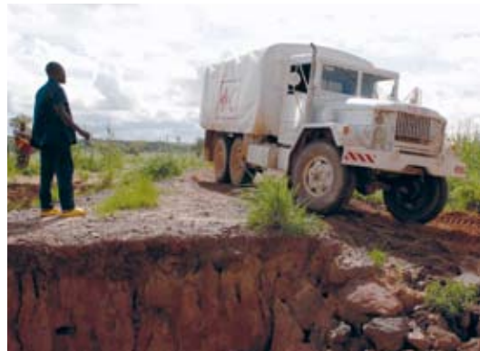
Første distribusjon med M6 lastebilar i forbindelse med matkrisen i Niger. Til landsbyen Dangona, vest i Niger.

Evalueringa av bruken av tidlegare militære lastebilar i nødhjelp viste at Utanriksdepartementet stoler mykje på informasjonen frå dei store frivillige organisasjonane, men ikkje har god nok kapasitet til å vurdere resultat og verkknader av den humanitære bistanden. Evalueringa av NOREPS, som vart fullført i mars 2008, viste at rapporteringsrutinar og statistikkføring i NOREPS er for svak, samstundes som UDs styring blir for detaljorientert og manglar strategisk tilnærming. Rapportane tyder difor på at Utanriksdepartementet bør ta eit nytt strategisk blikk på forvaltninga av humanitær bistand.