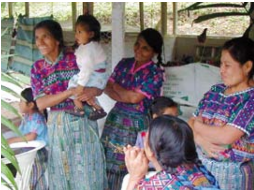
Guatemalske organisasjonar er blitt betre rusta til å kjempe for demokrati og kvalitet, og deltaking i utdanningstiltak er auka.

Vurderinga av Tibetmisjonens bistand i Nepal, som var ein del av kraftevalueringa, viser det same. Gjennom langsiktig tenking og stegvis utvikling av aktivitetar på ulike område i lokalsamfunnet sikra ein fokus på tiltak som var direkte nyttige for befolkninga og som lokale krefter kunne føre vidare.