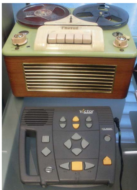
50 års historie - fra bånd - CD