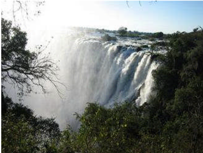
Victoria Falls står på UNESCOs verdensarvliste.