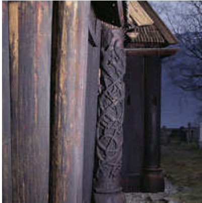
Urnes stavkirke.