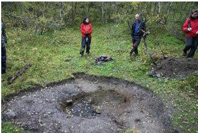
Kokegrop, arkeologisk utgravning i Lærdal.

Riksantikvaren har i 2007 arbeidet med oppfølging av rundskriv T-02/2007 – Dekning av utgifter til arkeologiske arbeider ved mindre, private tiltak.