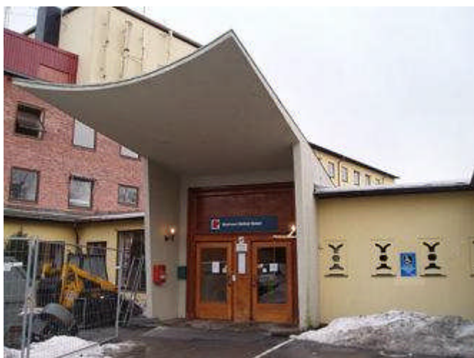
Haldenklinikken ble fredet i fjor sommer.

Flyplasser, fengsler og sykehus og andre store bygningskomplekser skal komme på fredningslisten. Landsverneplanarbeidet er det største fredningsprosjektet siden 1920-tallsfredningene.