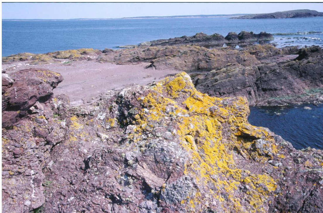
Søster – gullav

Gjennomføring av nasjonalparkplanen og tematiske verneplaner er særlig viktige oppgaver for bærekraftig bruk og vern av biologisk mangfold. Likeledes er marin verneplan, utvidet skogvern, arbeid for bevaring av villaks, kartlegging av biologisk mangfold, rovviltforvaltning og oppfølging av EUs rammedirektiv for vann, særlig viktige oppgaver.