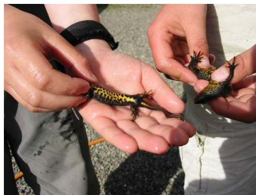
Stor salamander

Fylkesmannen er involvert i nasjonale planer på elveperlemusling, stor salamander (feltarbeid gjennomført), åkerrikse (innspill til Fylkesmannen i Rogaland) og rød skogfrue (skjøtsel gjennomført). Det foreligger planer/oversikter for Østfold på karplanter (høyerestående planter), sommerfugler, biller, fugl og landpattedyr. Flere mindre områder skjøttes. Handlingsplan for honningblomst ble startet opp i 2008. Det ble også arbeidet med klippeblåvingen. Ut fra norsk liste over fremmede, innførte og uønskete arter i Norge 2007, er en del arter i Østfold vurdert spesielt.