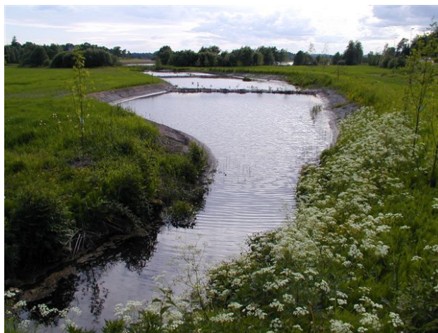
Fangdam – Våler

Utfordringene og behovet for midler til tiltak er vesentlig større enn rammen, og prioriteringen er stram. I tre utsatte vassdrag er det iverksatt restriksjoner om jordarbeiding (forskrift). Ved å gjennomføre rett miljøtiltak på rett sted vil landbruket bidra til renere vassdrag og til å vedlikeholde et åpent kulturlandskap med biologisk mangfold og fornminner.