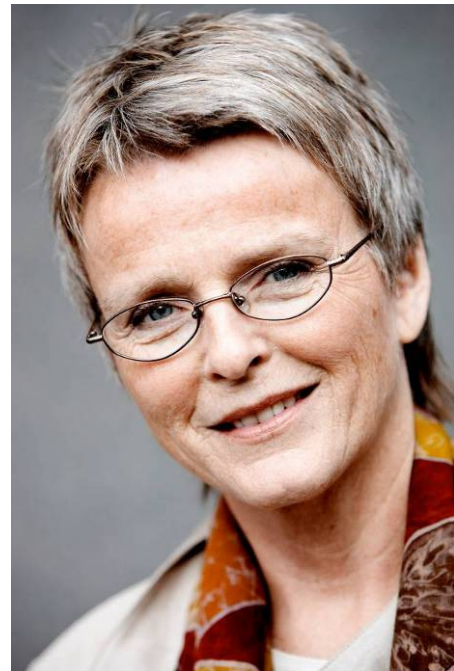
Fylkesmann Anne Enger