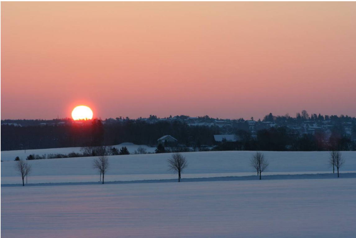
Soloppgang over Bakkeli i Sarpsborg – sett fra Kalnesbrekka (det nye sykehusområdet)