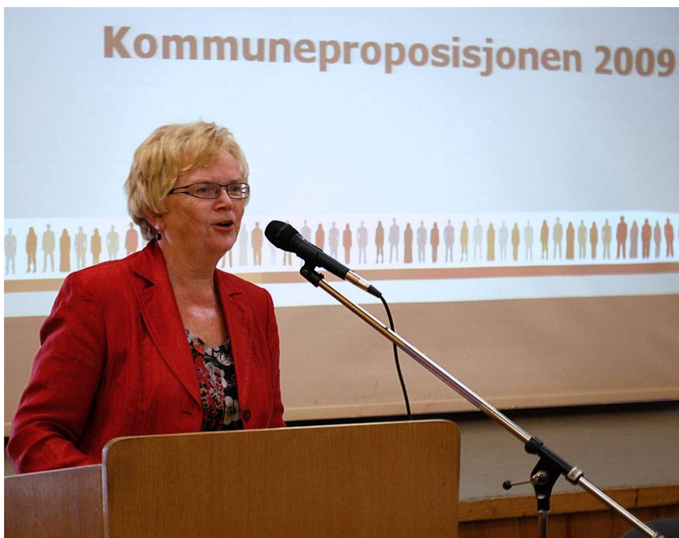
Statsråden i møtet om kommuneproposisjonen - Rakkestad 2008