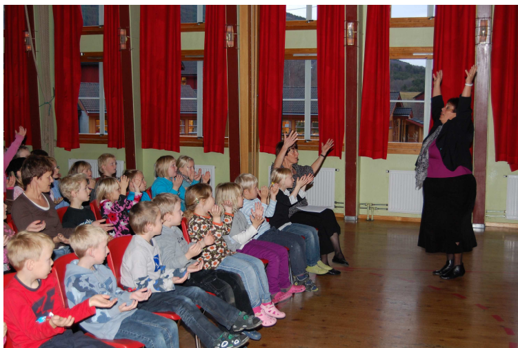
Visitas i Dovre: Småskulesteget på Dovre skule lærte nye songar av biskopen.

tenke utfordringer for veien videre. Visitasprotokollene vil gi et godt grunnlag for arbeidet med ny strategi.