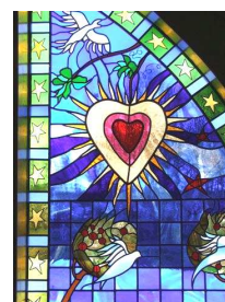
Lyskapellet, Øystre Slidre

Menighetsrådene er opptatt av inventar av kunstnerisk art i egne kirker. Dette kommer særlig til uttrykk i forbindelse med kirke-jubileer, med søknader om flytting,