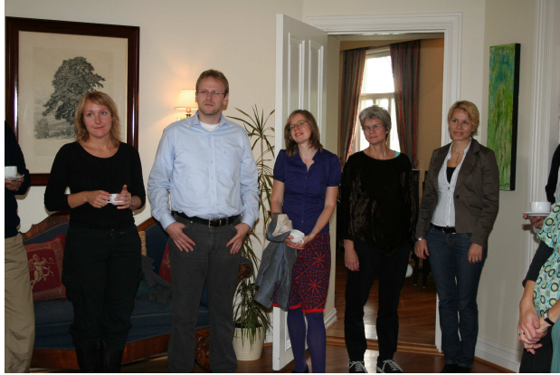
Fra samlingen for nytilsatte 5. september 2008

Bispedømmekontoret gjennomfører et introduksjonsprogram for proster og et for nytilsatte prester. Prostene har i tillegg egen "drømmedag" på bispedømmekontoret når de tiltrer, det samme har prostenes saksbehandlere.