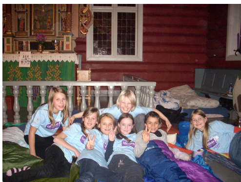
LysVåken-prosjektet favnet bredt. 54 menigheter i bispedømmet deltok. Her fra Ottestad kirke.

I arbeidet med å utvikle kirkens trosopplæring og støtte det miljøskapende og forebyggende arbeidet blant barn og unge er det arrangert to samlinger for alle trosopplærings-medarbeidere og kateketer i bispedømmet, med fokus på overgrepssproblematikk og forberedelse av "LysVåken".