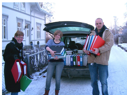
Kopibøker 1993-2005 avleveres til statsarkivet

Rettsaken mot en av bispedømmets prester fortsatte inn i 2008 og ble avsluttet i lagmannsretten. Dommen preget i lengre tid arbeidet både på kontoret og lokalt.