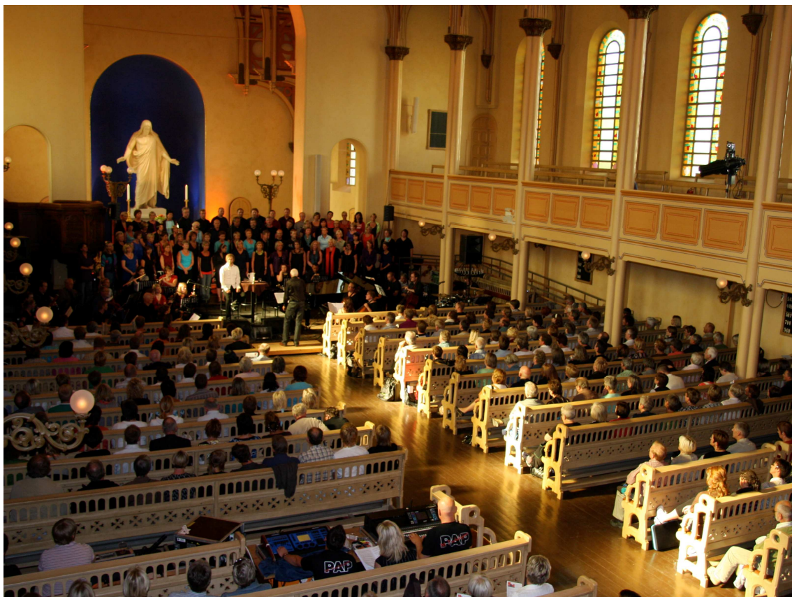
Medarbeiderdag i St Petri kirke for alle ansatte 12. juni 2008.

Stavanger biskop / bispedømmeråd og alle fellestrådene gjennomførte i juni måned en medarbeiderdag for 450 kirkelig ansatte i St.Petri kirke. Tema: "Vær frimodige og glade!" Medarbeiderdagen ble evaluert som meget vellykket og lærerik. Slike samlinger vil bli gjennomført annethvert år.