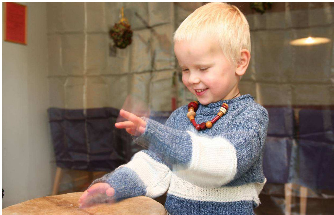
Fra Riska menighetsbarnehage, Knøttene Åpen Barnehage.

Vi har ønsket å legge Ungdomstinget for Stavanger bispedømme til vårsemesteret heller enn i høstsemesteret. Det ble derfor ikke arrangerte ungdomsting i 2008. Denne viktige samlingen med unge utsendinger fra menighetene vil bli arrangert i mars 2009.