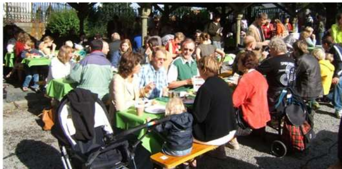
Grønn frokost i Stavanger.

I august ble det for fjerde gang arrangert gratis folkefrokost i Stavanger. Det er Grønn Hverdag i samarbeid med Oikos, Stavanger Bispedømme og Ullandhaug økologiske gård som arrangerer frokosten. Hensikten er at folk skal få smake det som finnes på markedet av miljøvennlig og rettferdig handlet mat, samtidig som de skal få god informasjon om selve maten og hvor man får tak i den.