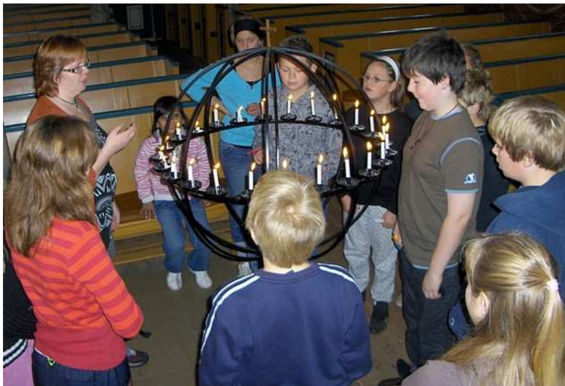
Utdeling av Det nye testamente til 6-klassinger. Egersund.