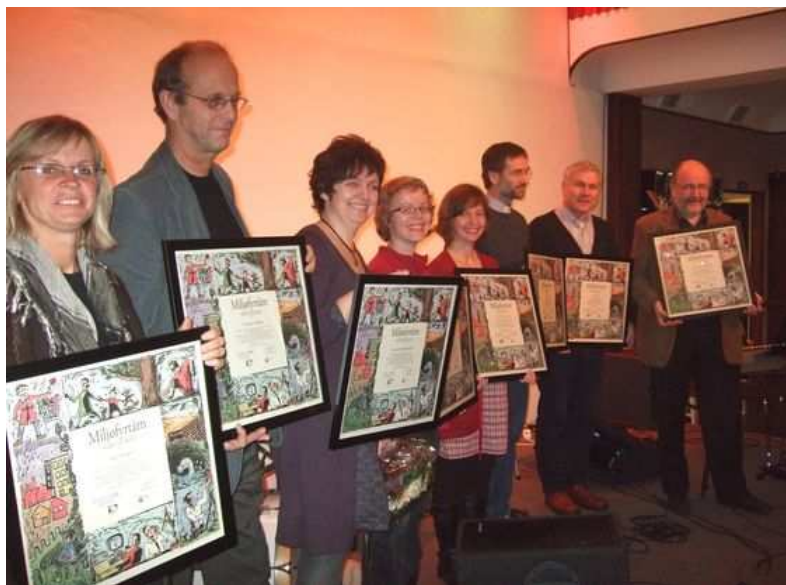
Nye miljøfyrtårn-menigheter i Haugesund prosti.

Miljøfyrtårnsertifisering av menigheter og fellestråd og seminarer om hvordan vi tar vare på skaperverket har vært prioritert i 2008. Stavanger bispedømme har en ressursgruppe innen "Forbruk og rettferd" med bred representasjon. I samarbeid med Grønn hverdag og Stiftelsen Miljøfyrtårn ble menighetene Rossabø, Skåre, Vår Frelser, Utsira, Bokn, Førresfjorden, Nedstrand og Tysvær miljøfyrtårnsertifisert i 2008. Det pågår et arbeid for å få sertifisert Lura, Hana og Høyland menigheter i Sandnes prosti.