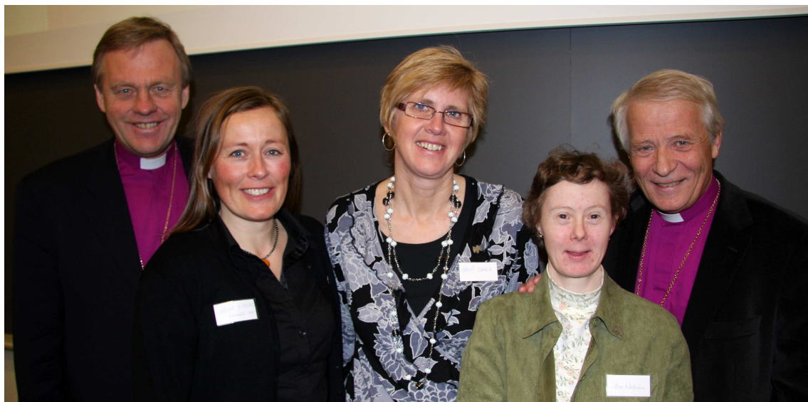
Biskopene Baasland og Hagesæther sammen med de to integreringskonsulentene i Stavanger bispedømme og en av deltakerne på landskonferansen HEL i Sandnes 2008.

4.-5. mars ble landskonferansen HEL – et helt menneske – et helt liv – en hel kirke, gjennomført i Sandnes. Konferansen ble arrangert av bispedømmene i Stavanger, Bjørgvin og Agder og Telemark i samarbeid med Kirkerådet og Diakonhjemmets høyskole avd. Rogaland. Konferansen fikk tildelt prosjektmidler fra trosopplæringsreformen. Målsettingen med konferansen var å gi medarbeidere i trosopplæringen kunnskap som skulle gjøre dem sterkere rustet til å gi et tilbud til de barn og unge som har en utviklingshemming. Konferansen skulle også være nettverksbyggende og bidra til at erfaringer fra ulike prosjekt kunne komme flest mulig til gode. Det var over 100 deltakere fra hele landet på konferansen og tilbakemeldingene var gode.