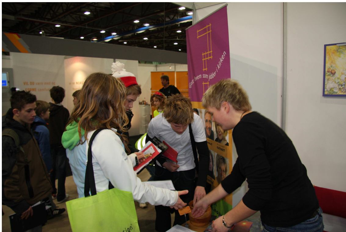
Fra utdanningsmessen i Stavanger.