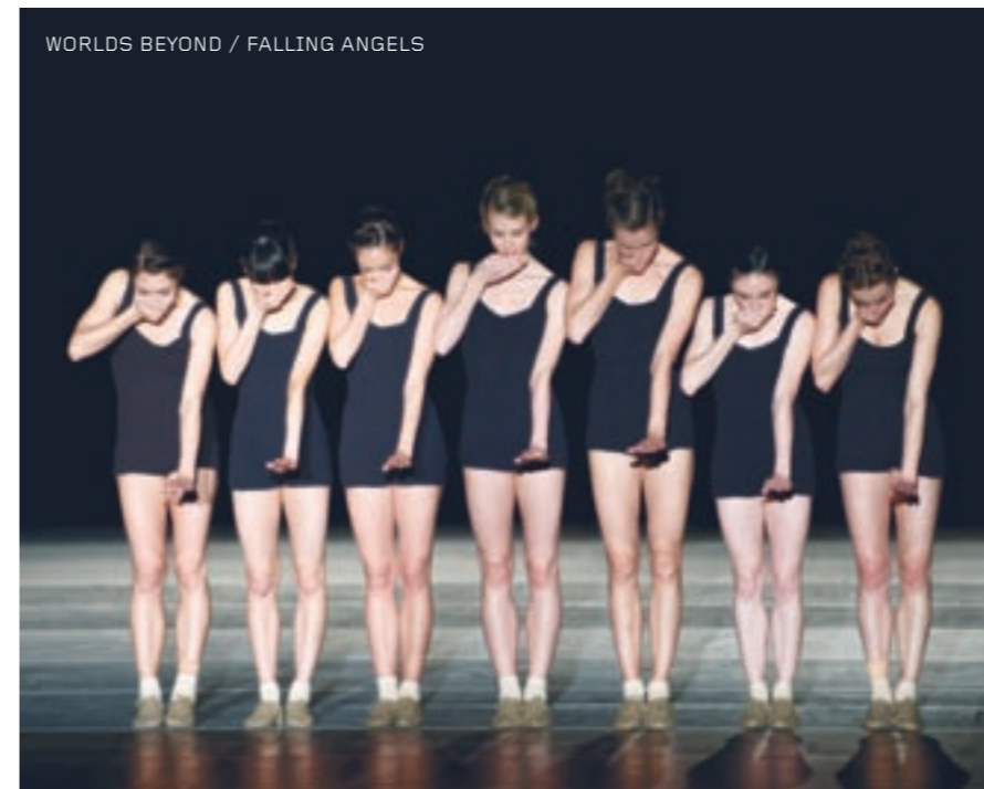
WORLDS BEYOND / FALLING ANGELS

Publikumsbesøket på Operaens tre scener utgjorde 170.846 personer, dvs. 97 % i gjennomsnittlig setebelegg. Foajékonserter, turnéforestillinger/-konserter og konserter i Oslo forøvrig ble besøkt av 16.389 personer. Samlet ble publikumsbesøket 187.235 personer. Det totale besøk av barn og unge utgjorde 14.986, det vil si ca 9 % av publikumstotalen for