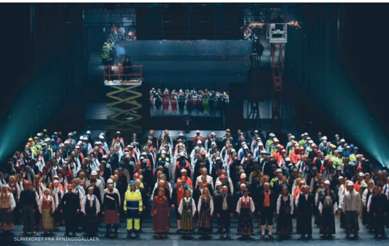
SLAVEKORET FRA ÅPNINGSGALLAEN