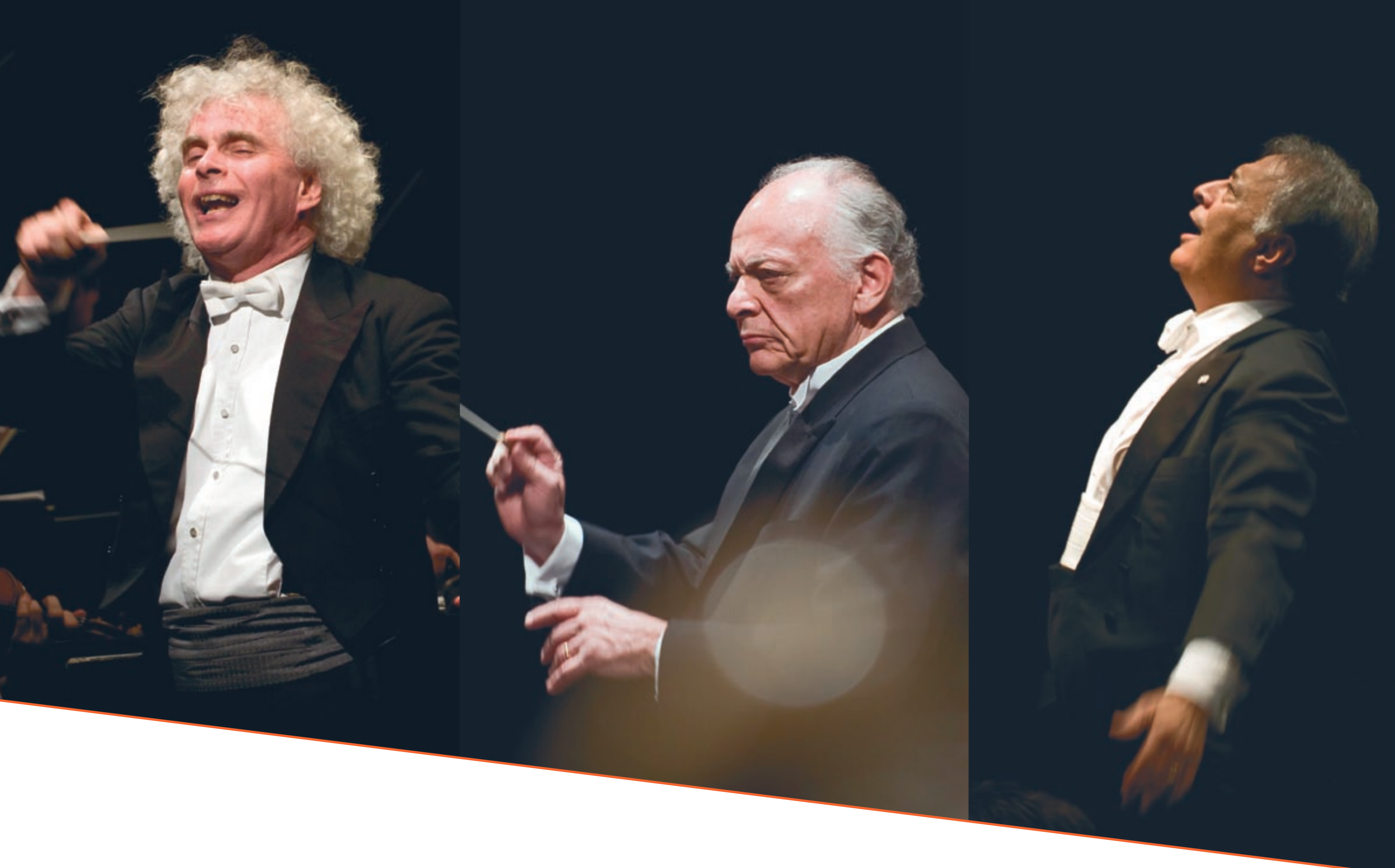
FRA VENSTRE / SIR SIMON RATTLE, LORIN MAAZEL OG ZUBIN METHA