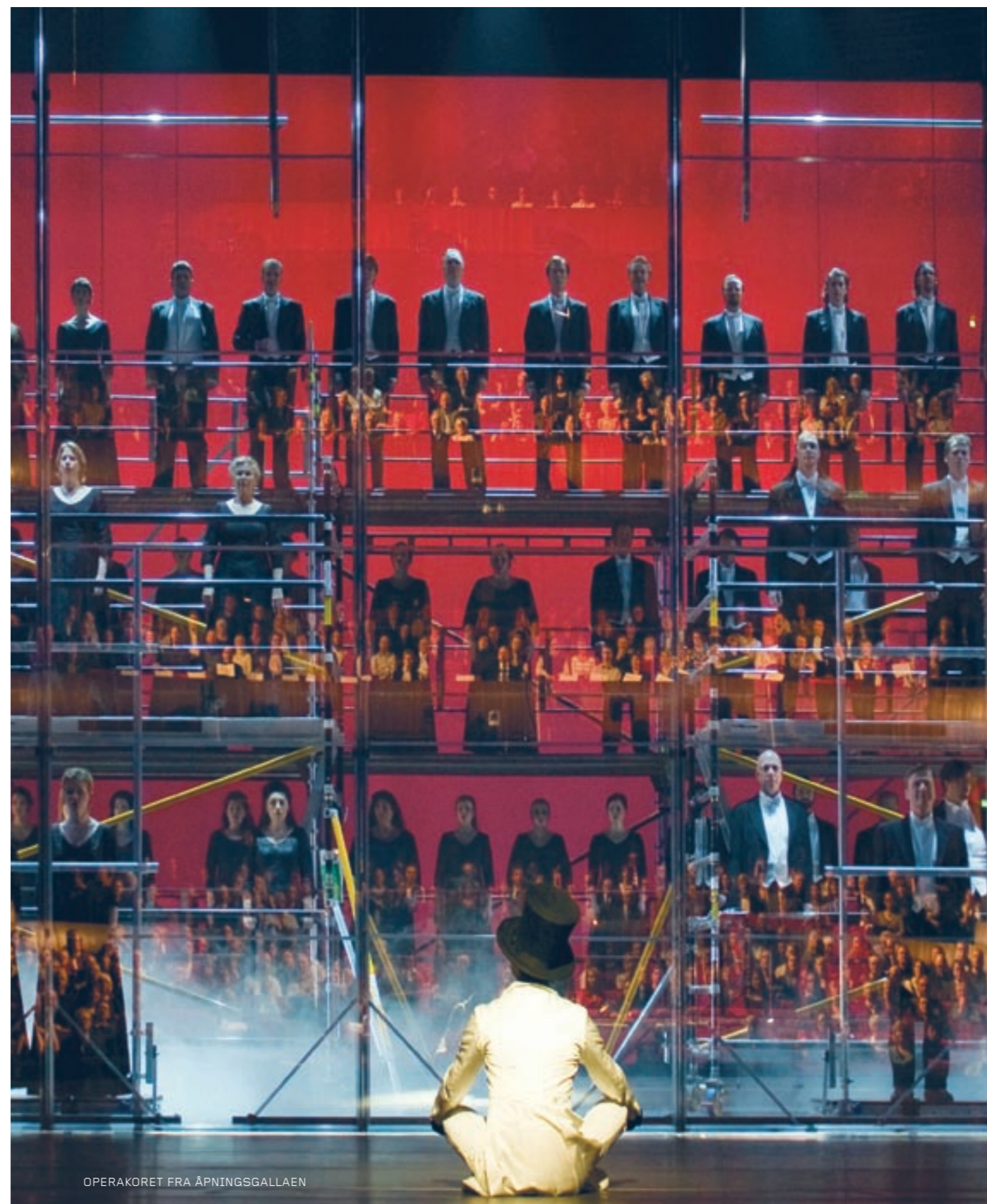
OPERAKORET FRA ÅPNINGSGALLAEN

Bundne skattetrekkmidler utgjorde pr. 31.12.08 kr 10.825.323,-. Den Norske Opera & Ballett hadde pr. 31.12.08 ingen lånegarantier overfor ansatte.