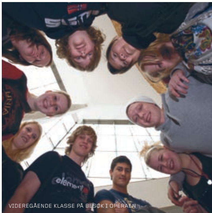
VIDEREGÅENDE KLASSE PÅ BESØK I OPERAEN