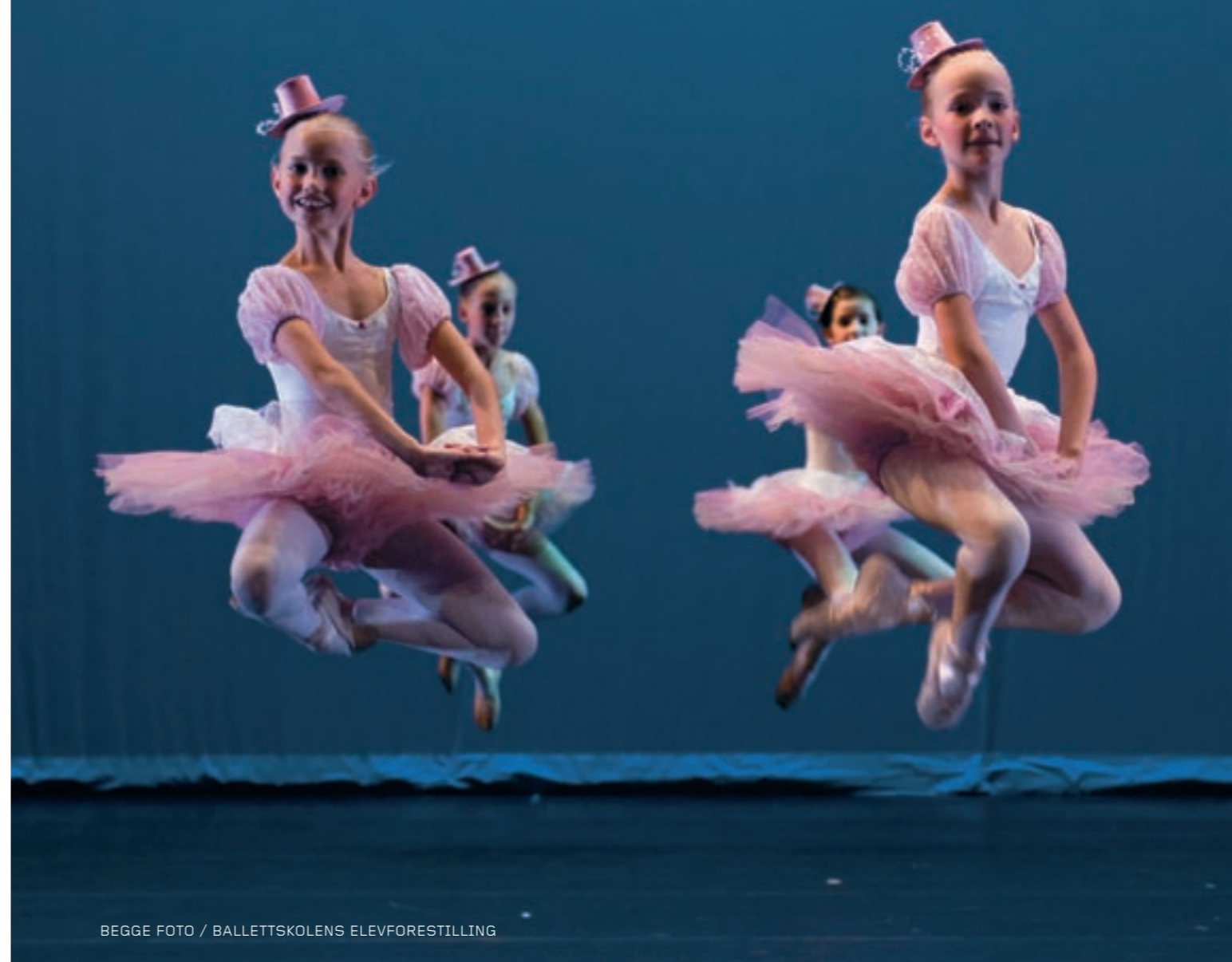
BEGGE FOTO / BALLETTSKOLENS ELEVFORESTILLING

Ballettskolen har i 2008 mottatt verdifull ekstern støtte fra Musikk i Skolen (til Ballettskolens kulturforum for deltagelse i nordisk ballettseminar i Stockholm), Norsk Tipping (til talentfremmende tiltak) og Foreldreforeningen ved Operaens Ballettskole (reisestøtte).