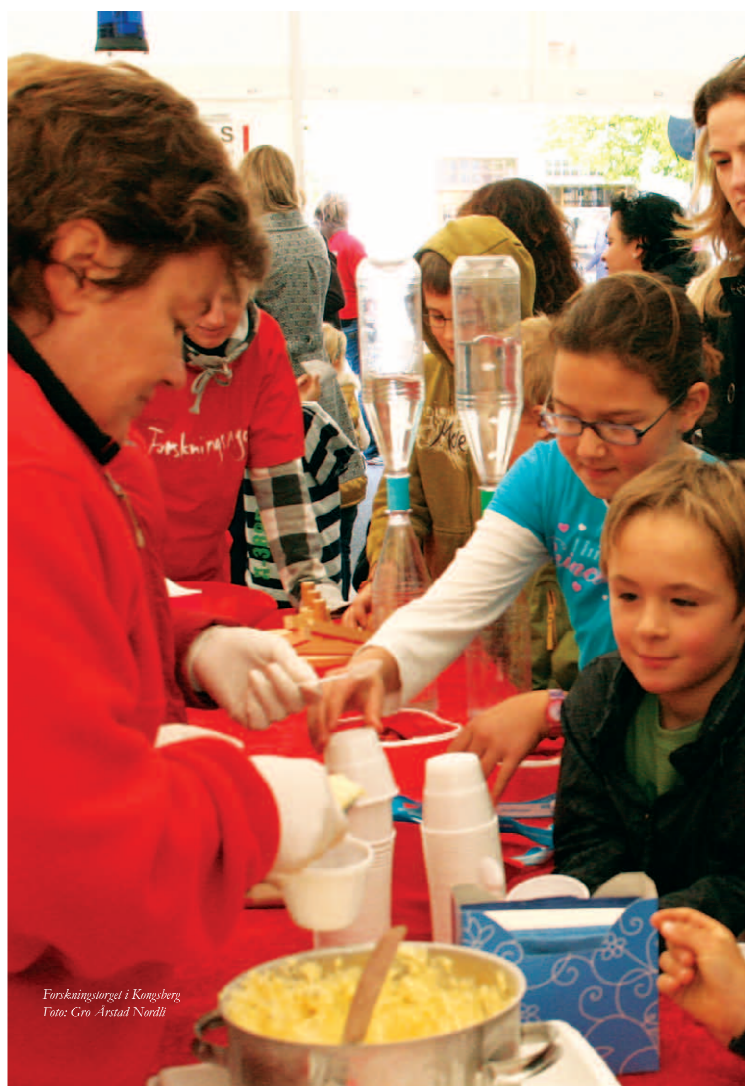
Forskningstorget i Kongsberg