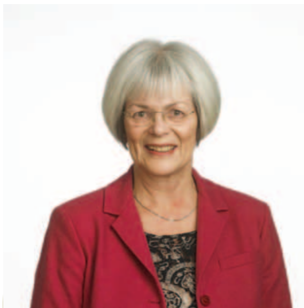
Statsråd Tora Aasland

Oslofjordalliansen er et utdanningsamarbeid mellom Universitetet for miljø- og biovitenskap (UMB), Høgskolen i Buskerud (HiBU), Høgskolen i Vestfold (HVE) og Høgskolen i Østfold (HiØ).