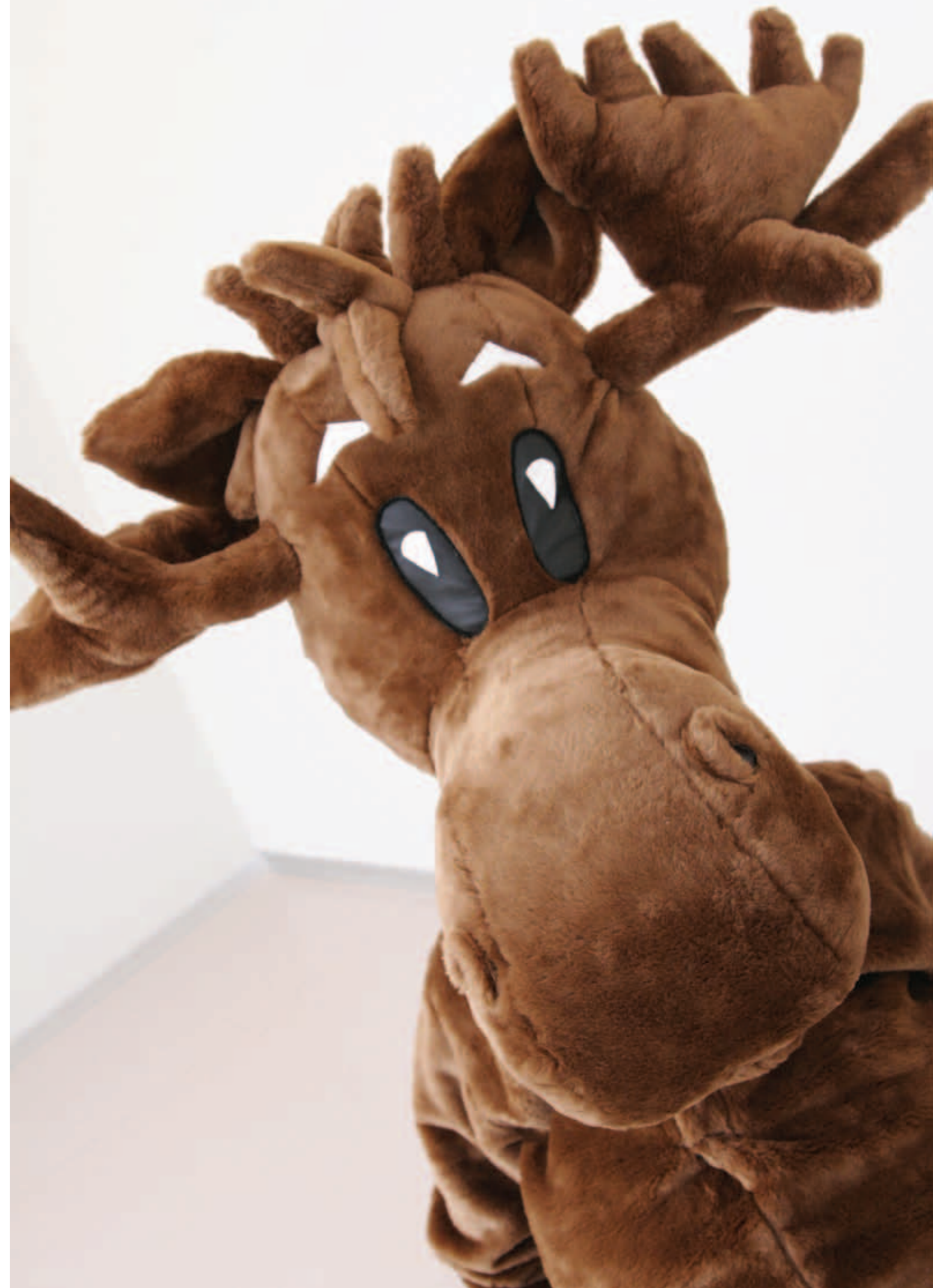
Studentparlamentets maskot "Mooses"

SPiB har også fokusert på nettsiden HiBuStudent ( www.hibu.no/student ). Her har studentene tilgang på informasjon om SPiB og aktuelle saker for studentene.