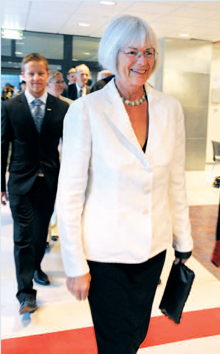
Forsknings- og høyere utdanningsminister Tora Aasland holdt årets tale til de nye studentene ved NHH under immatrikuleringen i august.