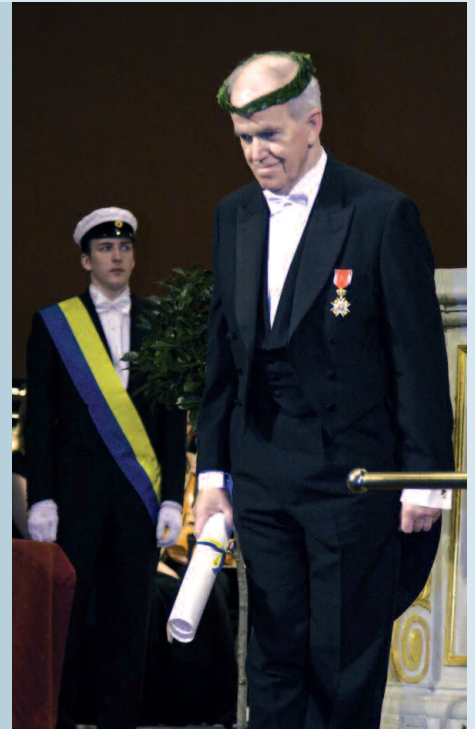
I januar ble professor Agnar Sandmo utnevnt til æresdoktor ved Uppsala universitet for sin forskning innenfor offentlig økonomi.