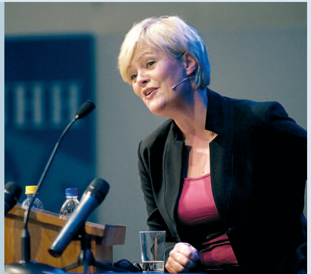
Finansminister Kristin Halvorsen holdt Lehmkuhlforedrag i september med tittelen: Den Nordiske velferdsmodellen.