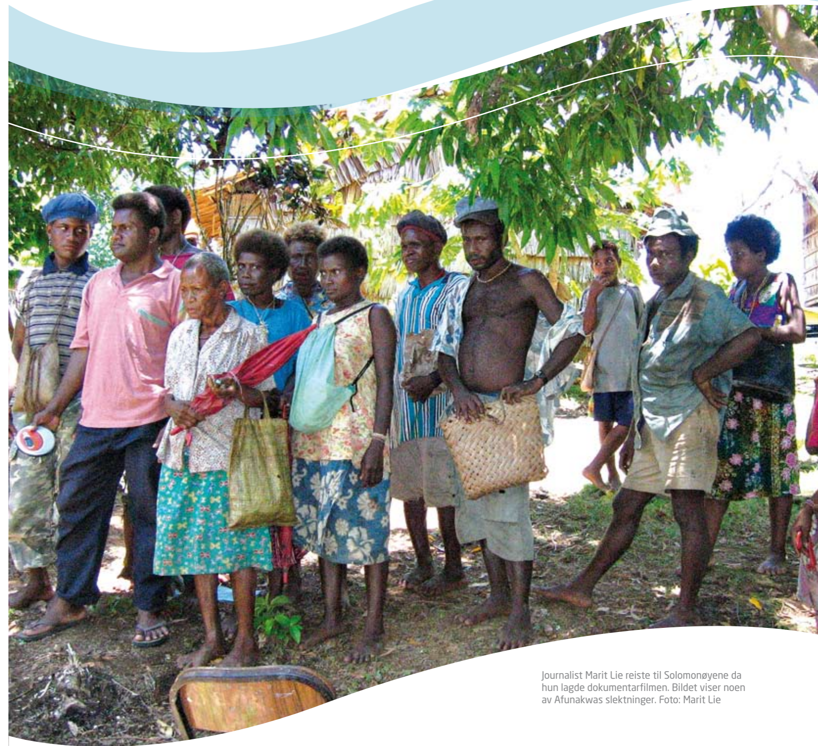
Journalist Marit Lie reiste til Solomonøyene da hun lagde dokumentarfilmen. Bildet viser noen av Afunakwas slektninger.

UNESCO-kommisjonens mål med dokumentaren er å bidra til økt oppmerksomhet og debatt om behovet for regulering og beskyttelse av grupper som mangler rettigheter. Brukspotensialet for filmen er faglige fora i og utenfor Norge der ovennevnte tema blir behandlet. UNESCO-kommisjonen har vist filmen for relevante personer i UNESCO i Paris, og filmen er i tillegg overlevert til Kultur- og kirkedepartementet, som fagansvarlig departement for immateriell kulturarv.