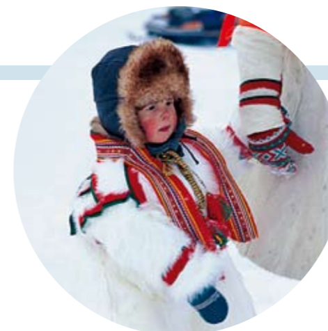
Det er høyt skolefravall blant unge gutter i Arktis, men det er forsket lite på årsakene.

UTDANNING er en grunnleggende menneskerettighet. UNESCO regner dessuten utdanning som et av de mest effektive virkemidlene mot fattigdom. I dag er 25 prosent av jordens befolkning analfabeter. Programmet Utdanning for alle (Education for all, EFA) har som mål at alle skal ha tilgang til grunnutdanning innen 2015. EFA er UNESCOs viktigste satsning, og programmet er sentralt i arbeidet for å nå FNs tusenårsmål 2: Grunnutdanning for alle.