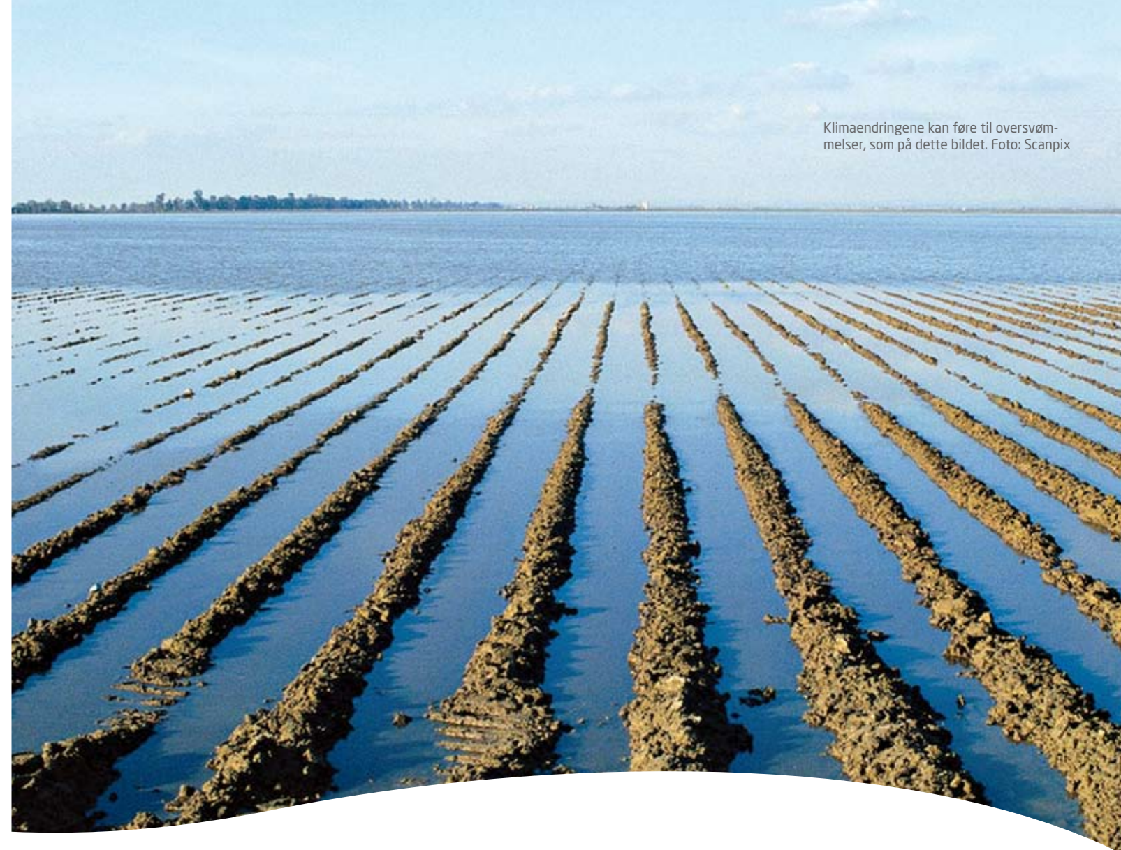
Klimaendringene kan føre til oversvømmelser, som på dette bildet.

Randers' konkrete forslag var økt energi-effektivitet (som effektive biler og effektivt transport-opplegg), fossilt brennstoff erstattet med fornybar energi (mer vind, sol og biomasse) og reduserte utslipp fra ikke-energikilder.