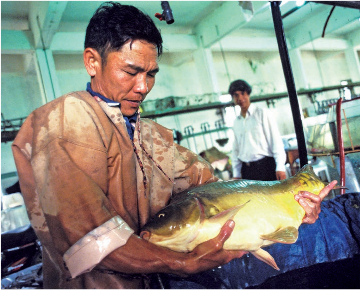
Norsk bistand på fiskerisektoren har spilt en positiv rolle i å støtte fiskeriutvikling i samarbeidsland, det er hovedkonklusjonen i fiskerieuvalueringen fra 2008.

For å stimulere til økt evalueringskompetanse i norske miljøer tok Norad, i samarbeid med Høgskolen i Oslo, initiativ til en konferanse i juni 2008 om "evaluering av det komplekse". Konferansen hadde en rekke internasjonale størrelser på talerlisten, og det var svært stor interesse for å delta. Som en konkret oppfølging av konferansen vil det i mai 2009 bli dannet en egen evalueringsforening i Norge. Norad deltar også i EVAforum, et samarbeidsorgan for evaluering der representanter for statlige organer møtes.