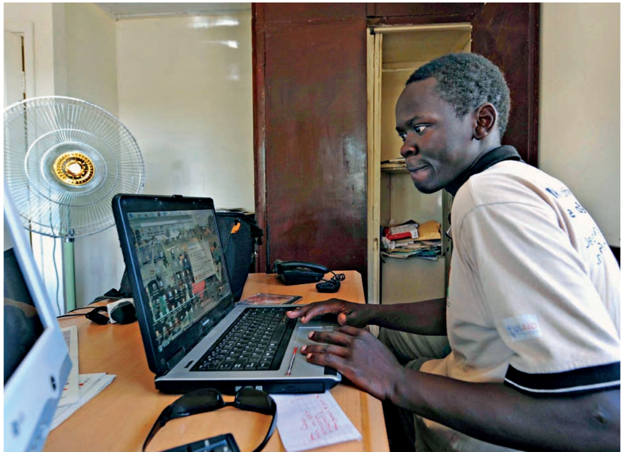
Resultatrapport 2008 viste til gode resultater bl.a. innen elektrifisering av landsbygda i Nepal og ikke minst for jenters utdanning i store deler av verden. Den viste mer blandede resultater innen støtten til styresett. Her en illustrasjon fra Sør-Sudan.

evalueringer, forskningsarbeid, rapporter etc. En egen side med grafisk framstilling av nøkkeltall i norsk bistand har blitt publisert på Norads hjemmeside i løpet av 2008. For å bedre kvaliteten på norsk bistandsstatistikk har Norad gjennomgått og forbedret statistikk-klassifiseringen på enkelte områder, som f.eks. flyktningetil-tak i Norge. Norad har i tillegg utarbeidet en klimamarkør, som innføres i rapporteringssystemene for norsk bistand fra 2009. Dette vil gi bedre oversikt og økt sporbarhet i forhold til aktiviteter på klimaområdet.