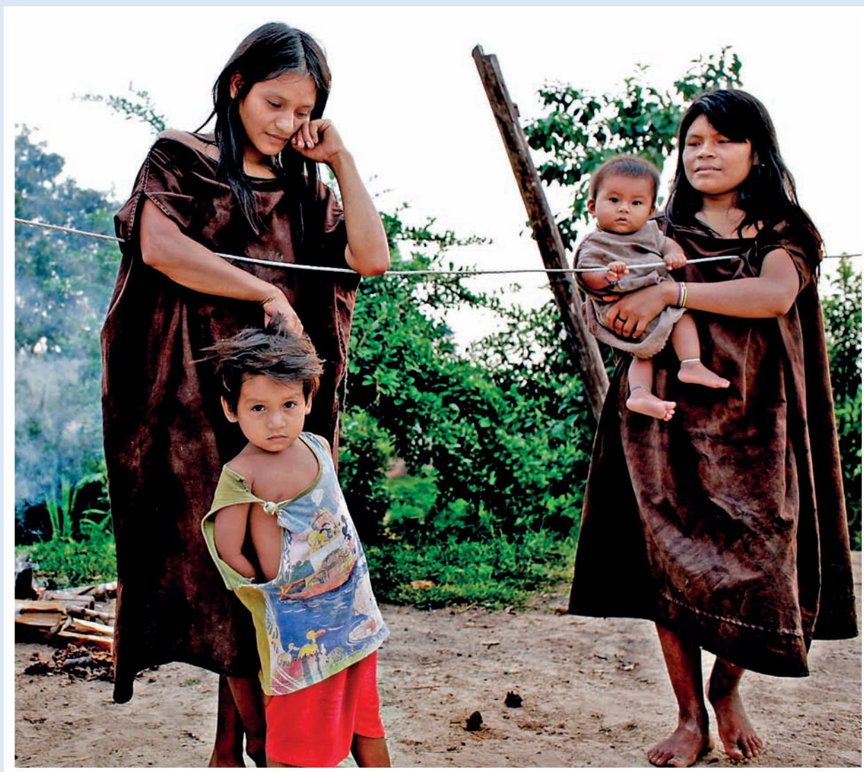
En viktig del av arbeidet på urfolksområdet og en stor utfordring er å integrere hensynet til urfolks rettigheter i utviklingssamarbeidet, spesielt i prioriterte innsatser som på klima- og skogområdet og i vannkraftprosjekter. Bildet er fra et naturreservat i Amazonas.

prosjekter. I 2008 har Norad bidratt med innspill for å styrke urfolksperspektivet i den norske klima- og skoginnsatsen. Det er også avholdt miniseminar med Olje for Utvikling om norske internasjonale forpliktelser, urfolks rettigheter og olje- og gassutvinning.