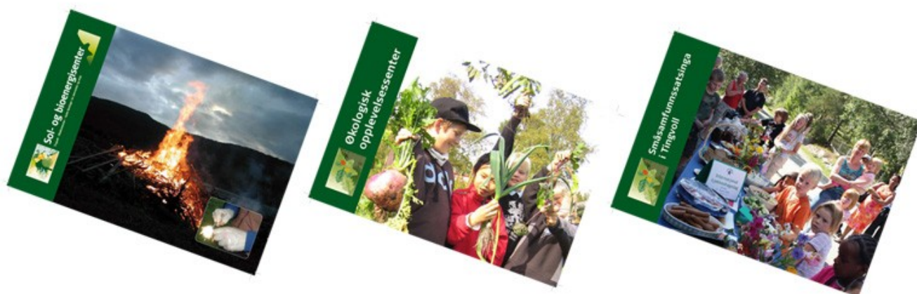
Det er gitt ut flere brosjyrer om blant annet småsamfunnsatsinga og opplevelsessenter på Tingvoll gard.

Videre planlegging av kunnskaps- og opplevelsessenter, bygging av ny driftsbygning og videreføring av nydyrking er hovedoppgavene i 2008. For å videreutvikle NORSØK og Tingvoll gard som en ressurs for økologisk landbruk, lokalsamfunnet og regionen er det viktig å videreføre det positive samarbeidet med Tingvoll kommune og Møre og Romsdal Fylke.