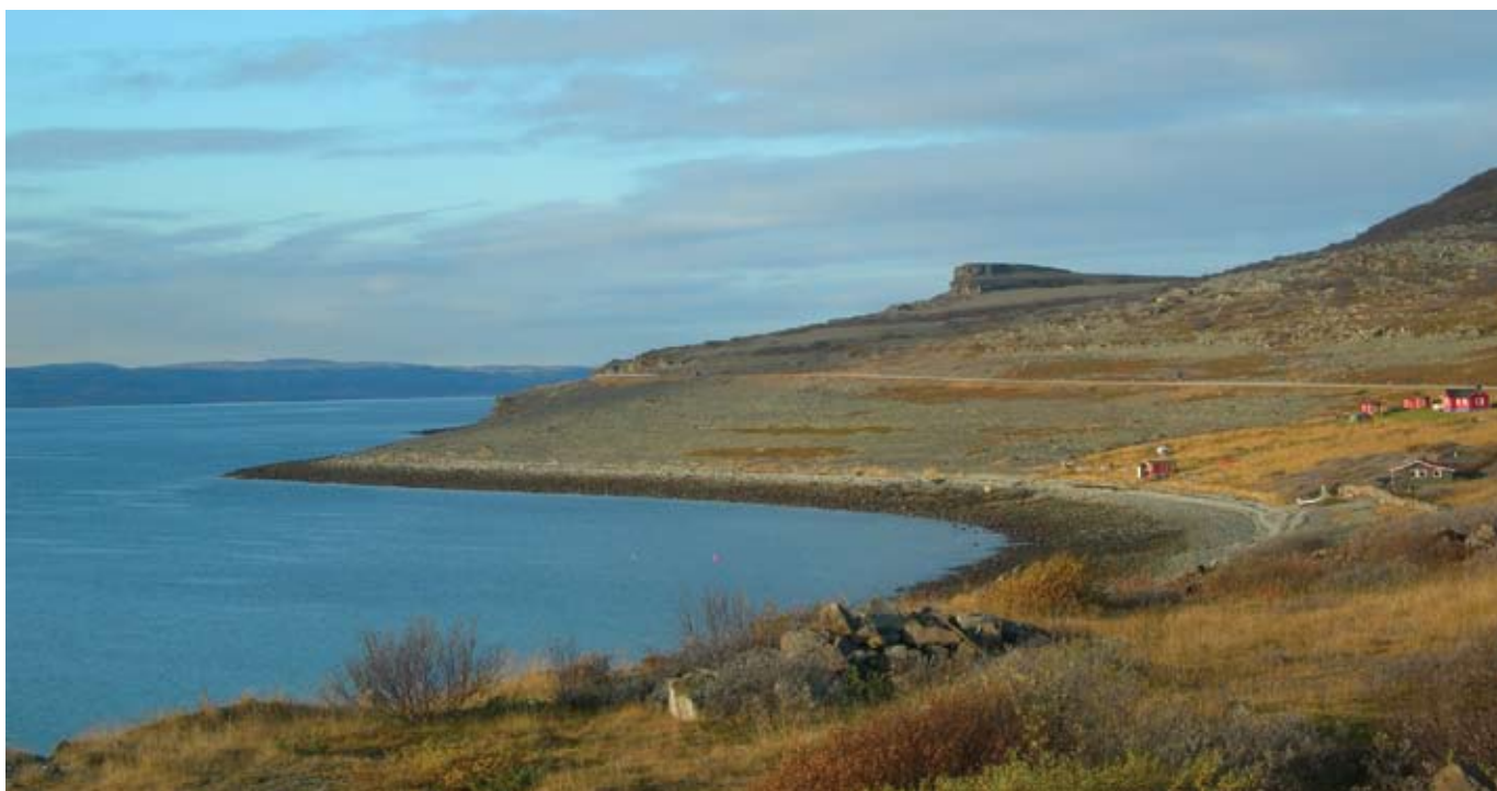
Fjellformasjonen Gahpera er et samisk helligsted på grensa mellom Vadsø kommune og Unjárgga gielda/ Nesseby kommune. Gahpera var i følge Knud Lem (1767)

vurdering av sårbarhet og tålegrenser i forhold til bruk. Prosjektet har hatt en bred tilnærming til forvaltning av denne typen kulturminner, fordi man her har å gjøre med et abstrakt begrep, hellig, som definerer et fysisk landskap. Det har vært nødvendig å utrede hvordan det abstrakte skal gis en konkret avgrensning i et landskap. Mange helligsteder består av naturformasjoner uten menneskeskapte spor. Størrelsen på disse kulturminnene kan variere fra hele fjell og innsjøer til trær og mindre, jordfaste steiner. Disse stedene er i liten grad registrert og kartfestet. NIKU har foreslått en metodikk for vurdering av om et sted kan forstås som et helligsted og for avgrensning av helligstedet. I tillegg til skriftlige kilder er intervjuer med samiske tradisjonsbærere et bærende element i den foreslåtte metodikken. Kunnskapen om de samiske helligstedene er viktig for den fremtidige forvaltningen av kulturminnene og for personer og grupper i det samiske bosetningsområdet.