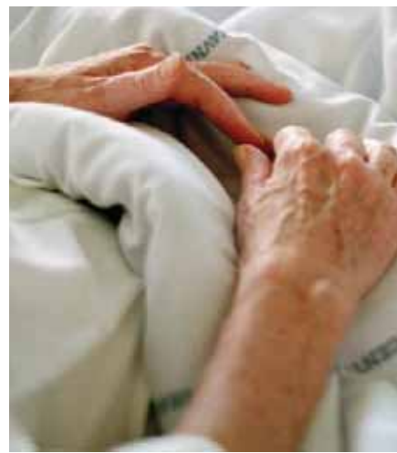
Det er gjennomført en rekke tilsyn også på helsesida, men her stilles det spørsmålstegn ved læringseffekten av tilsynene.