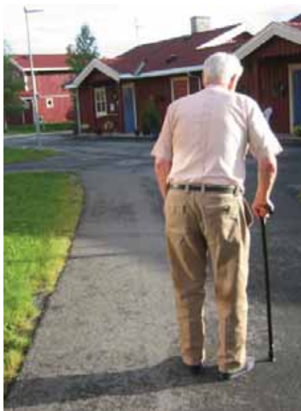
Opplendingene blir eldre og eldre. Dette gir selvsagt utfordringer innen helse og omsorgssektoren.

Basert på Kapittel 1 Om embetet, 1.1 Tilstanden i embetet og fylket – generelt, Utviklingstrekk i Oppland, i elektronisk årsmelding.