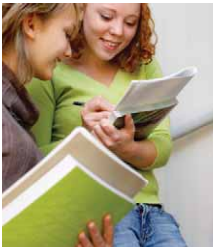
Det er gjennomført en rekke tilsyn på utdanningsområdet, både i tråd med nasjonale oppdrag og egeninitierte. Fylkesmannen opplever at godt gjennomført tilsyn er et viktig virkemiddel for å sikre regelforståelse og etterlevelse.

Det ble ført tilsyn med fylkets sju barneverninstitusjoner. Samtlige institusjoner.