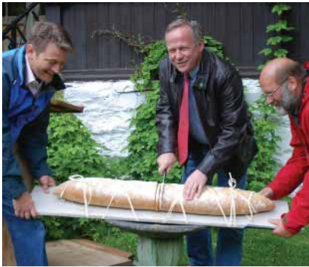
Flankert av to ordførere åpnet landbruks- og matminister Lars Peder Brekk "mat-ruta" fra Ottadalen til Sogn.

Basert på 2.5 Landbruksbasert forvaltning og næringsutvikling, naturressursforvaltning og miljøvern i elektronisk årsmelding.