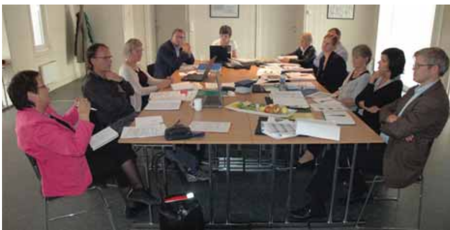
Det var styringsdialog mellom Kunnskapsdepartementet og Utdanningsdirektoratet - og Fylkesmannen i Oppland i 2009.