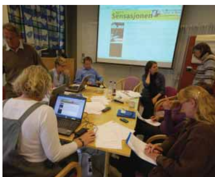
Fylkesmannen hadde tre kriseøvelser i 2009 - den siste av dem i regi av Direktoratet for samfunnssikkerhet og beredskap.

Basert på kapittel 2.6 Samfunnssikkerhet og beredskap i elektronisk årsmelding.