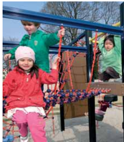
Utbygging av barnehageplasser har vært tema på en rekke møter mellom kommunene og Fylkesmannen.

Det ble startet opp en serie med regionale seminarer om skoleeiers ansvar for systematisk oppfølging av læringsresultater i 2008. Disse seminarene er videreført og gjennomført i alle regionene. En tilsvarende samling er holdt for de private grunnskolene. Dette er en oppfølging av resultatene fra tilsynet i 2007 og 2008 om tilpasset opplæring. Fylkesmannen har aktivt fulgt opp St.meld. nr. 31 (2007/2008) gjennom sitt samarbeid med skoleeiere, høgskoler og lærerorganisasjoner i en strategisk gruppe på fylkesplan, gjennom to skoleledersamlinger, egne møter med lærerorganisasjonene, med fylkeskommunen og pp-tjenesten i fylket.