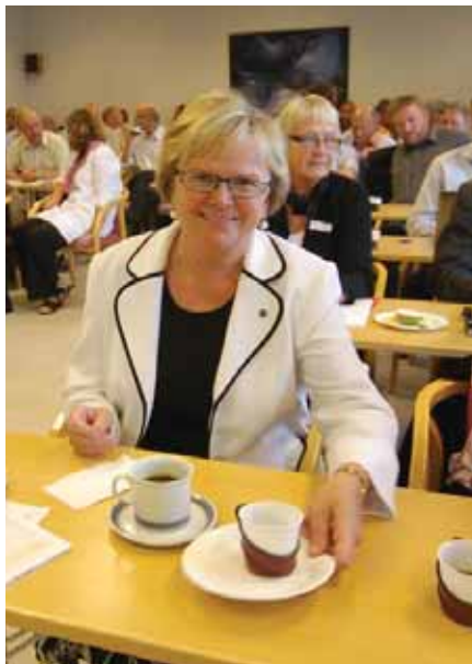
...mens kommunal- og regionalminister Magnhild Meltveit Kleppa hadde svart kaffe til kommuneøkonomikonferansen.