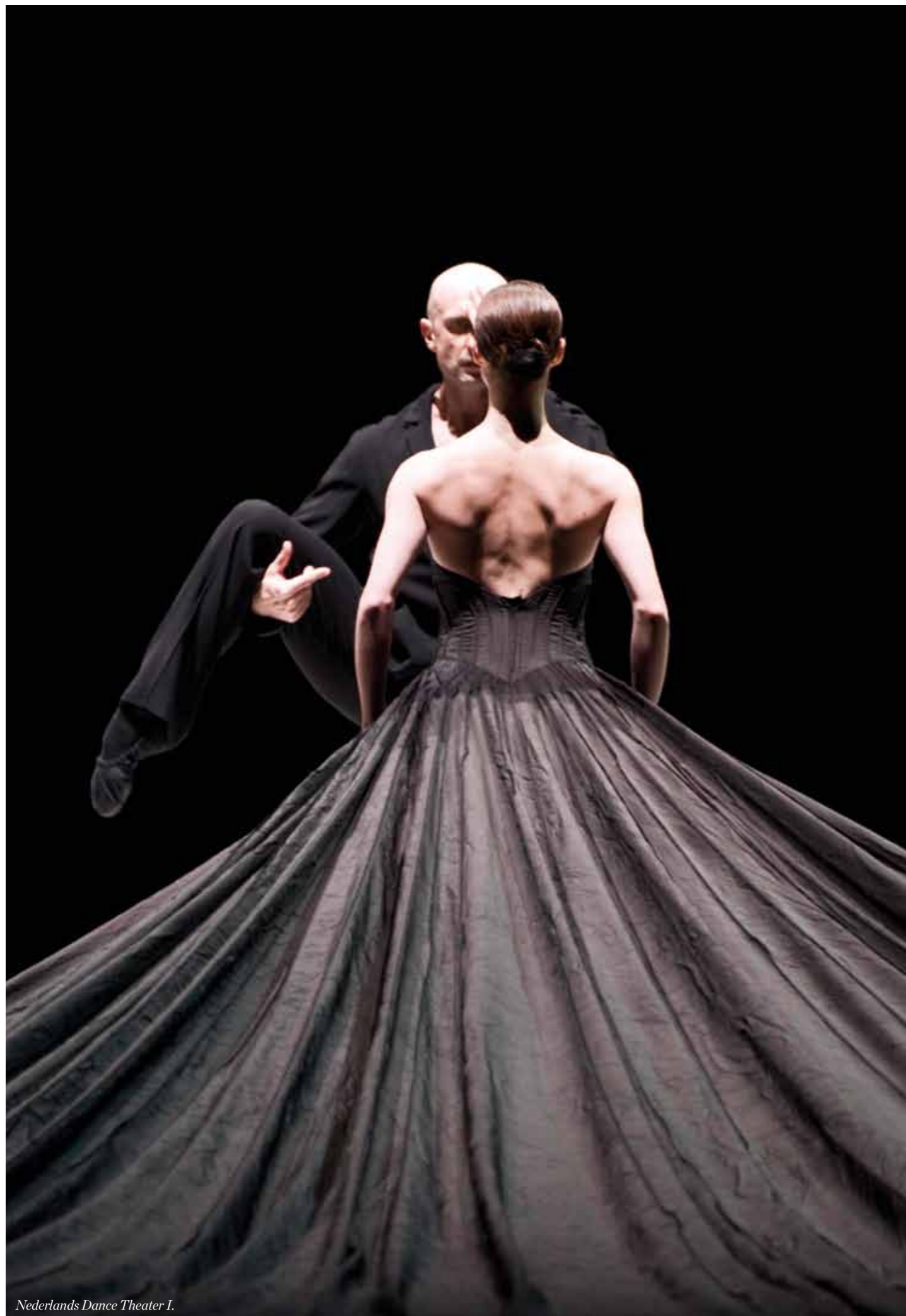
Nederlands Dance Theater I.

León, Sol 4 x Paul Lightfoot & Sol León Lightfoot, Paul 4 x Paul Lightfoot & Sol León Proietto, Daniel Balletlaboratoriet, Scene 2 Strømgren, Jo Partita / Septemberdans 2009 Støvind, Kristian I tid og rom / Goecke + galla Øyen, Alan Lucien Balletlaboratoriet Scene 2