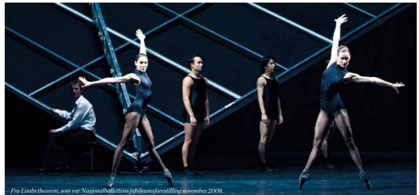
Fra Limbs theorem , som var Nasjonalballettens jubileumsforestilling november 2008.