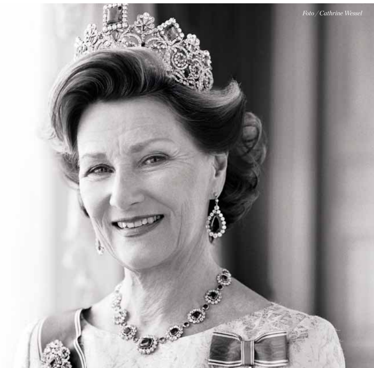
H.M. DRONNING SONJA

Den Norske Opera & Balletts høye beskytter