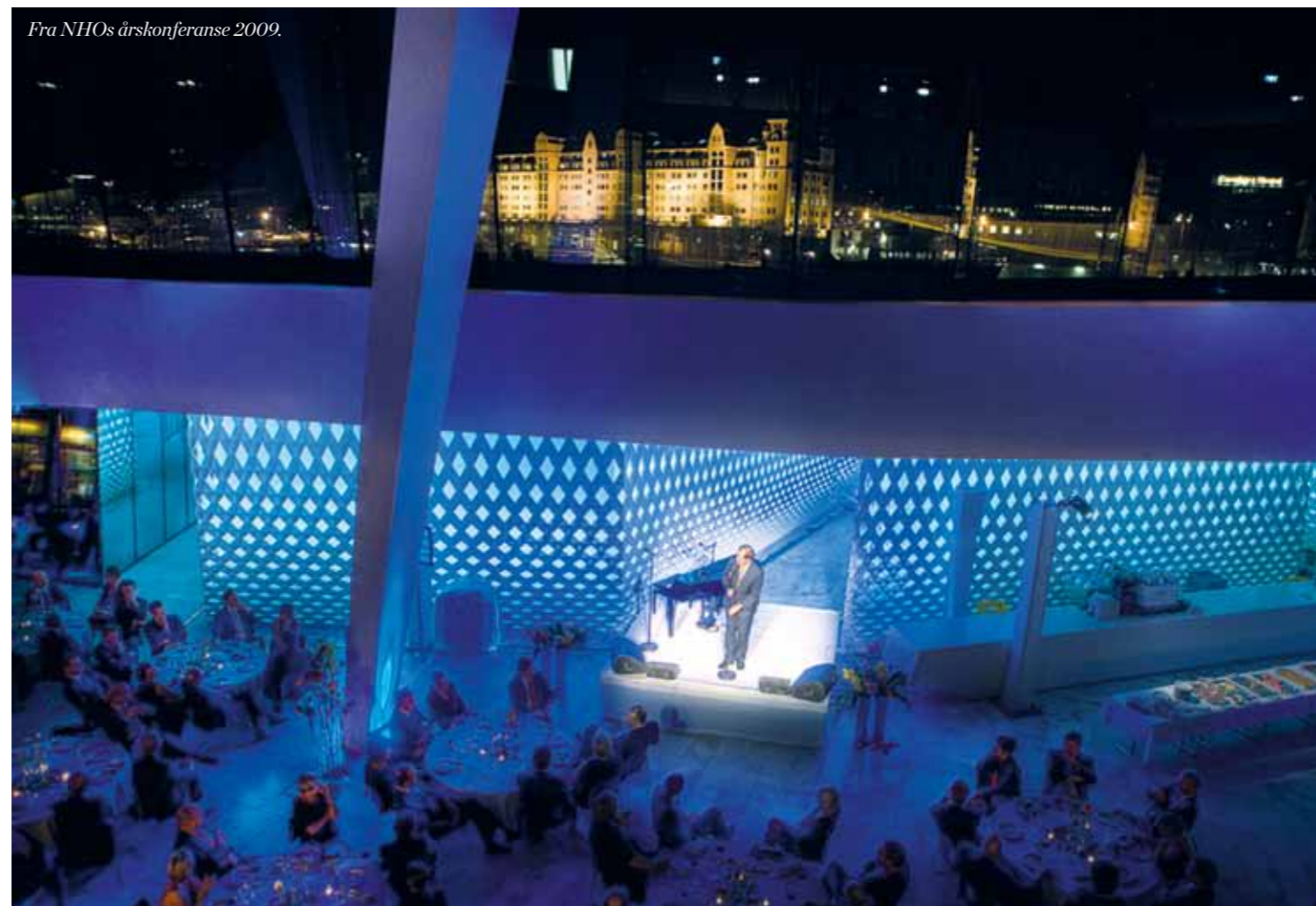
Fra NHOs årskonferanse 2009.