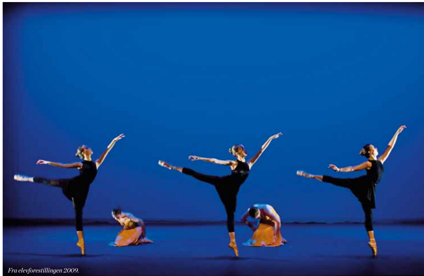
Fra elevforestillingen 2009.