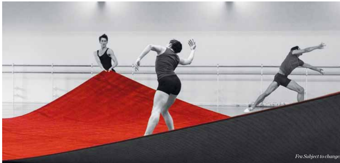
Fra Subject to change.