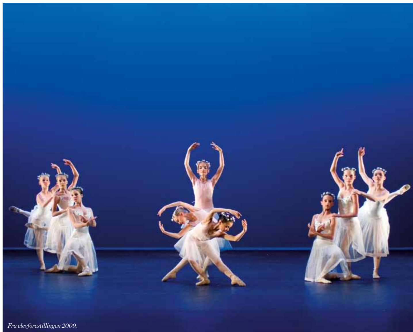
Fra elevforestillingen 2009.