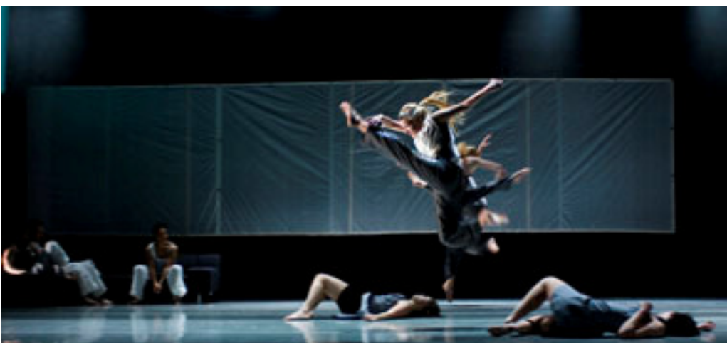
Fra 30-års jubileet til Balletthøgskolen, høsten 2009. 2. og 3. års BA studenter i moderne dans og samtidsdans, jazzdans og klassisk ballett, 2. års masterstudenter i koreografi.