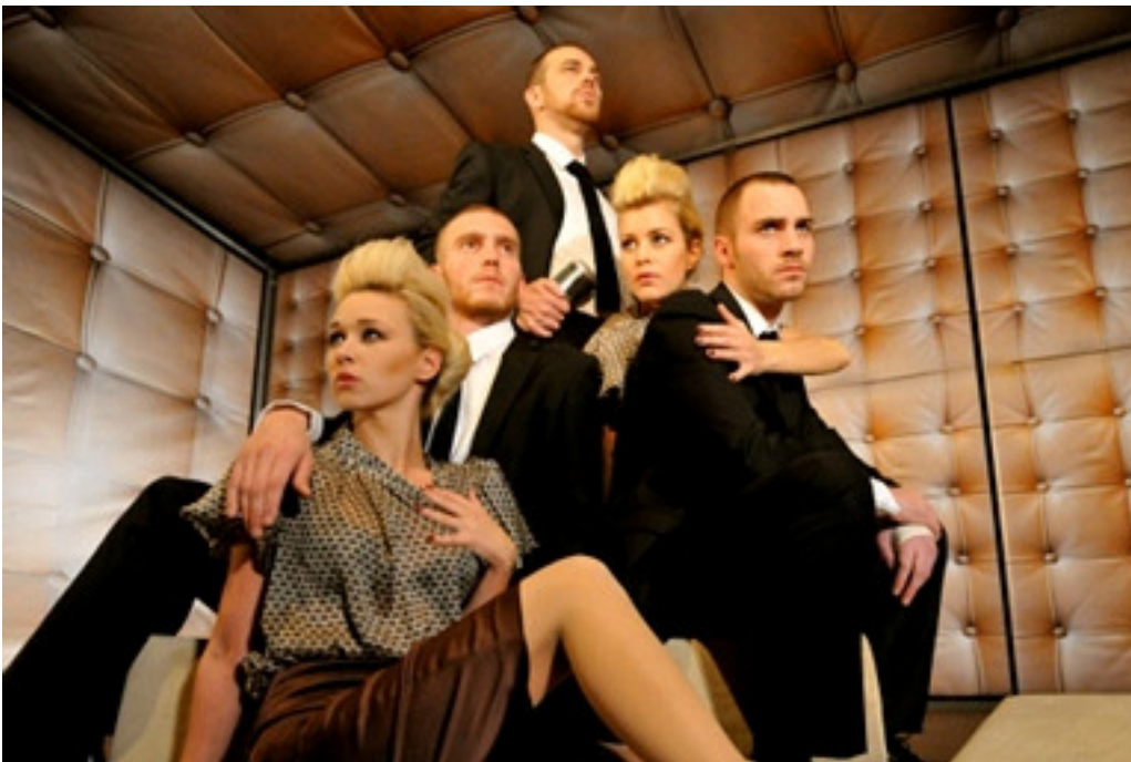
Forestillingen Antigone, høsten 2009, 2MA regi og påbyggingsstudiet i skuespillerfag.