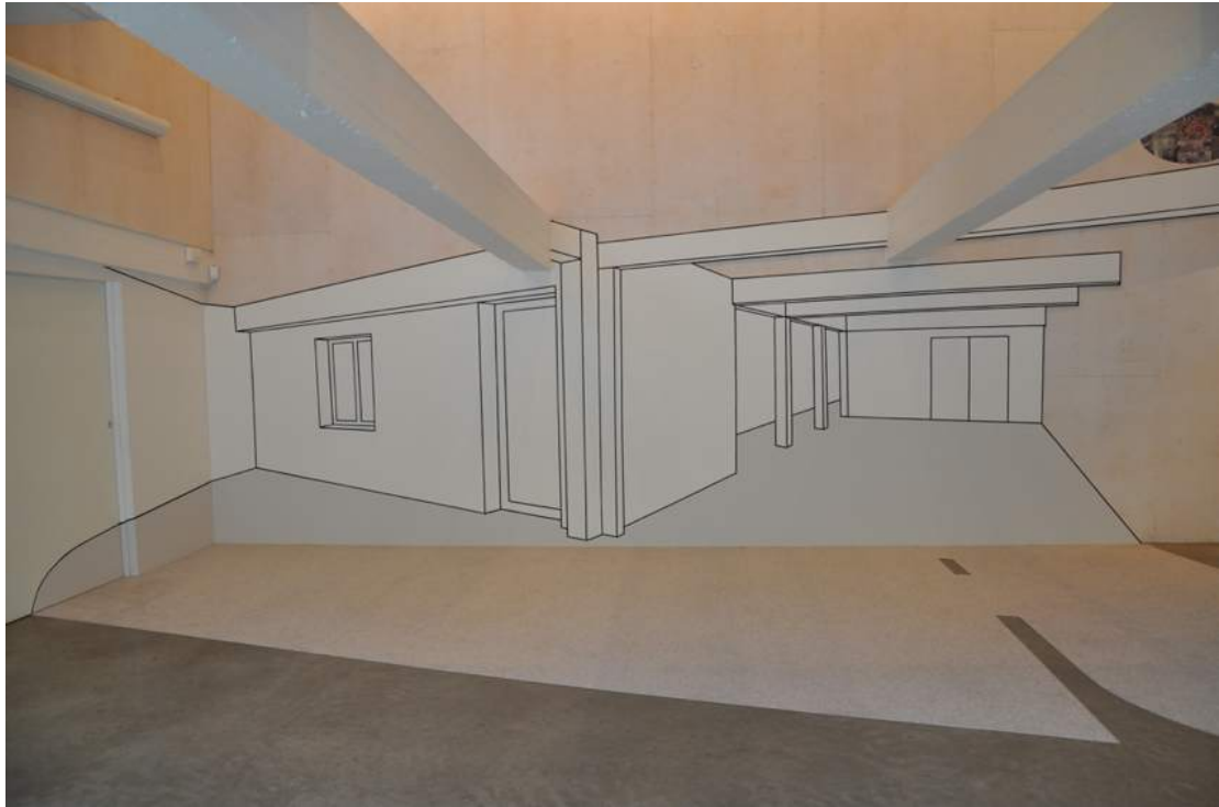
Fra utstillingen Pivotpunkt av Tina Aamodt 2009