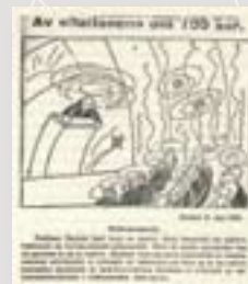
Fra Riksarkivets nettutstilling Månedens dokument: Albert Einsteins Norgesbesøk i 1920 fra 2009.