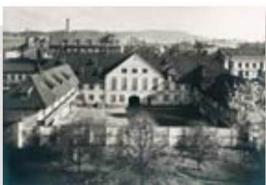
Tukkhusbygningen i Kristiania fotografert rundt 1910.

Informasjonssystemet Asta er det sentrale systemet for å registrere og holde oversikt over depotinstitusjonenes arkivmateriale. Videreutvikling skjer i regi av Stiftelsen Asta, i samarbeid mellom Arkivverket, Landslaget for lokal- og privatarkiv (LLP) og ABM-utvikling. Alle institusjonene i Arkivverket har tatt i bruk den siste versjonen, Asta 5.