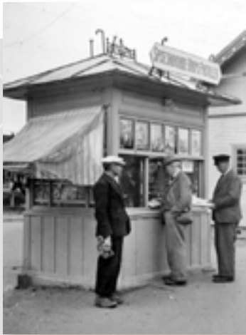
Alvdal jernbanekiosk 1940.