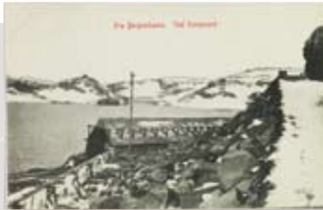
Bergensbanen, Ved Taugevann, prod.nr 1374, PA-1522/Un/L0014