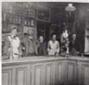
Fra butikken til Sagenes kooperative Selskap, Oslo. Bildet er tatt i 1904. PA-1394, Ub L0008