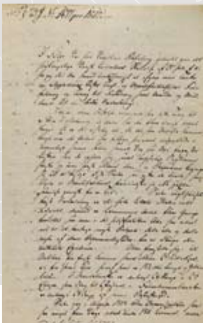
Fra Riksarkivets nettutstilling Månedens dokument: Kristiania tukthus: Tre i hver seng fra 2009. Avfotografert og bearbejdet av Odd Amundsen.

Samkatalogen for privatarkiver hadde ved utgangen av 2009 katalogopplysninger fra 54 depotinstitusjoner. Totalt er det 14 821 arkivskapere og 15 555 arkiver i databasen.