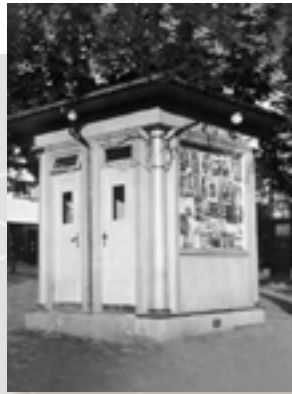
Horten bykiosk 1939, Riksarkivet PA-1522 Narvesen.