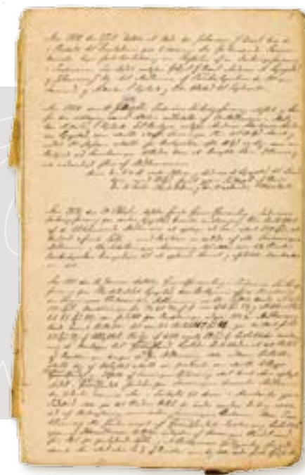
Møteprotokoll for Inderøens Forbruksforening. PA-1394, Coop NKL BA, Fb L0010/3