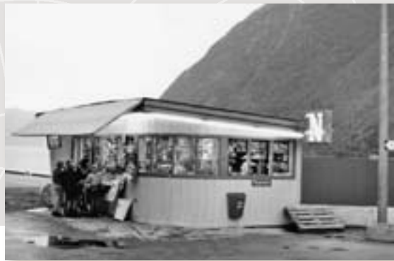
Kiosk i Vik i Sogn 1974.

Arkivet etter Narvesen ble gitt som gave til Riksarkivet høsten 2009.