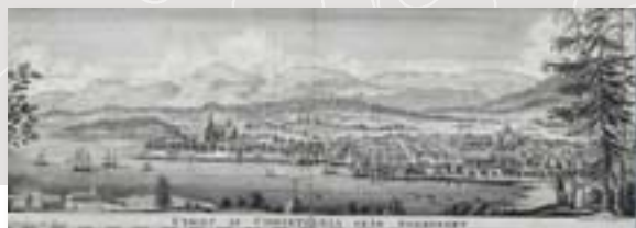
Fra Riksarkivets nettutstilling Månedens dokument: Stipend til mange nyttige formål fra 2009.