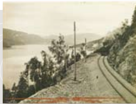
Bergensbanen langs Krøderen, prod.nr 1621, PA-1522/Ua/L0008.

Fra Riksarkivets nettutstilling Månedens dokument: Bergensbanen er 100 år fra 2009.