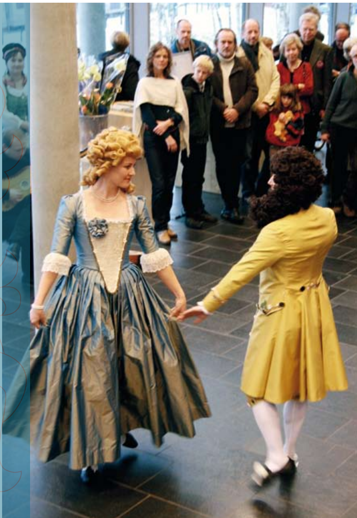
Vel 200 besøkende fikk oppleve utstillingen "Norge i 1743", fransk hoffdans og gode foredrag i riksarkivbygningen da Arkivdagen ble markert.