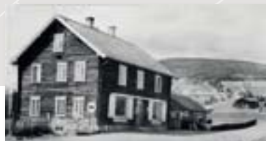
Fra Riksarkivets nettutstilling Månedens dokument: Samvirketaget på Inderøy 1870 fra 2009.