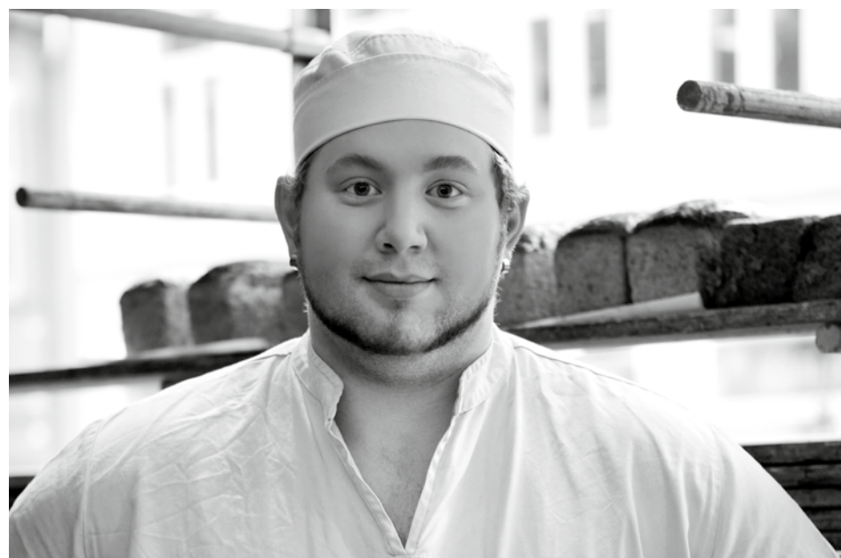
Unge arbeidstakarar er ofte mellombels tilsette, veit lite om risiko og har lite kunnskap om rettar og plikter.

– Det var overraskande at såpass mange arbeidsgivarar ikkje hadde gjennomført særskild risikovurdering knytt til arbeid av ungdom under 18 år. Det kan vere at forskrifta er lite kjend, men det er grunn til å tru at mange arbeidsgivarar bør ta det meir alvorleg at det å ha unge arbeidstakarar fører til at ein må ta ekstra omsyn. Ettersom omfanget av arbeidserfaring og kor moden ein er, varierer frå person til person, må det gjerast ei individuell vurdering av personar under 18 år med omsyn til kva arbeidsoppgåver dei kan utføre, kva dei ikkje kan gjere, og kva slags tilrettelegging som er nødvendig, seier Jon Helge Vaeng, prosjektleder for Arbeidstilsynets nasjonale prosjekt, "Rett start for unge arbeidstakarar".