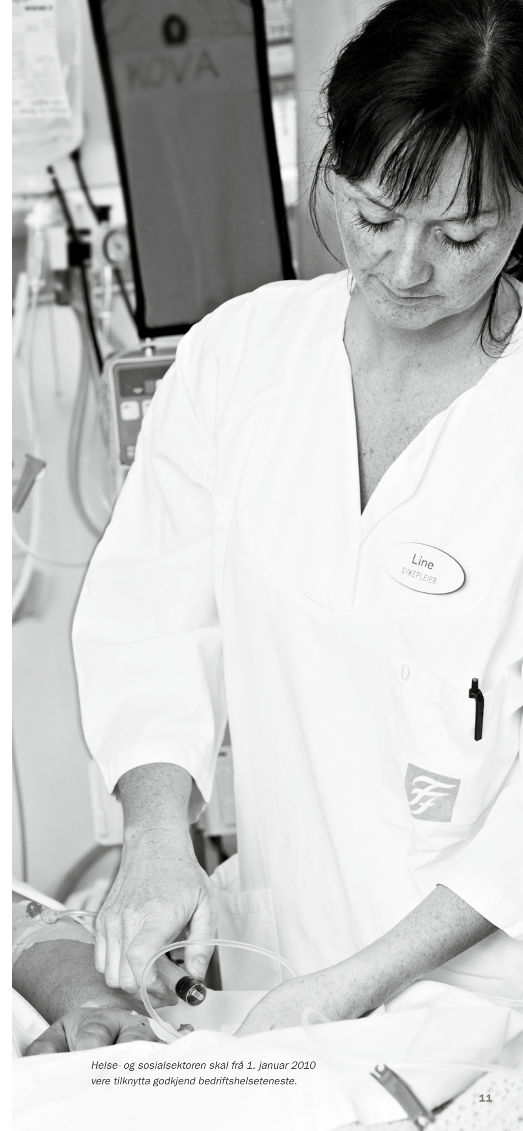
Helse- og sosialsektoren skal frå 1. januar 2010 vere tilknytte godkjend bedriftshelseteneste.

Ei liste over godkjende BHT-er ligg på www.arbeidstilsynet.no/bhtreg . I lista kan ein sjå kven som har søkt, og status for søknaden.