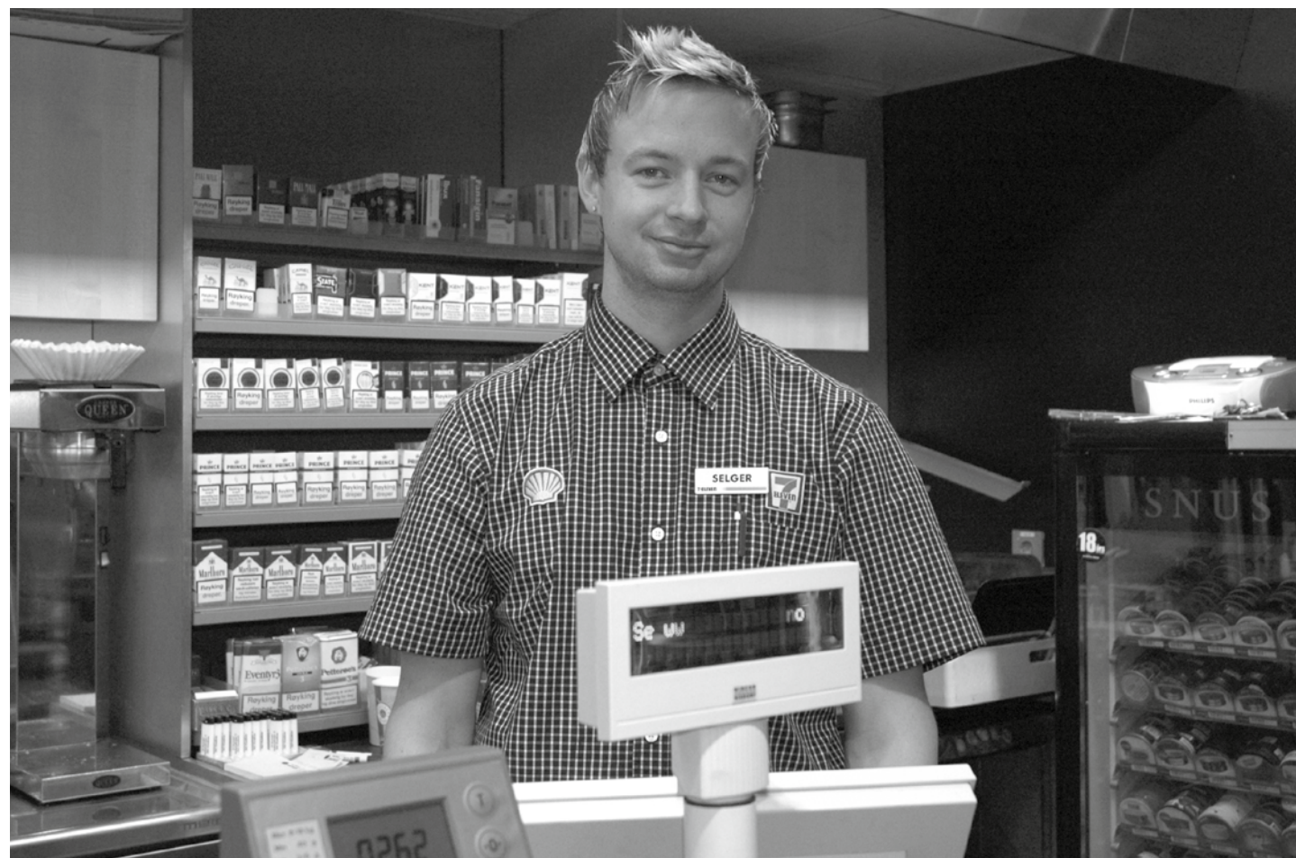
Personar som arbeider åleine eller har kvelds- og nattarbeid er spesielt utsette for vald og truslar. Derfor har Arbeidstilsynet gjennomført tilsyn blant anna ved bensinstasjonar og kioskar.